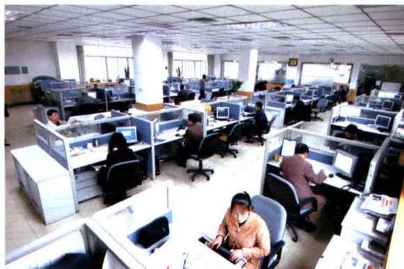
报社新闻采编大厅一角