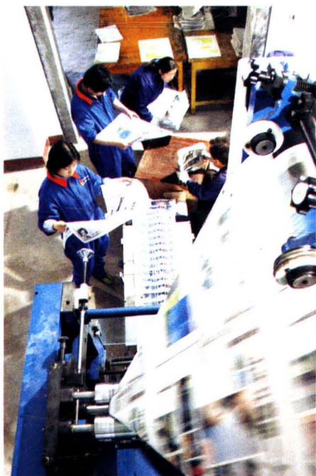
报社印刷厂报纸印刷车间一角