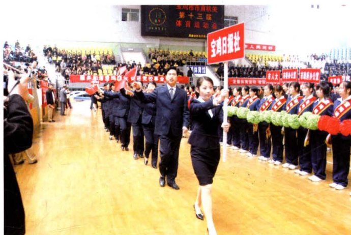
2005年10月14日，宝鸡日报社参加宝鸡第13届市直机关运动会。图为报社代表队在开幕式中入场。张笑侠 摄

2005年11月4日至7日，由宝鸡日报主办的“首届中国国际新闻摄影比赛获奖作品宝鸡首展”在宝鸡火车站广场举行。这次影展是宝鸡历史上举办的规格最高的影展。图为本次活动启动仪式。