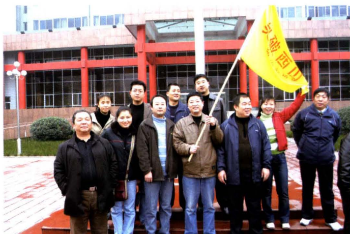
2005年11月18日，宝鸡日报社组织新闻采访团“突破西山”大型采访活动启动仪式隆重举行。