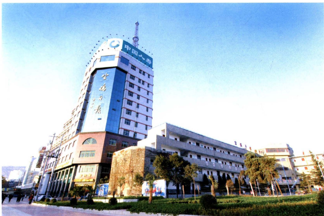
2001年5月建成并交付使用的宝鸡日报社办公大楼