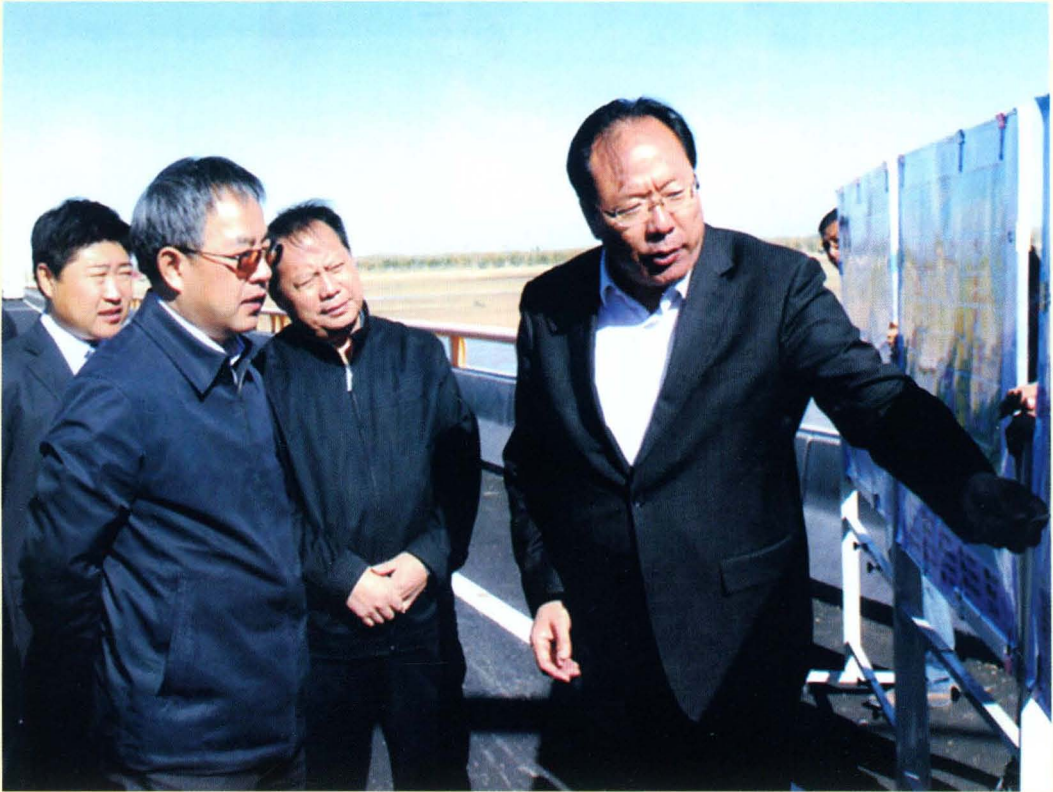
时任自治区党委书记胡春华(右三)视察沿黄公路