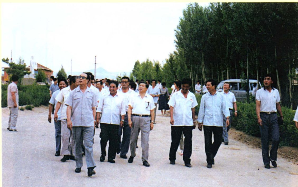
时任交通部部长钱永昌在自治区政府副主席刘作会、交通厅厅长郑长淮、盟委副书记刘峥、副盟长李振国的陪同下视察潮格边养队