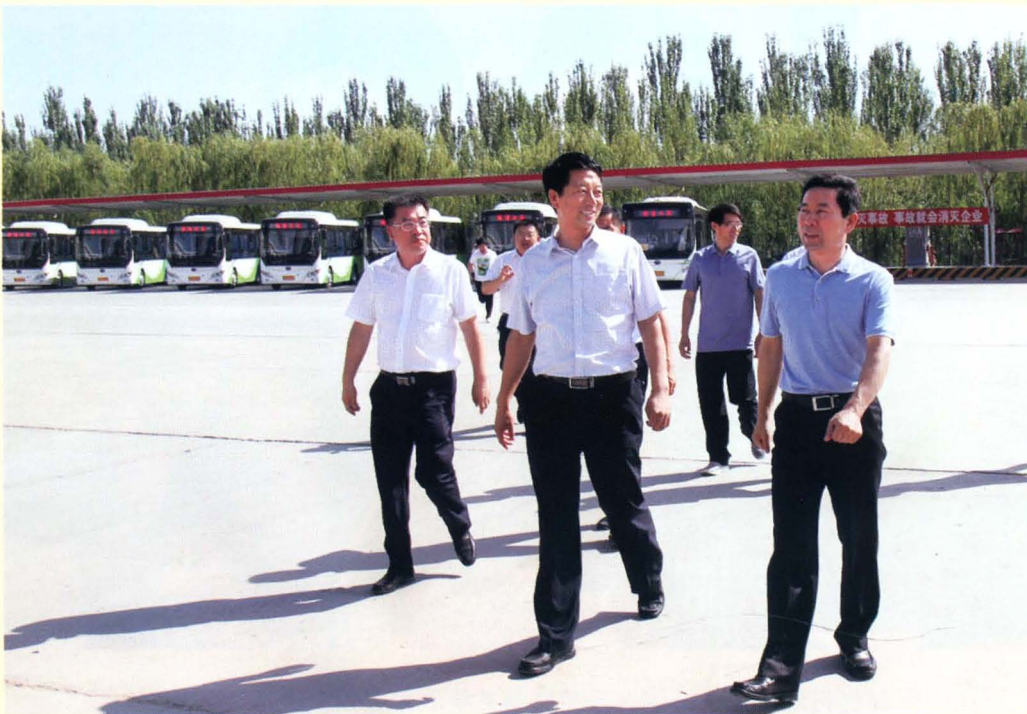
市委书记常志刚在市交通运输局长杨世军陪同下调研市城通公交公司(前排右一常志刚)