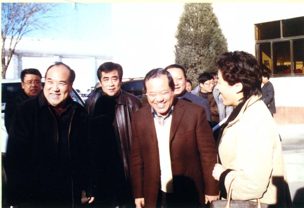
时任行署盟长乌兰，盟委委员、秘书长张向阳 陪同时任自治区交通厅厅长郝继业检查工作（前 排右一乌兰，右二张向阳，左一郝继业）