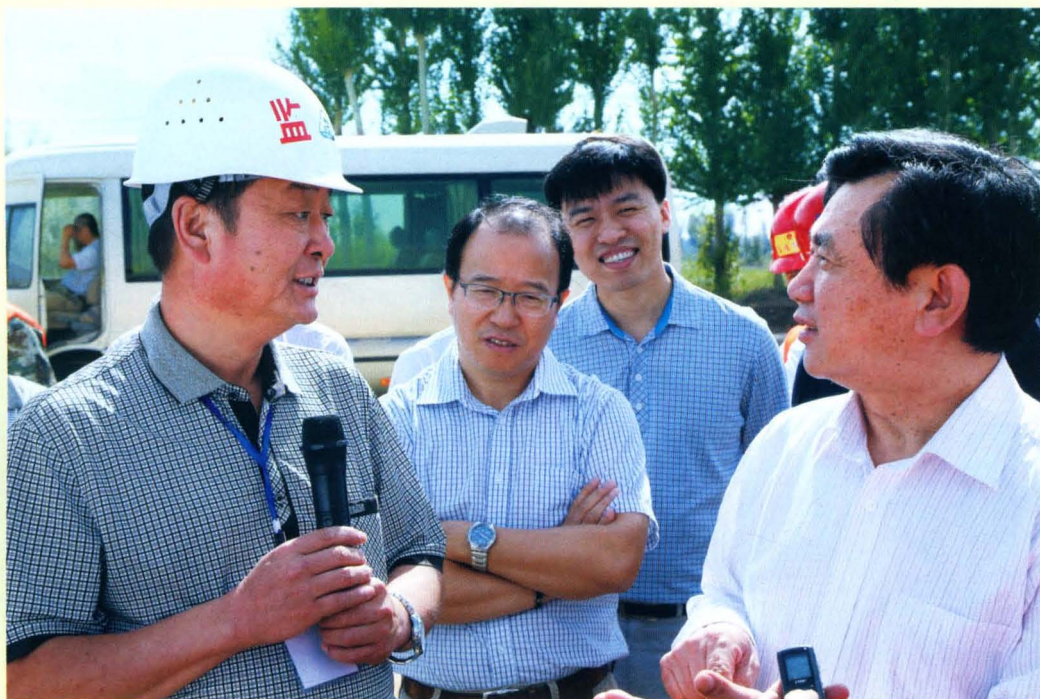
交通部副部长冯正霖(右一)视察交通运输工作