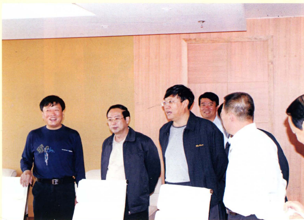
时任自治区交通厅厅长常海(左三)视察工作