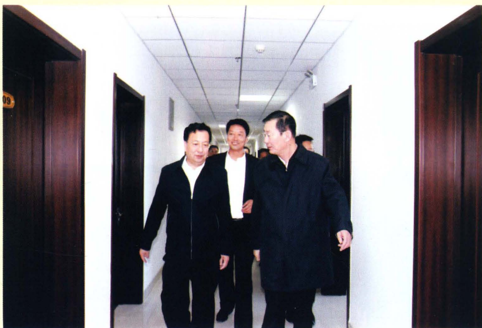
自治区交通厅白智厅长(左二)、杜存副市长(右二)