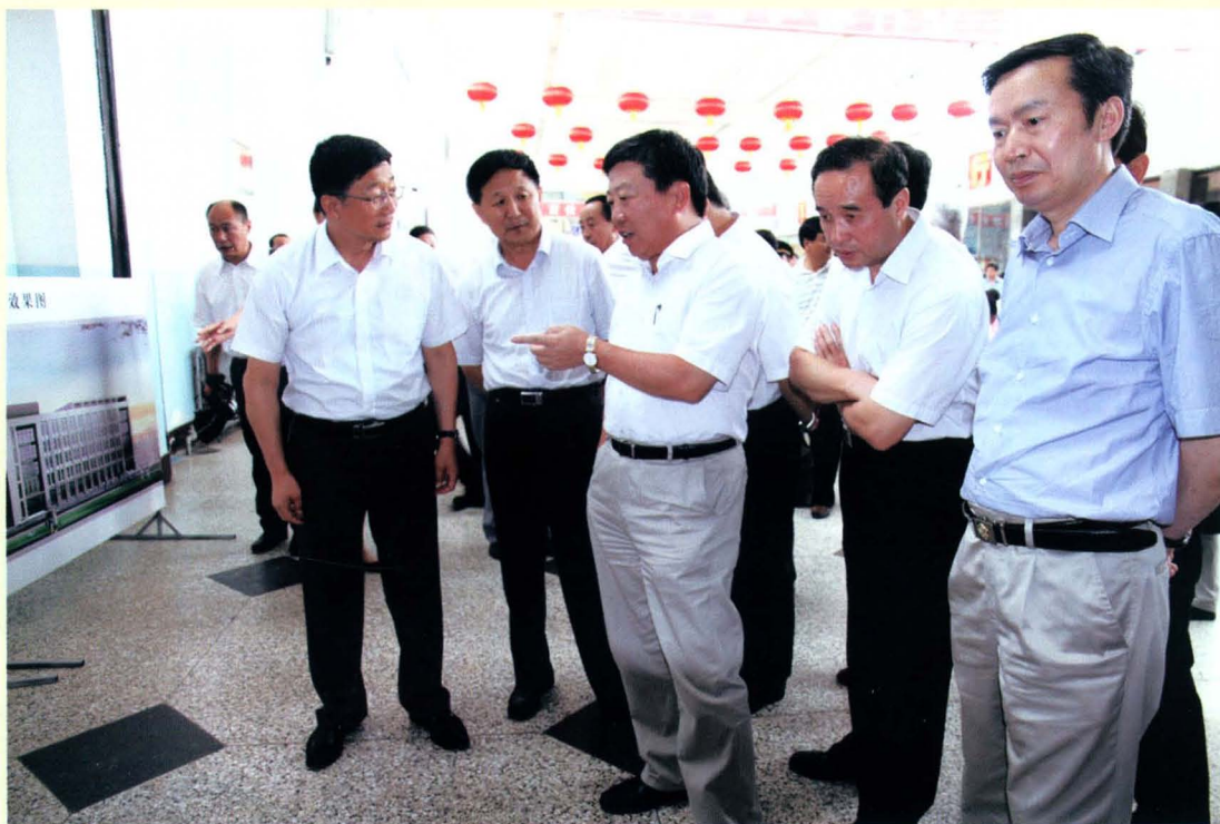
时任交通部副部长高宏峰(右三)调研巴运汽车站