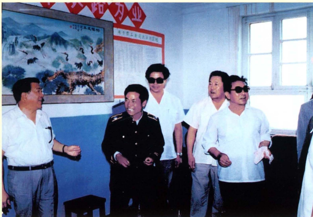
1990年7月,时任国家交通部部长钱永昌(左一),在自治区交通厅厅长郑长淮(右一)、巴盟盟长宝音德力格尔(右三)、盟委副书记刘 崢(右二)陪同下视察潮格边养队明星道班,并与道班班长陈士杰(左二)亲切交谈