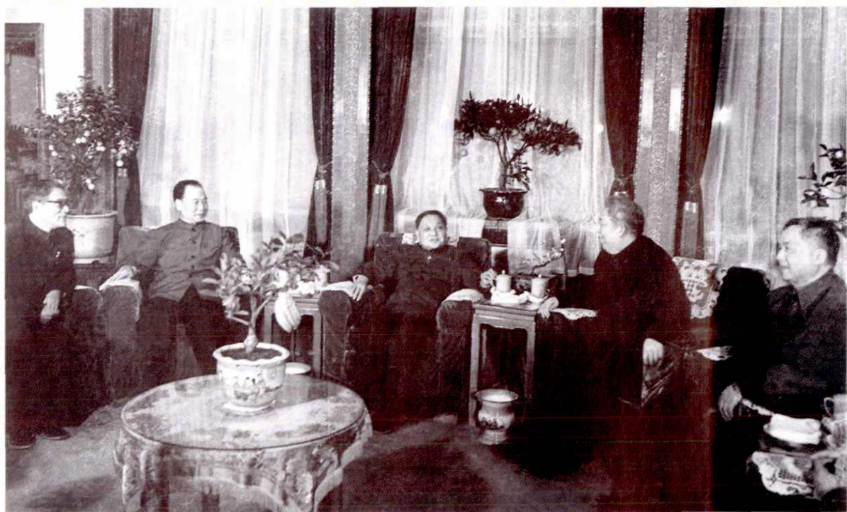
1983年春节，邓小平同志与浙江省主要领导座谈。