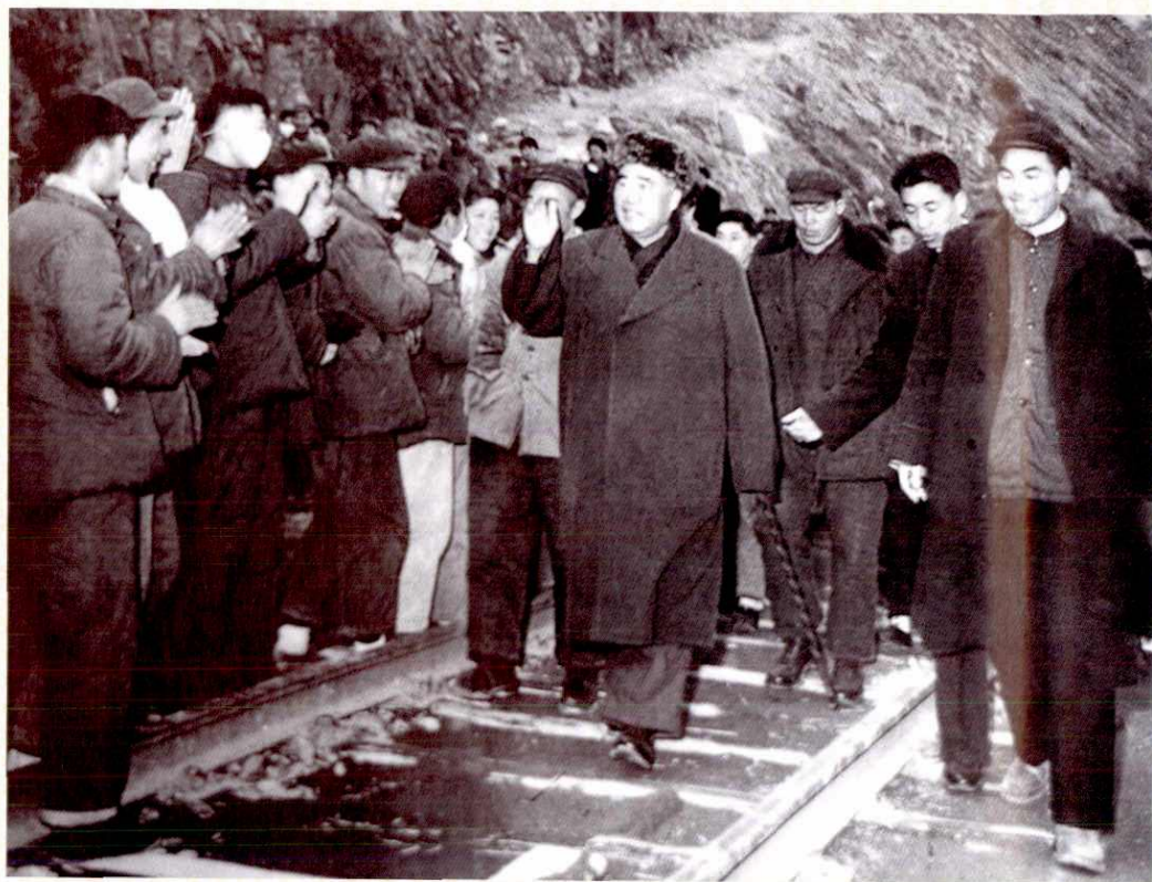
1961年1月31日，中共中央副主席、二届全国人大常委会委员长朱德视察新安江水电站。