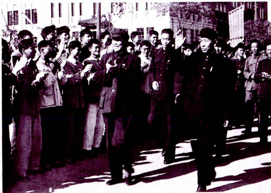
1958年11月2日，中共中央副主席、一届全国人大常委会委员长刘少奇视察浙江大学。