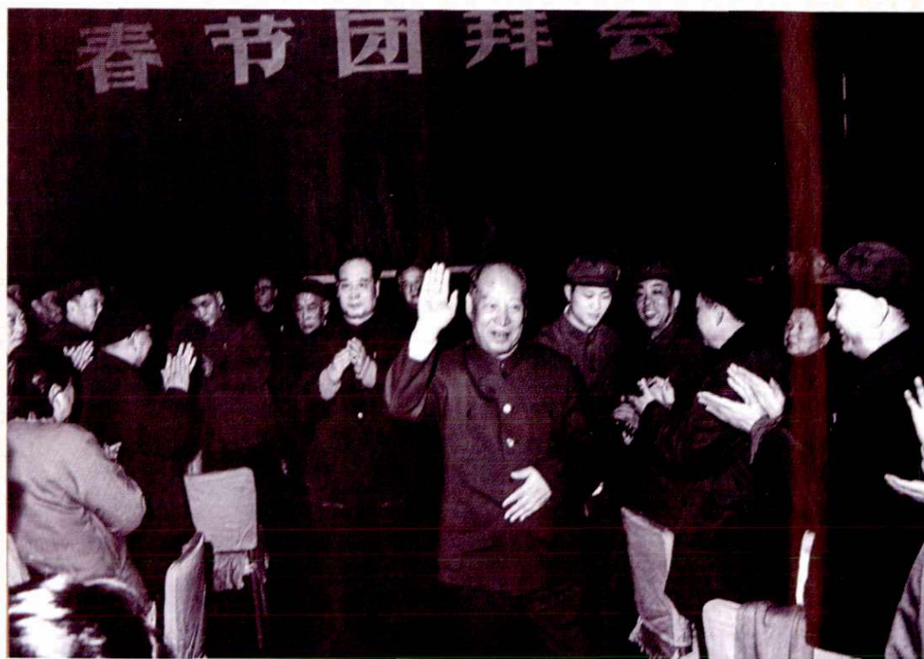
1984年2月1日，六届全国人大常委会委员长彭真在杭州和省市党政军领导以及部分劳动模范共度新春佳节。