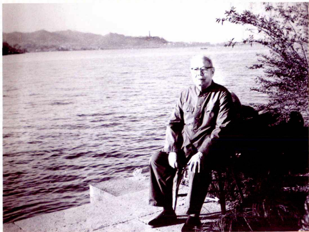
1980年6月，中共中央副主席、五届全国人大常委会委员长叶剑英在杭州。