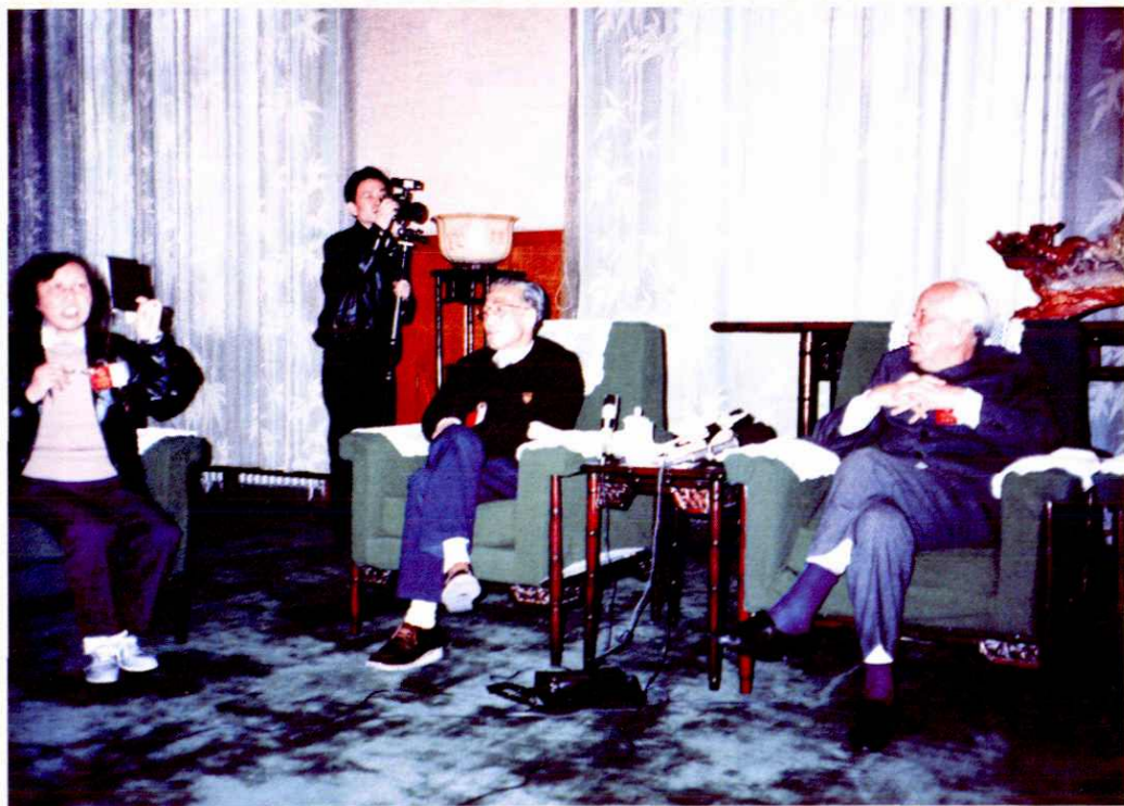
1990年3月26日，七届全国人大常委会委员长万里在七届全国人大三次会议浙江代表团听取代表发言。