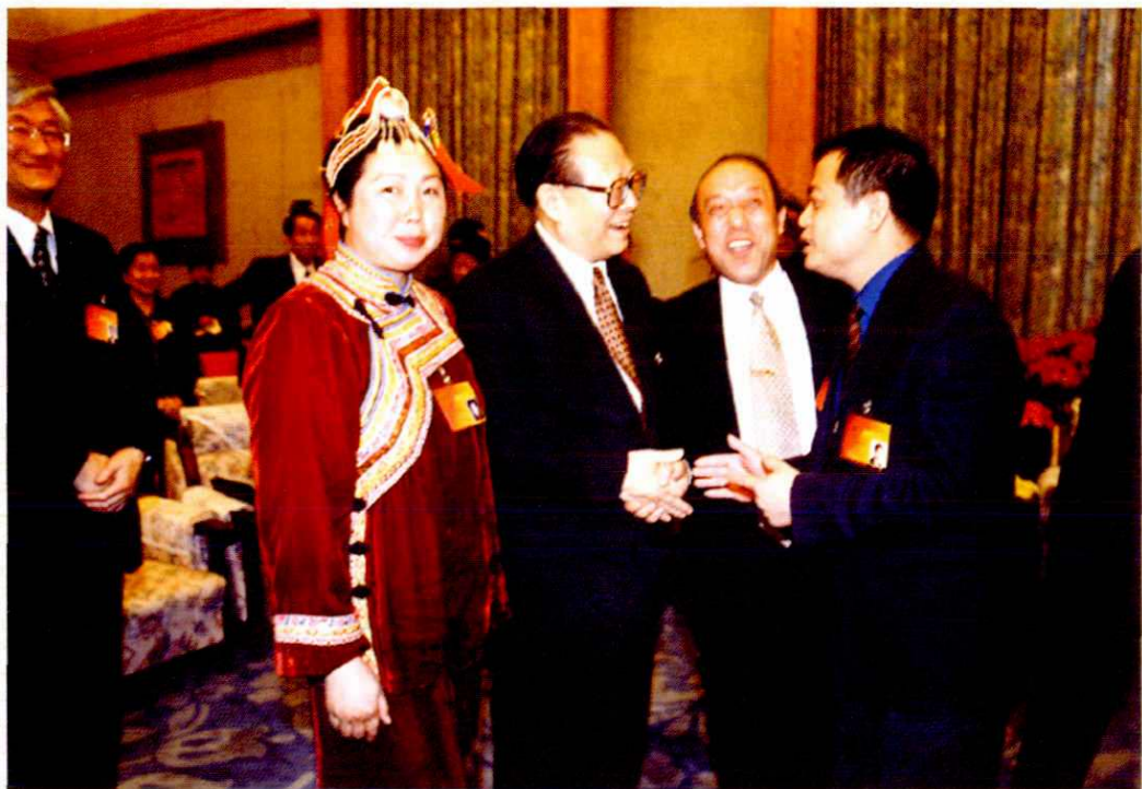
2000年3月14日，江泽民同志在北京人民大会堂浙江厅与出席九届全国人大三次会议的浙江代表在一起。