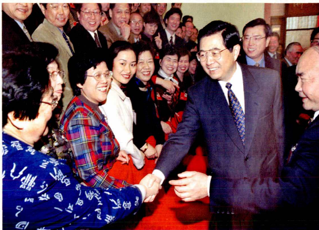
2001年3月8日，胡锦涛同志在北京人民大会堂浙江厅与出席九届全国人大四次会议的浙江代表在一起。