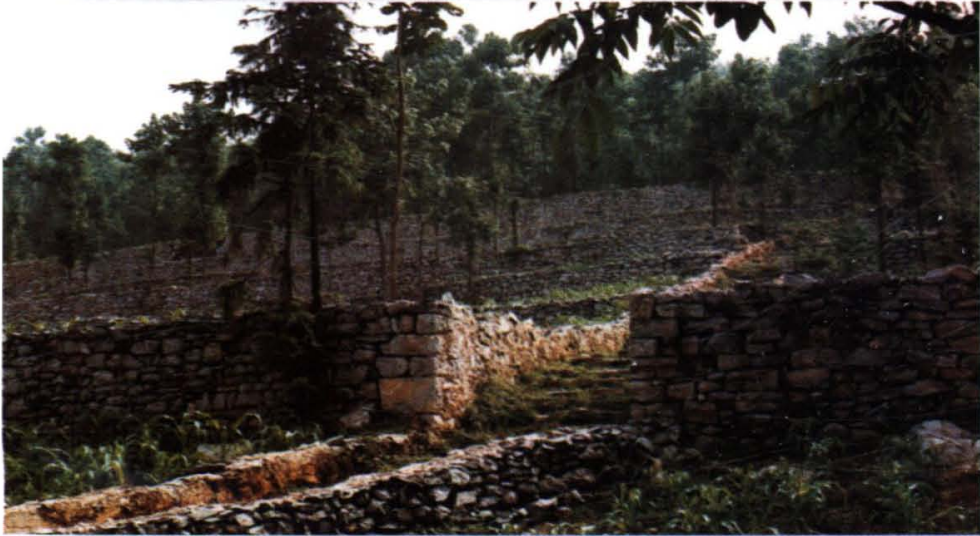
贵州是全国唯一没原支撑的省，全省坡地地的绝大部分。为防止地跑土、跑水、跑肥，年来全省开展大规模的改梯土活动，并取得巨绩。上图为黎平县德“坡改梯”现场。中图为为全省优质工程的盘县淤泥彝族乡双龙村“坡改梯”工程。