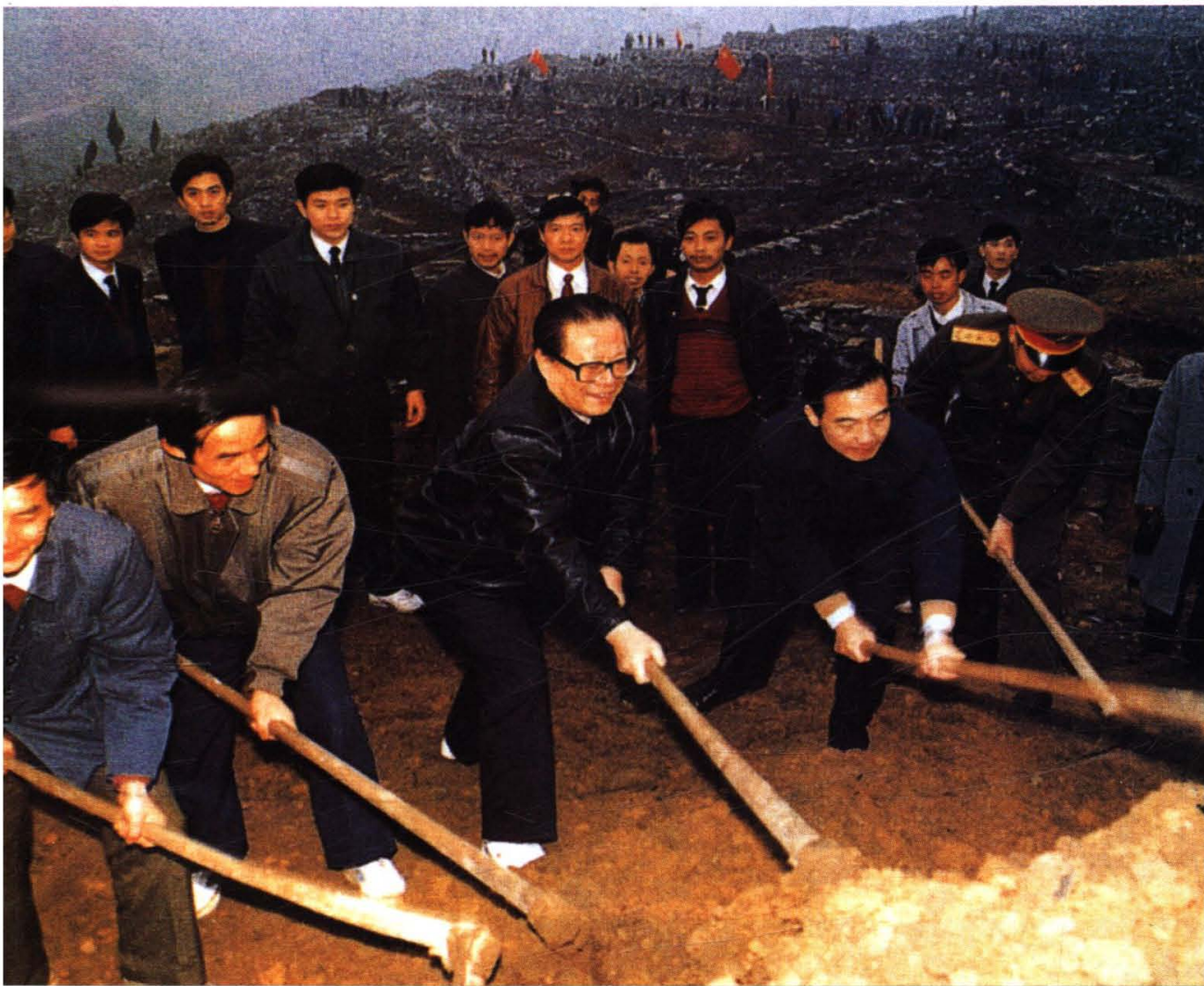
1991年12月，中共中央总书记江泽民在遵义视察农村坡改梯工程，与农民一起挥锄劳动。