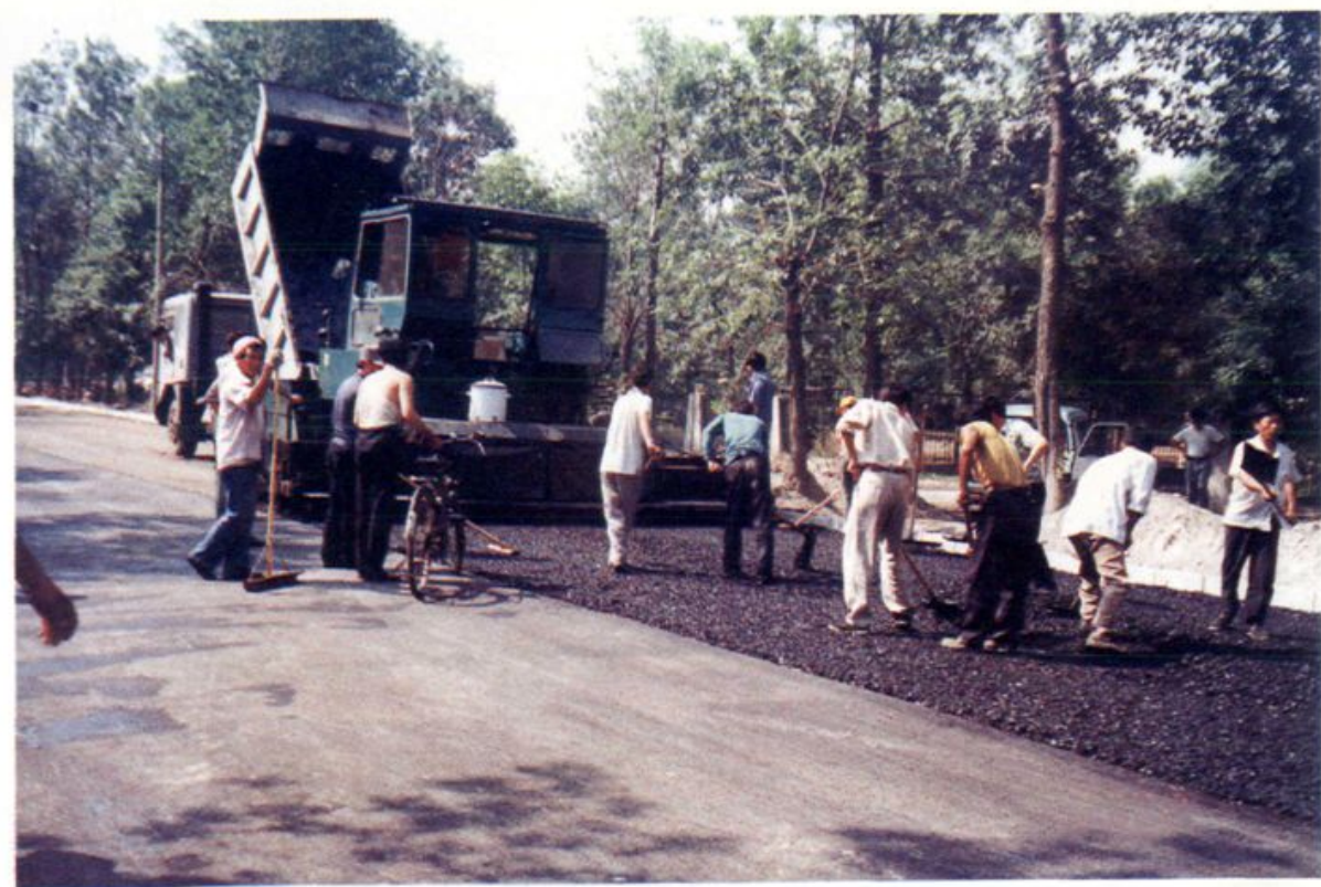
市政工人施工高峰路