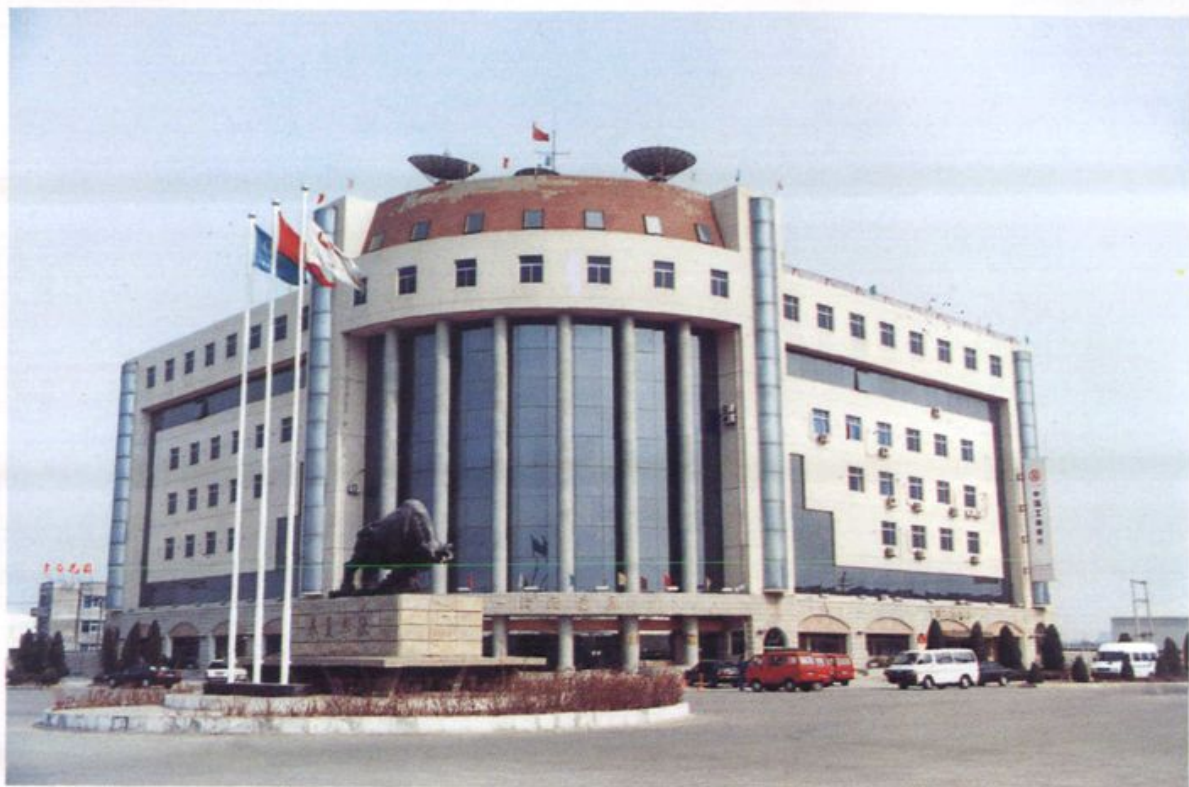
天津北辰经济开发区大厦