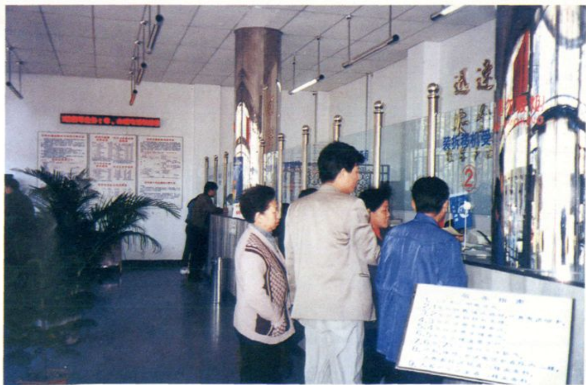
市内电话局北辰区局营业厅内景