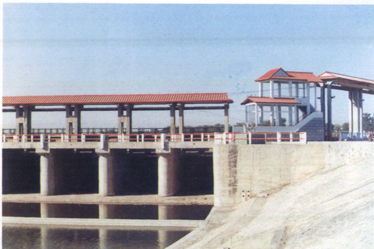
海河水系最大的枢纽工程——屈店闸