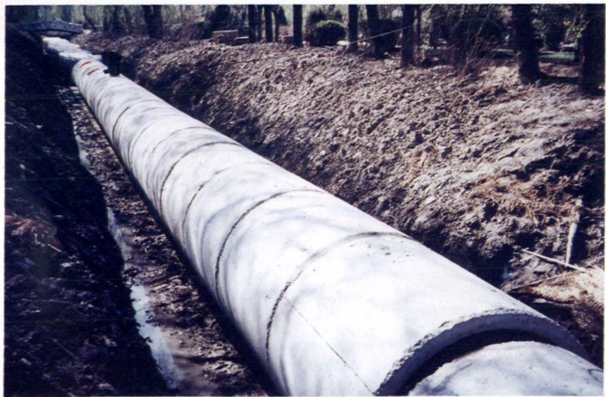
苍峰园排水沟改造