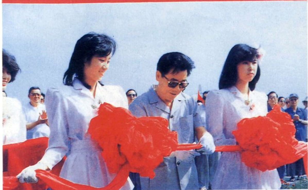
李瑞环为京津公路立交桥落成剪彩