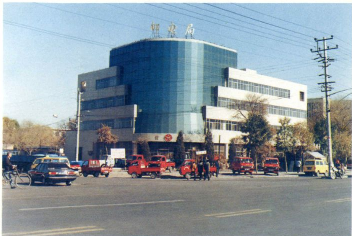
北仓邮电支局外景