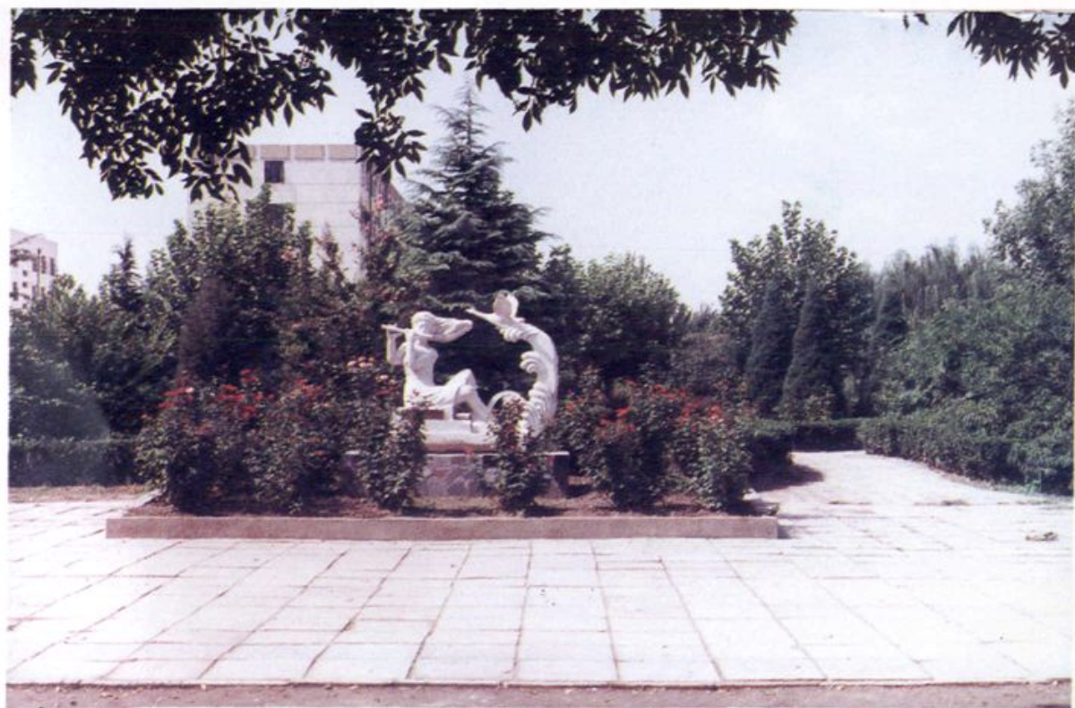
天津商学院雕塑小景