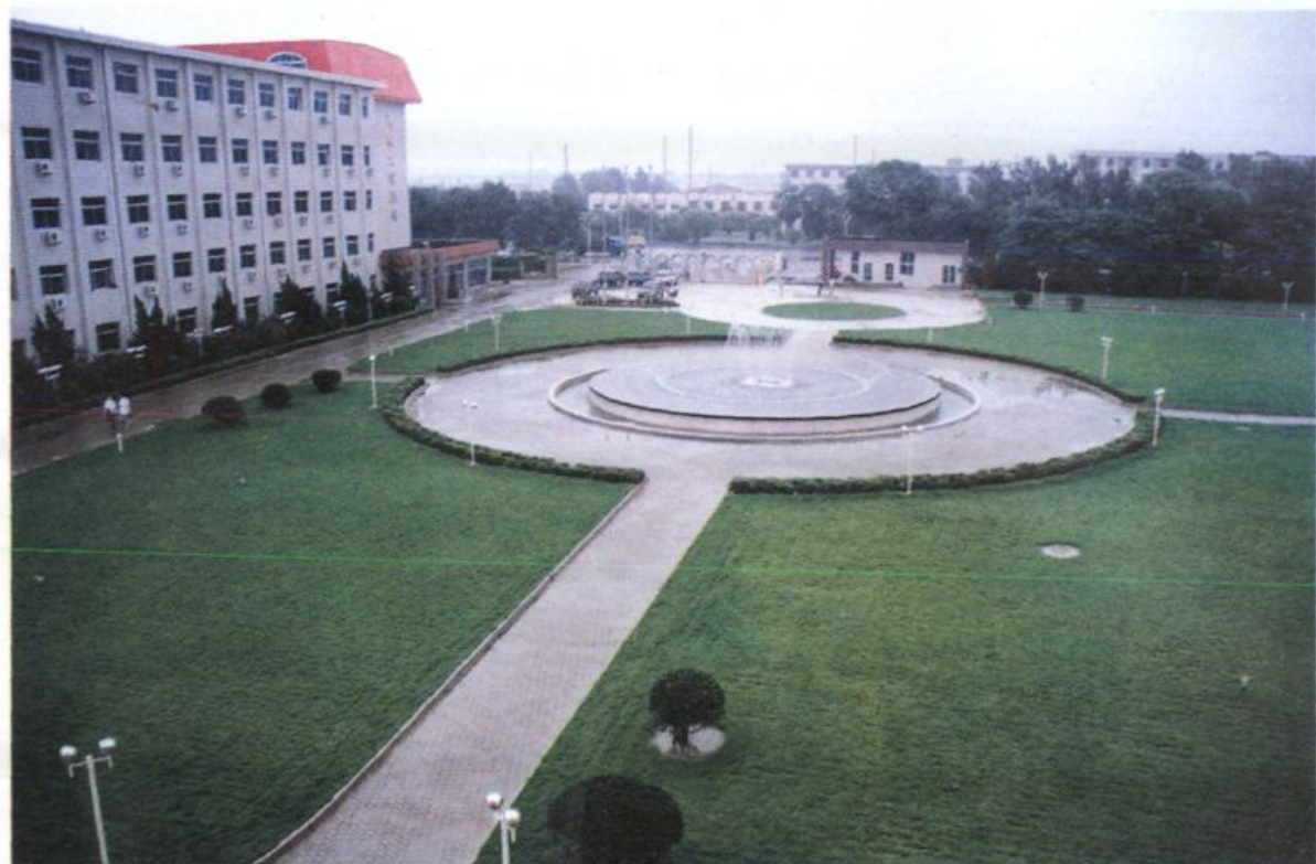
化工设计院庭院绿化