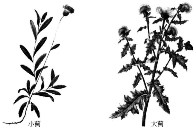
图 1-2 蓟菜外观图

“蓟菜”（ Cephalanoplos sp.），包括“大蓟”（ Cephalanoplos setosum Kita 或 Cirsium japonicum DC.）和“小蓟”（ Cephalanoplos segetum Kitam. 或 Cirsium segetum Kitam.）等植物，现今在北京郊区的一些田间和地头，都还可以看到它们的身影。蓟菜的外观形态参见图 1-2。