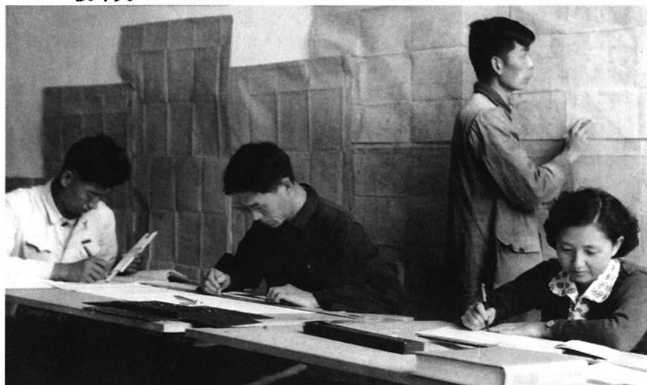
实习出发前的准备(1958)