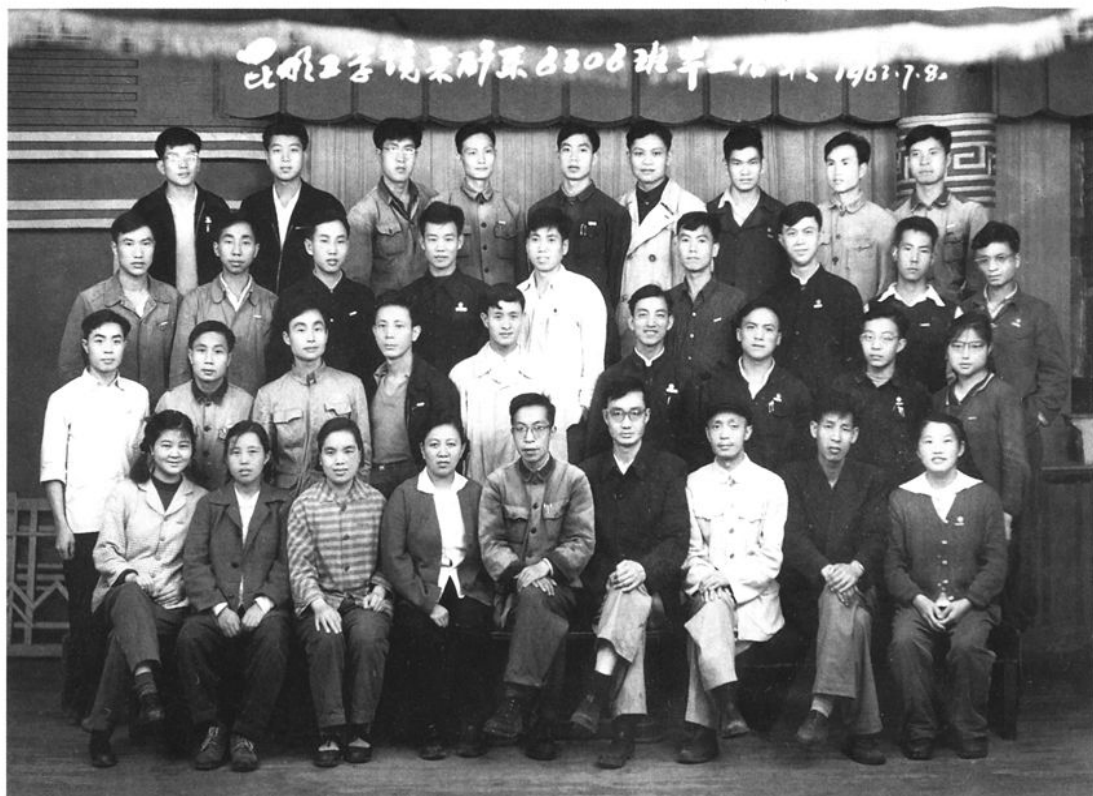
昆明工学院采矿系 6308 班毕业合影(1963. 7)