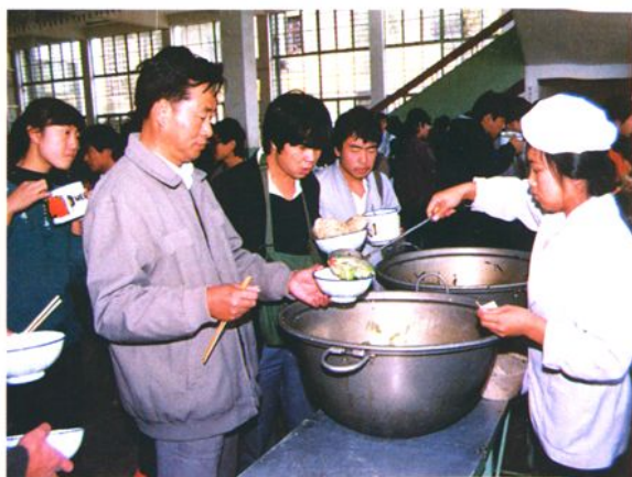
李树基副省长在我校学生食堂（1987）