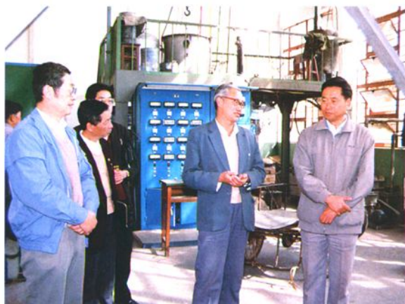
云南省副省长李树基（1953年云大矿冶系采矿专业毕业，右一）参观实验室（1987）