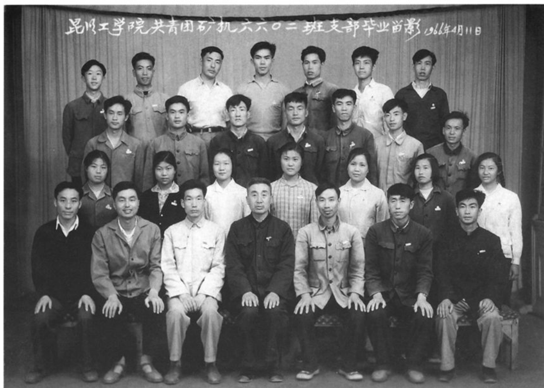
昆明工学院共青团矿机 6602 班支部毕业合影(1966. 4)