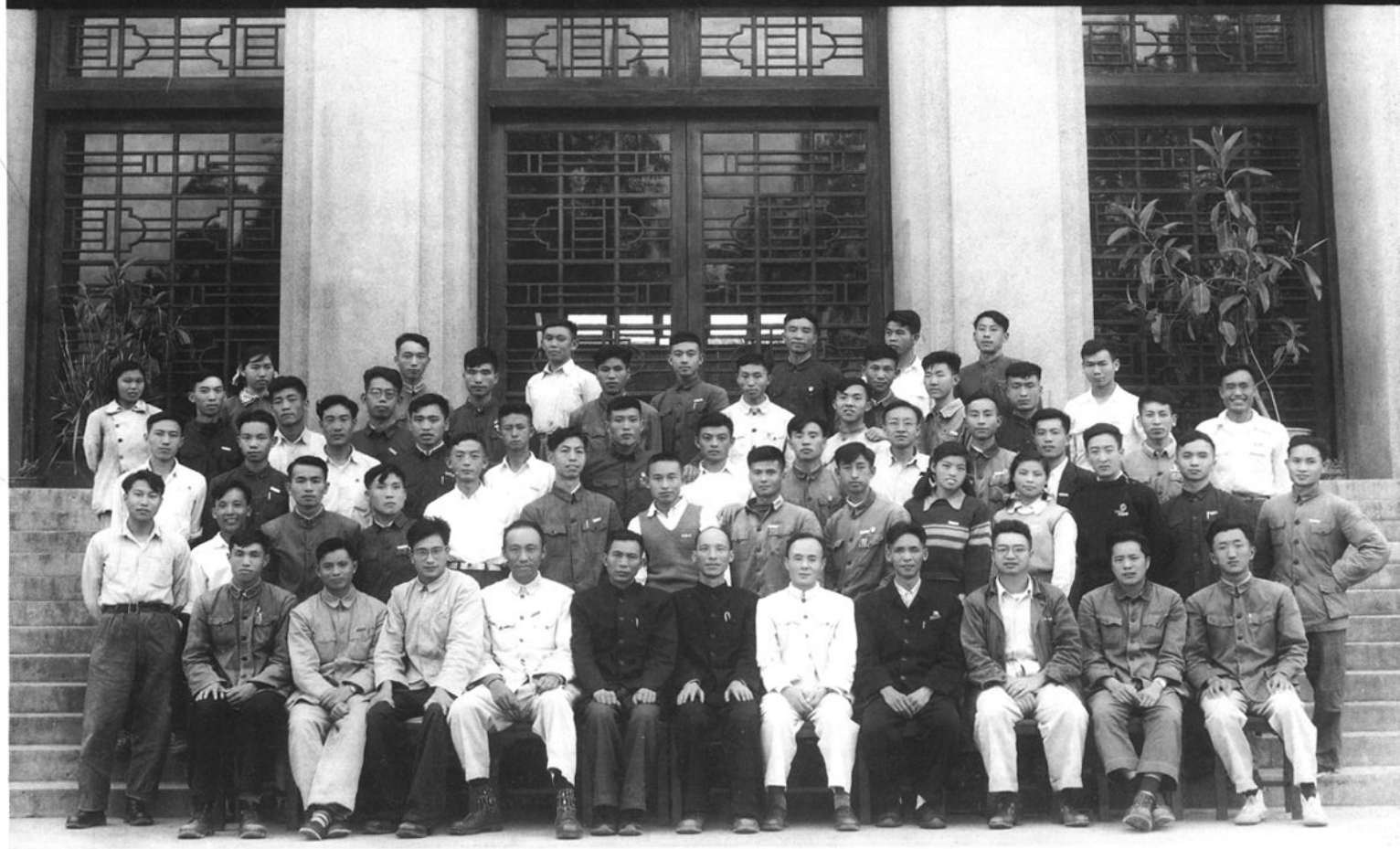
采矿五六届毕业班与答辩委员合影 (1956.7)