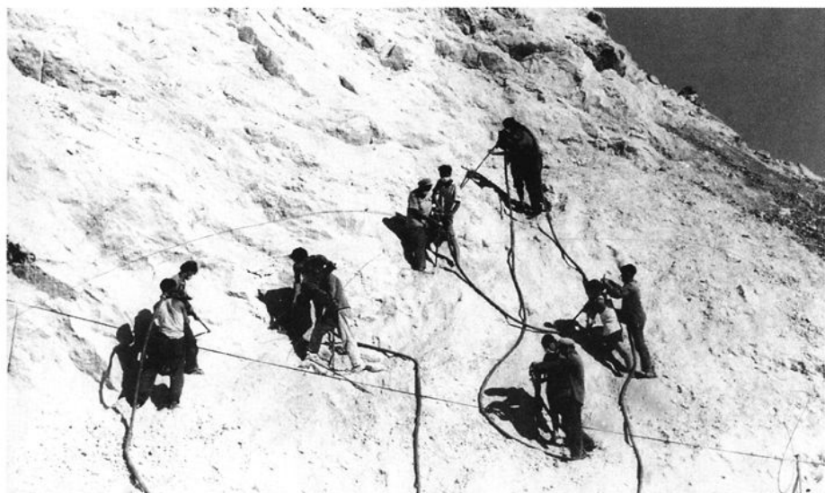
采矿专业学生在野外 钻孔操作实习(1962)