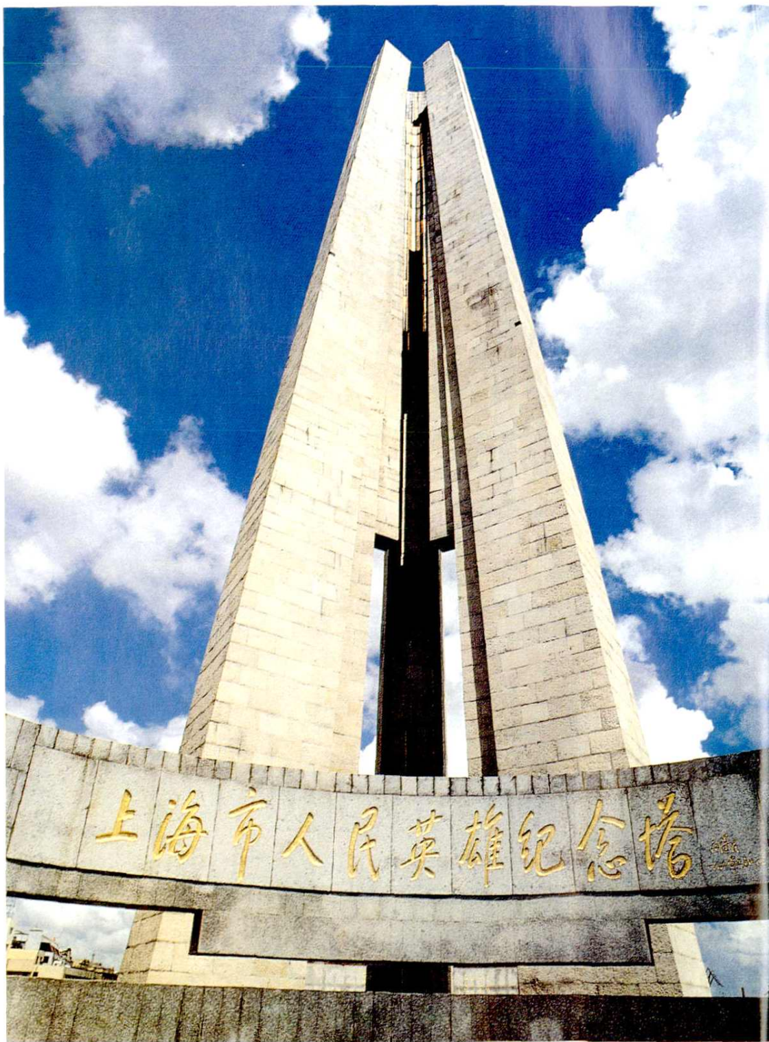
上海市人民英雄纪念碑（江泽民题写塔名）