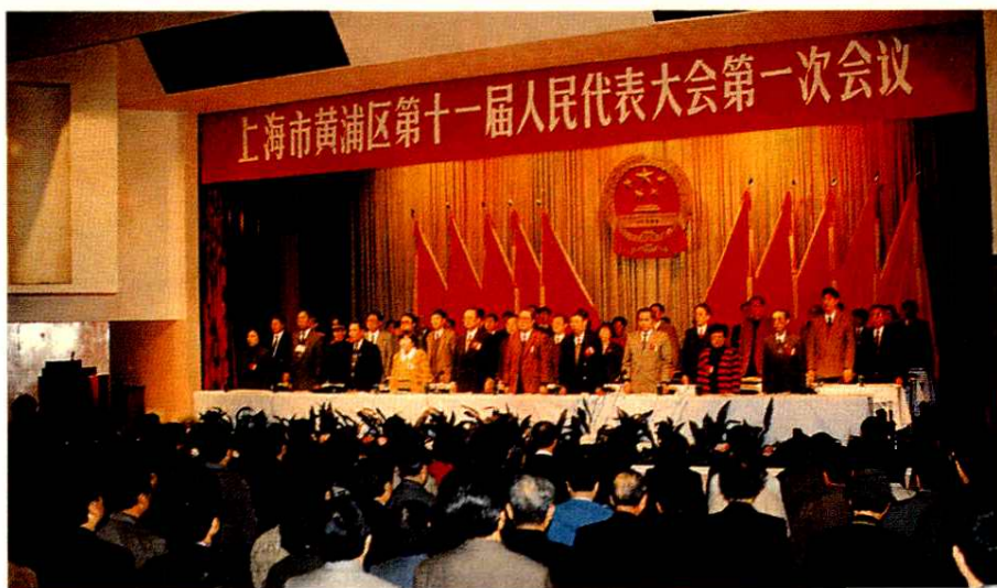
上海市黄浦区第十一届人民代表大会第一次会议(1993年4月13-18日)