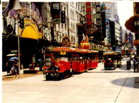
南京路步行街街景