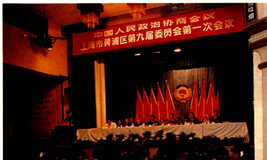
中国人民政治协商会议上海市黄浦区第九届委员会第一次会议(1993年4月11-16日)