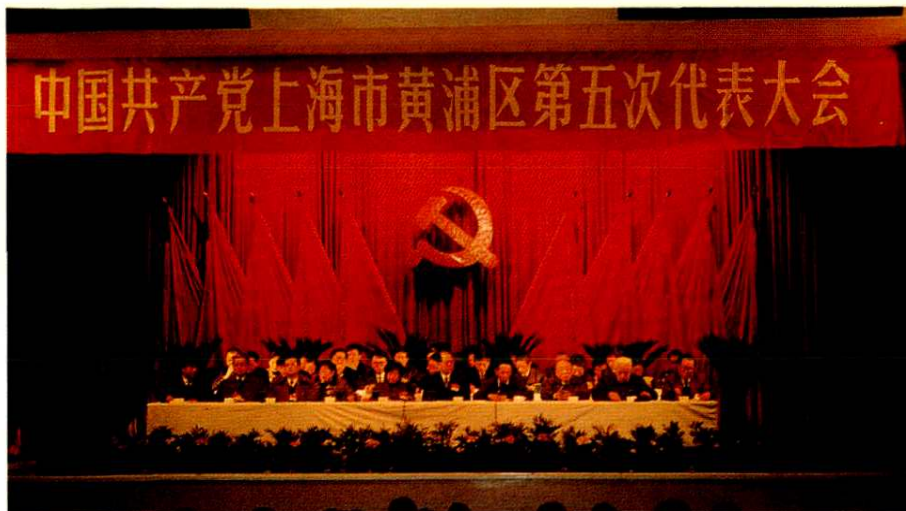
中共上海市黄浦区第五次代表大会(1993年2月9-13日)