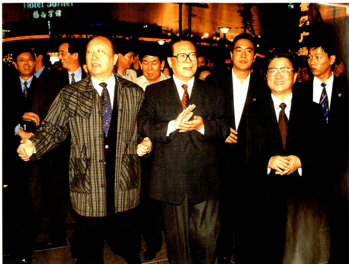
1999年9月24日夜，中共中央总书记江泽民（前排右二）视察南京路步行街