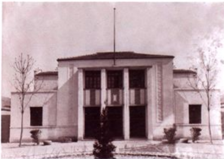
◀位于杭州后市街的杭州商会礼堂(1947年)