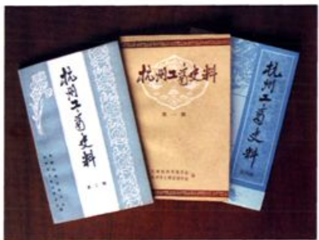
▲由杭州市工商联和民建杭州市委编写的杭州工商史料