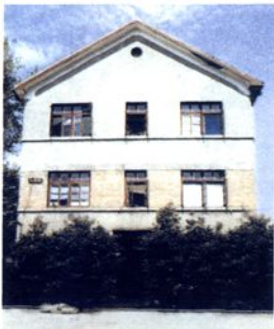
▼1985年杭州市工商联恢复后在中山中路的会址