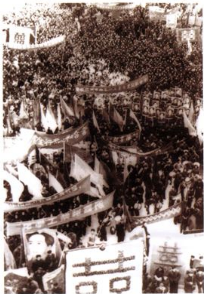
▲1956年1月20日，杭州市工商界游行庆祝胜利完成资本主义工商业的社会主义改造。