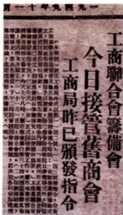
▲1949年11月1日,《当代日报》刊登的杭州市工商联筹备会接管商会的报道。