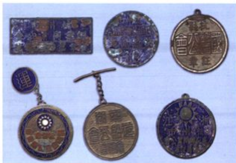
▲ 民国时期杭州部分同业公会的徽章