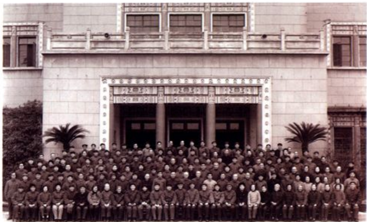
▲1981年3月6日,杭州市工商联第六届会员代表大会代表的合影。