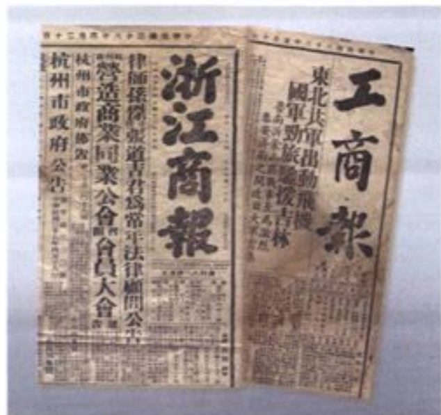
▼ 民国期间杭州商会主办的 《浙江商报》和《工商报》