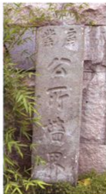
▶ 杭州市扇业公所墙界