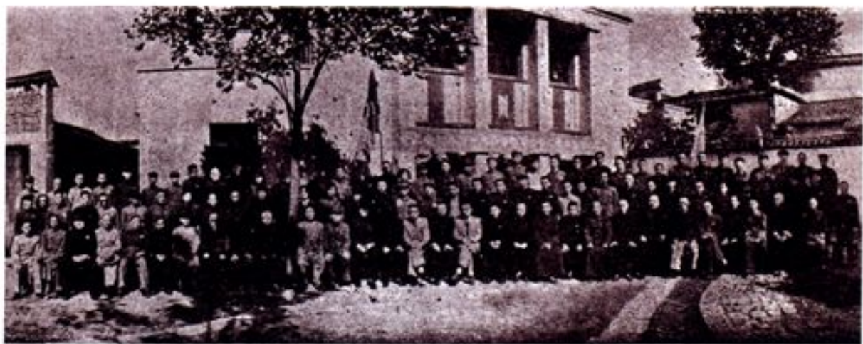
▲1950年11月1日,杭州市工商联第一届会员代表大会筹备委员会及工作人员合影。