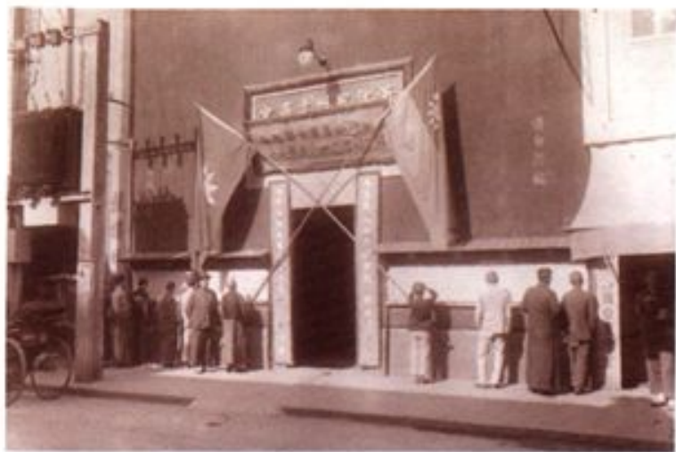
▲杭州市商会会址(1947年)