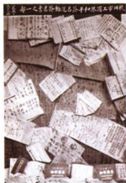
▲1950年9月，杭州市工商界和平签名运动中的部分签名书。