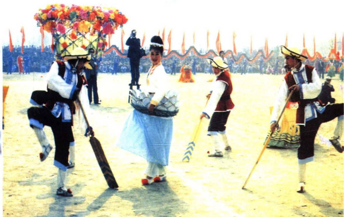
《四船扑莲》