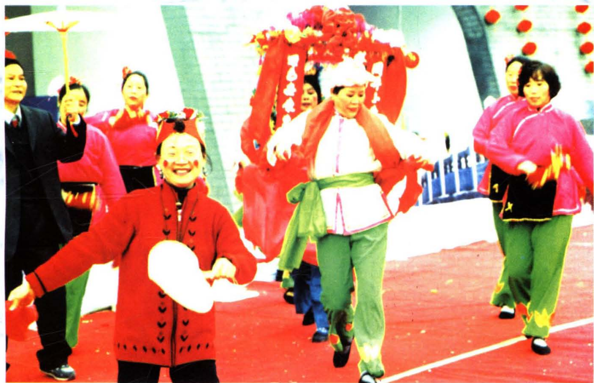
《抬花轿》 安康汉滨区委宣传部供稿