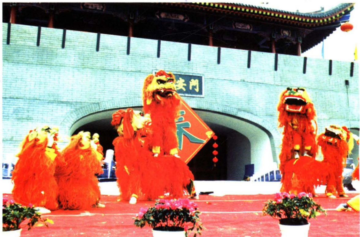
《狮子舞》 安康汉滨区委宣传部供稿