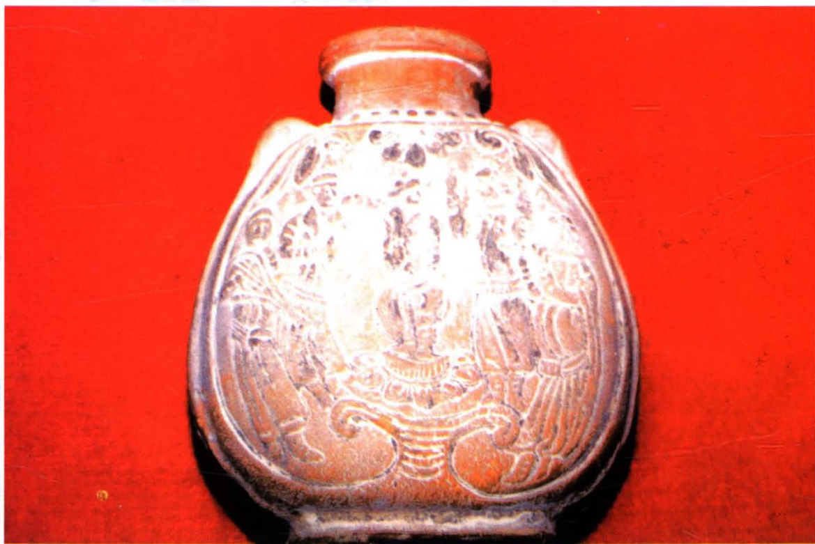
安康南朝齐《胡腾舞》纹红陶扁壶