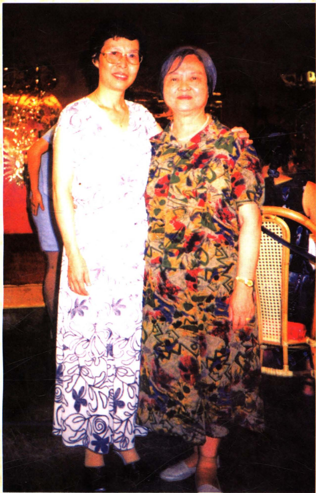
作者与中国著名舞蹈史学家王克芬女士合影