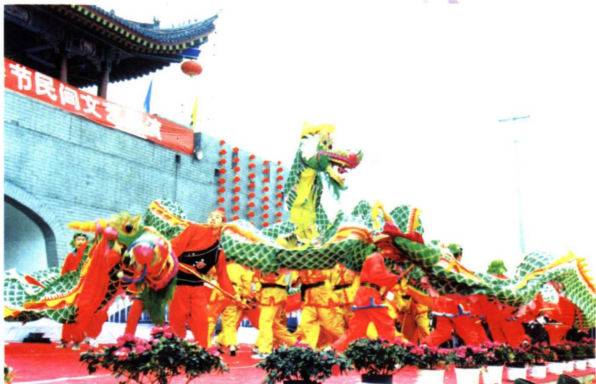
《龙舞》 安康汉滨区委宣传部供稿