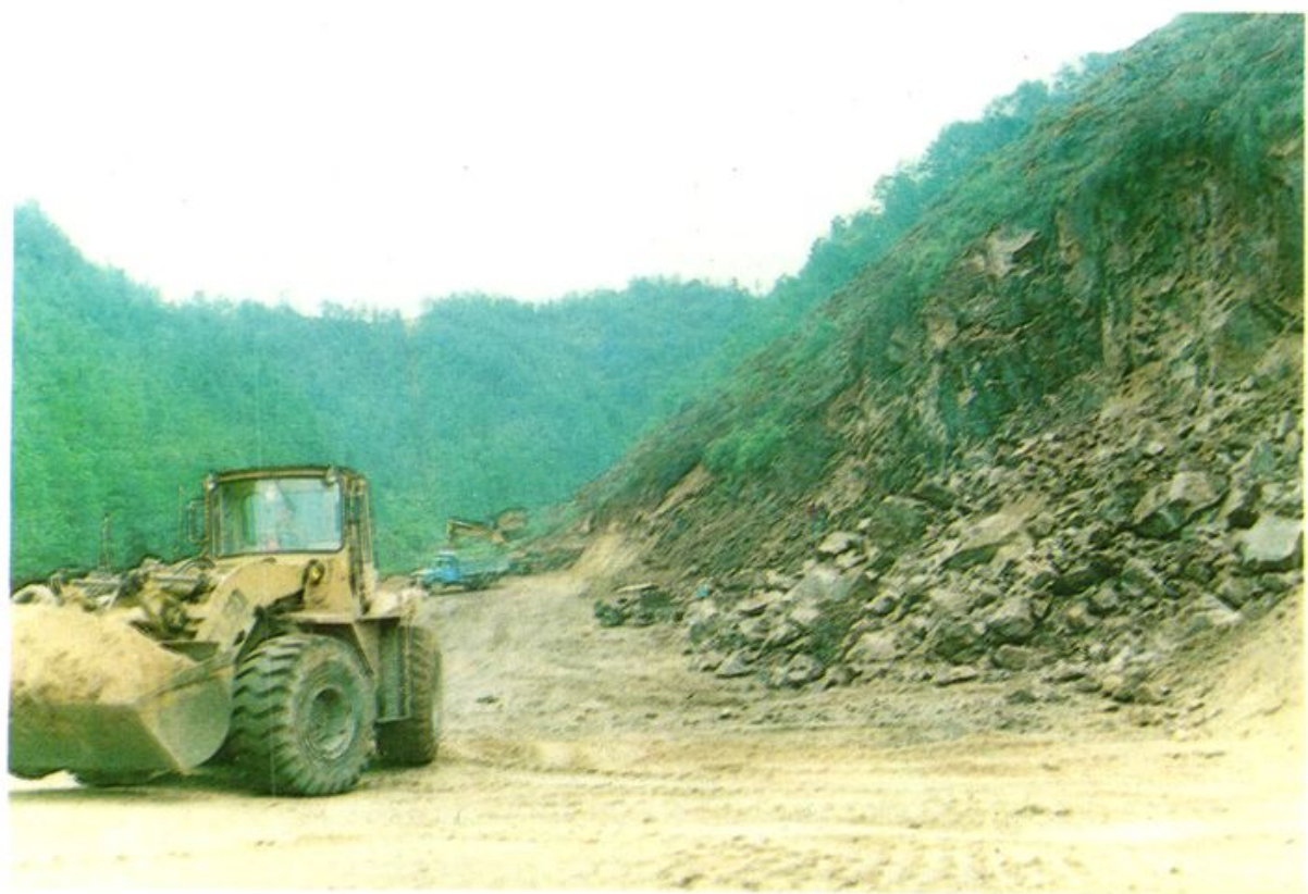
正在施工的 205 国道莲花山路段