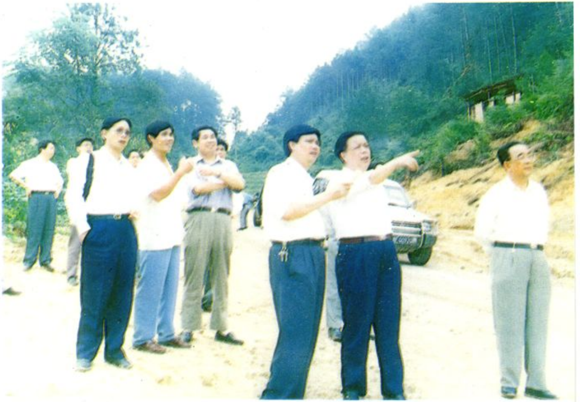
省委副书记林开钦视察连城先行工程建设