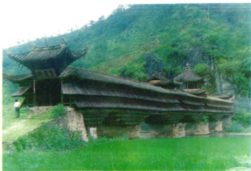
罗坊乡云龙桥(建于明崇禎七年(1635年))