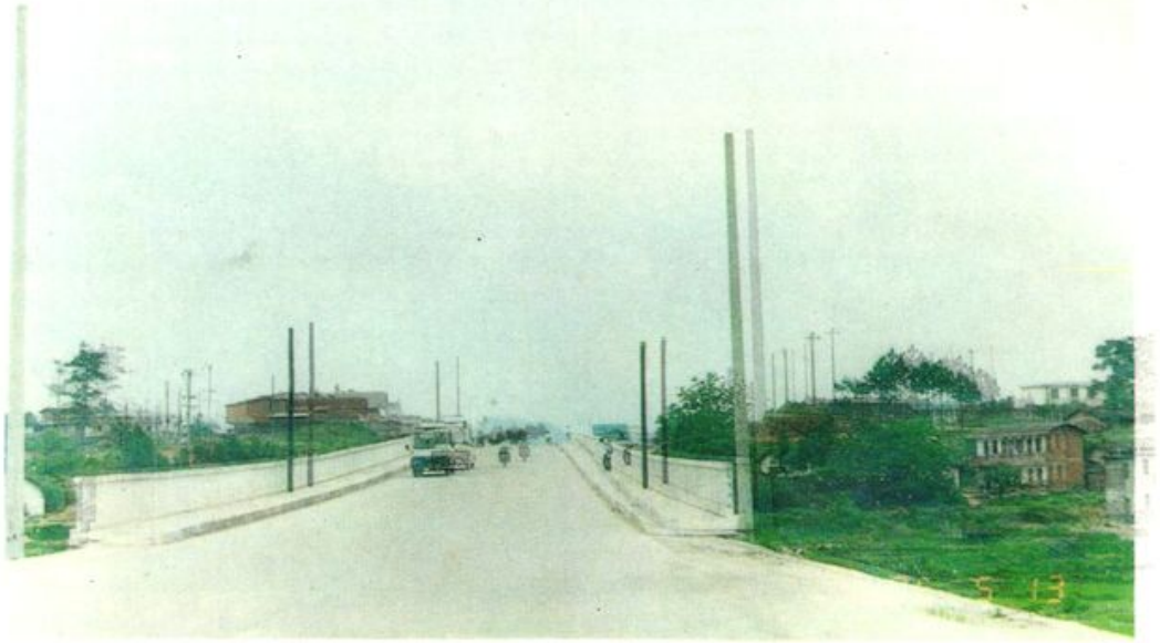
改建后的 205 国道文亨大桥