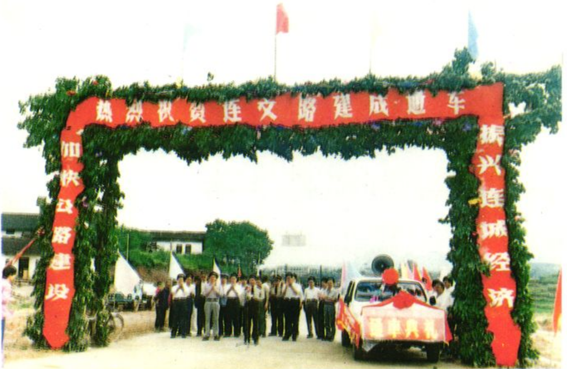
连文路建成通车典礼