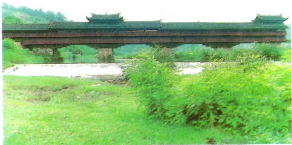
莒溪镇永隆桥(建于明洪武廿年(1387年))