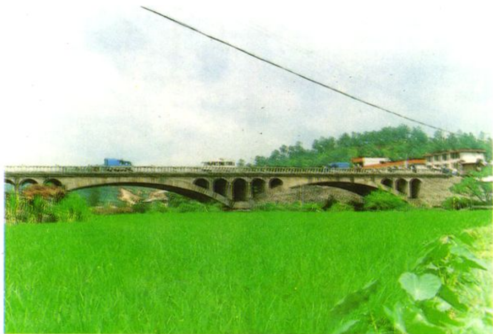
改建前的 319 国道朋口大桥