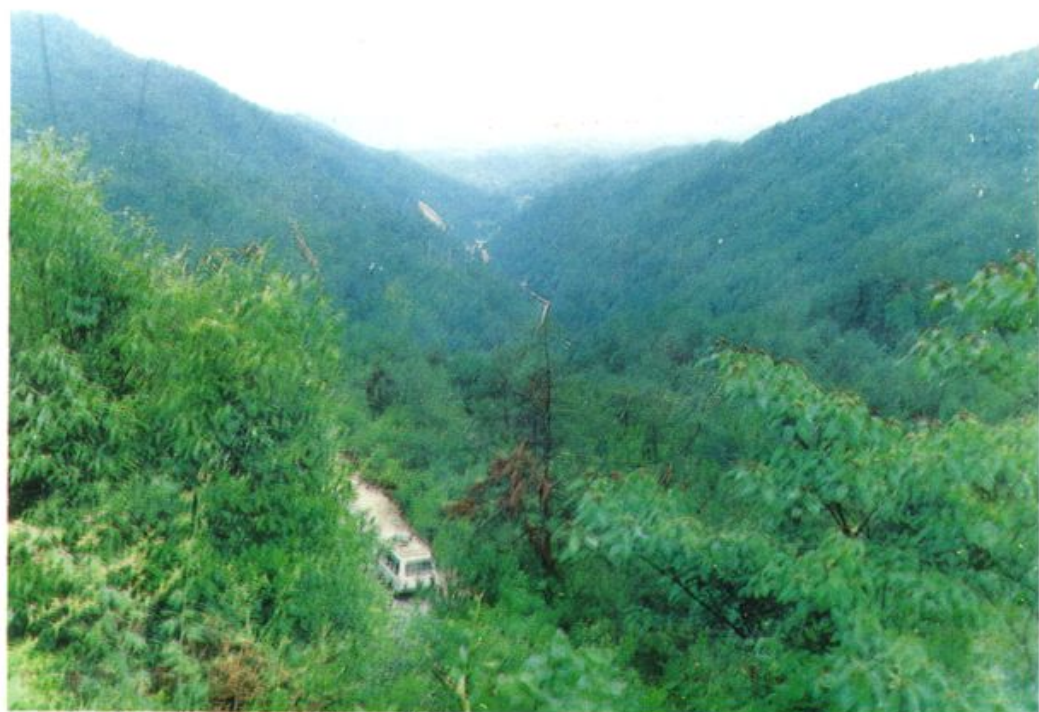
国道 205 线金鸡岭盘山公路