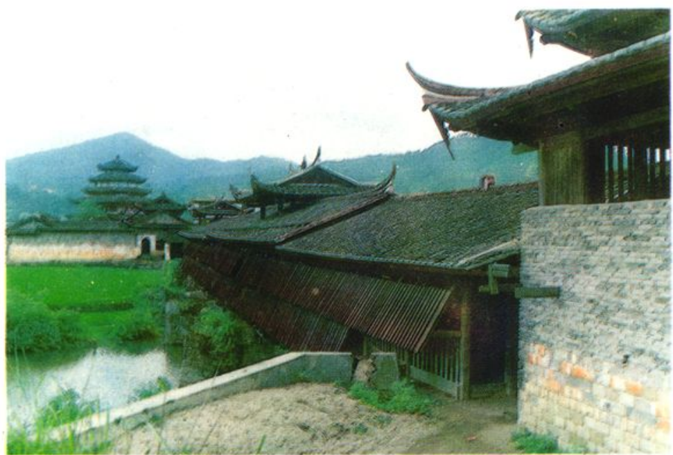
茗溪镇永隆桥与文昌阁