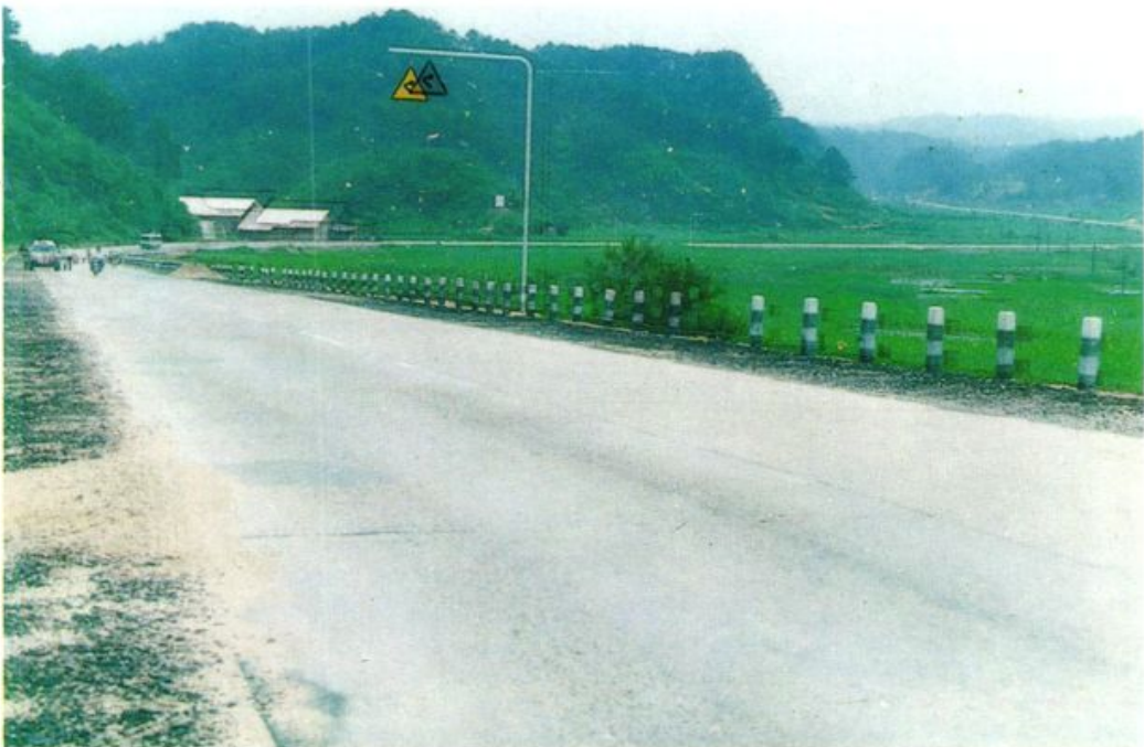
改建后的 205 国道朋口路段