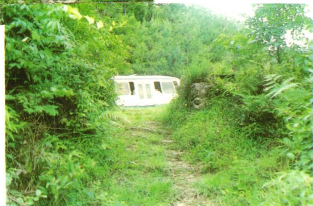
连城通往永安的 金鸡岭古道