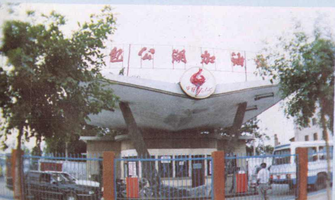
开封石油分公司包公湖加油站