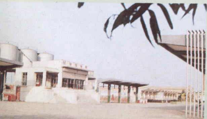
下 灌装付油区 中 开封油库全景 上 河南省石油总公司开封分公司办公楼