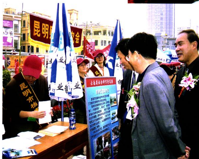
市委领导亲临《档案法》宣传现场