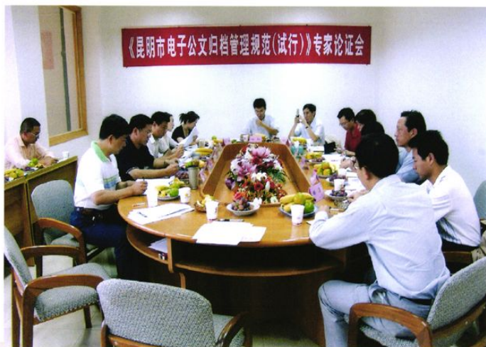
《昆明市电子公文归档管理规范(试行)》通过专家论证