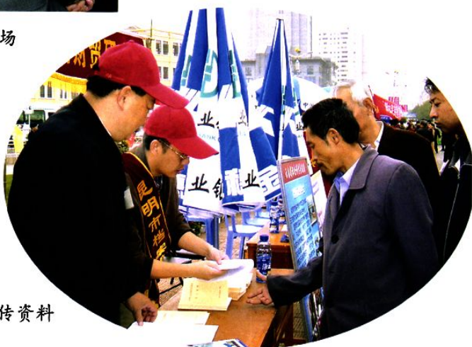
向市民散发 《档案法》宣传资料