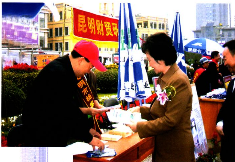
省社科联领导接受《档案法》等宣传资料