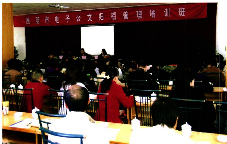
举办《电子公文归档管理》培训班