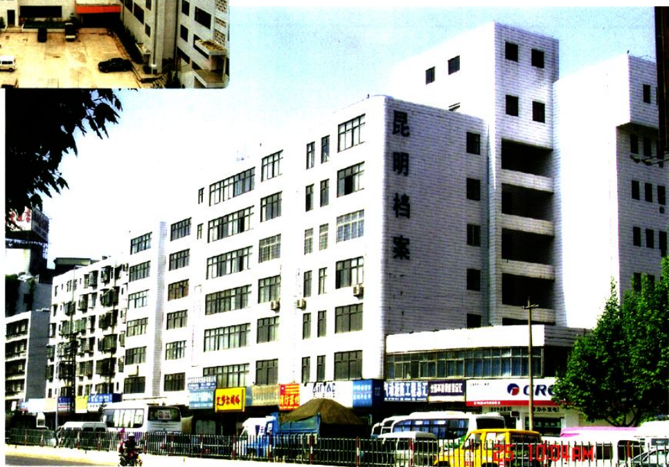
1995年选址建于东二环路金马立交桥旁占地7.2亩的昆明市档案局馆