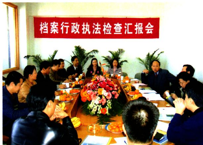
国家档案局档案行政执法检查组到昆明市档案局馆进行档案行政执法检查