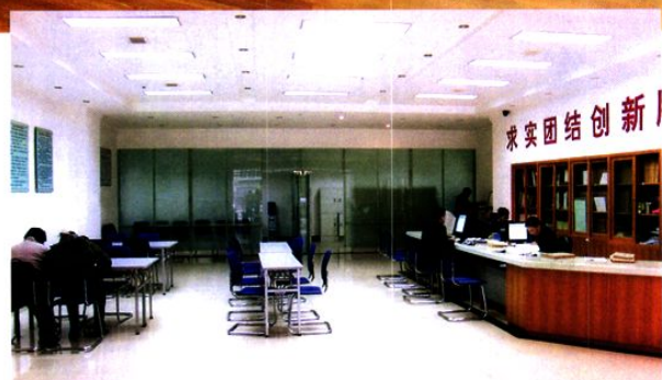
档案查阅利用大厅