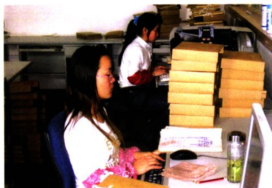
档案数字化加工中心