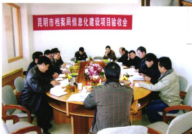
昆明市档案局信息化建设项目验收会