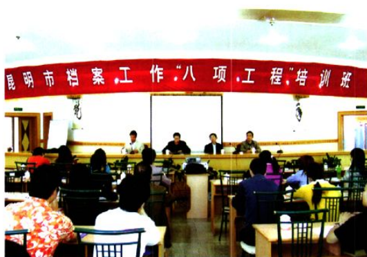
举办档案工作“八项工程”培训班