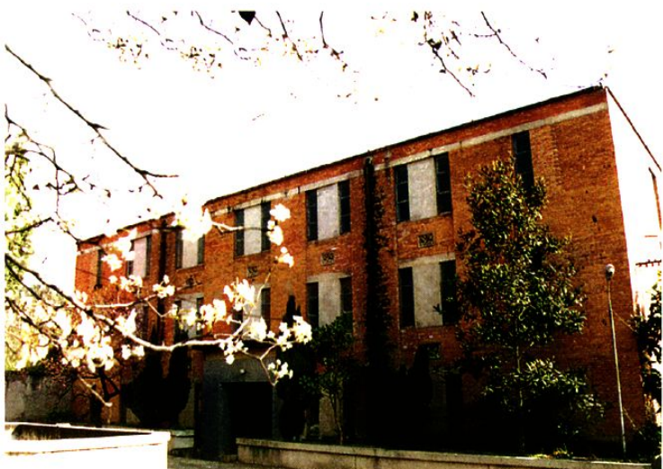
建于1964年的金殿档案馆库房