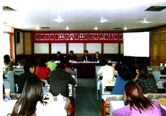
举办档案工作“八项工程”验收评审员培训班