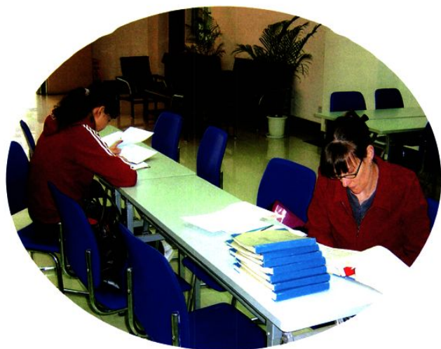
查阅档案著书立说