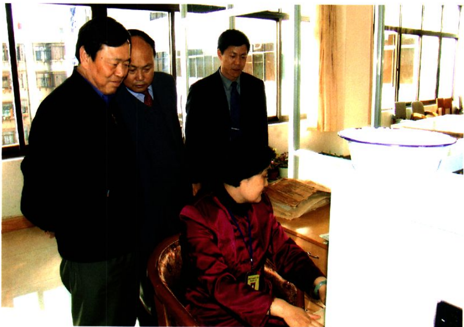
2002年，国家档案局杨公之副局长、省档案局扬汝鉴局长到昆明市档案局馆视察工作