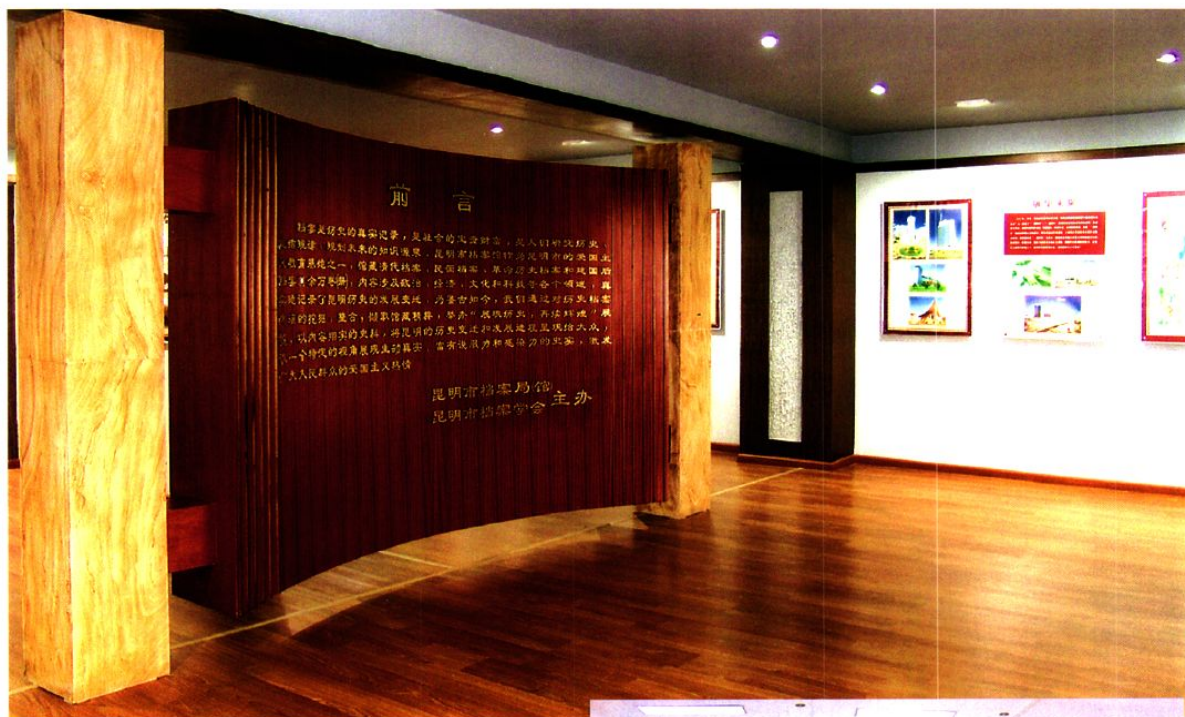
爱国主义教育基地展厅