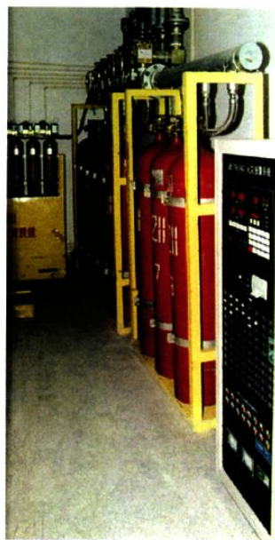
1211气体灭火装置和火灾报警系统