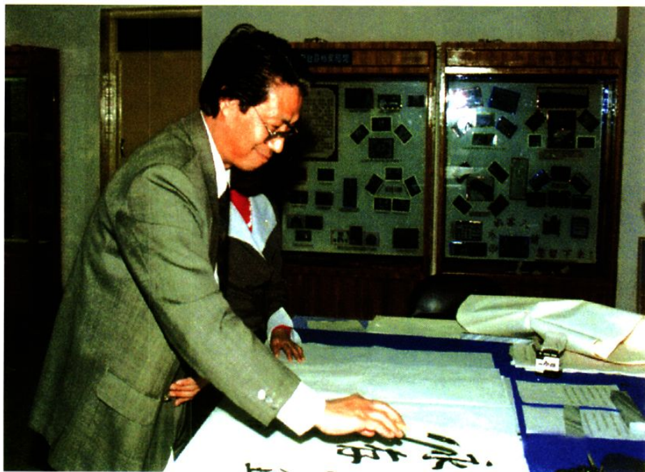
2002年，国家档案局副局长刘国能到市档案局馆“爱国主义教育基地”参观时题词