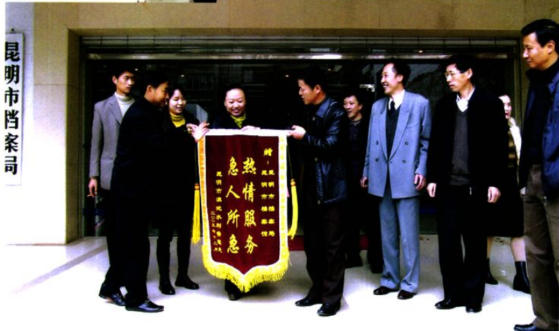
档案利用成果显著