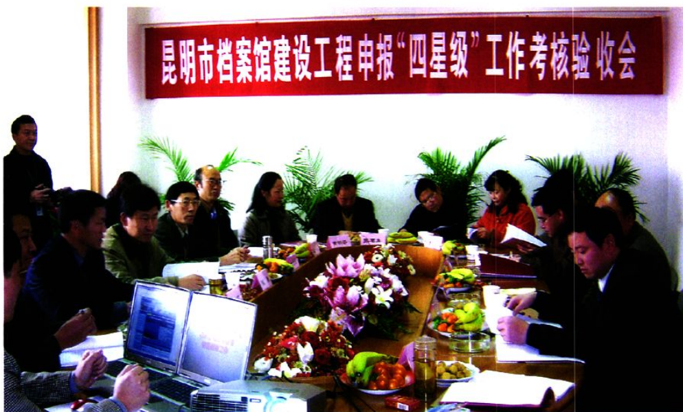
2005年12月，昆明市档案馆建设通过“四星级”评审