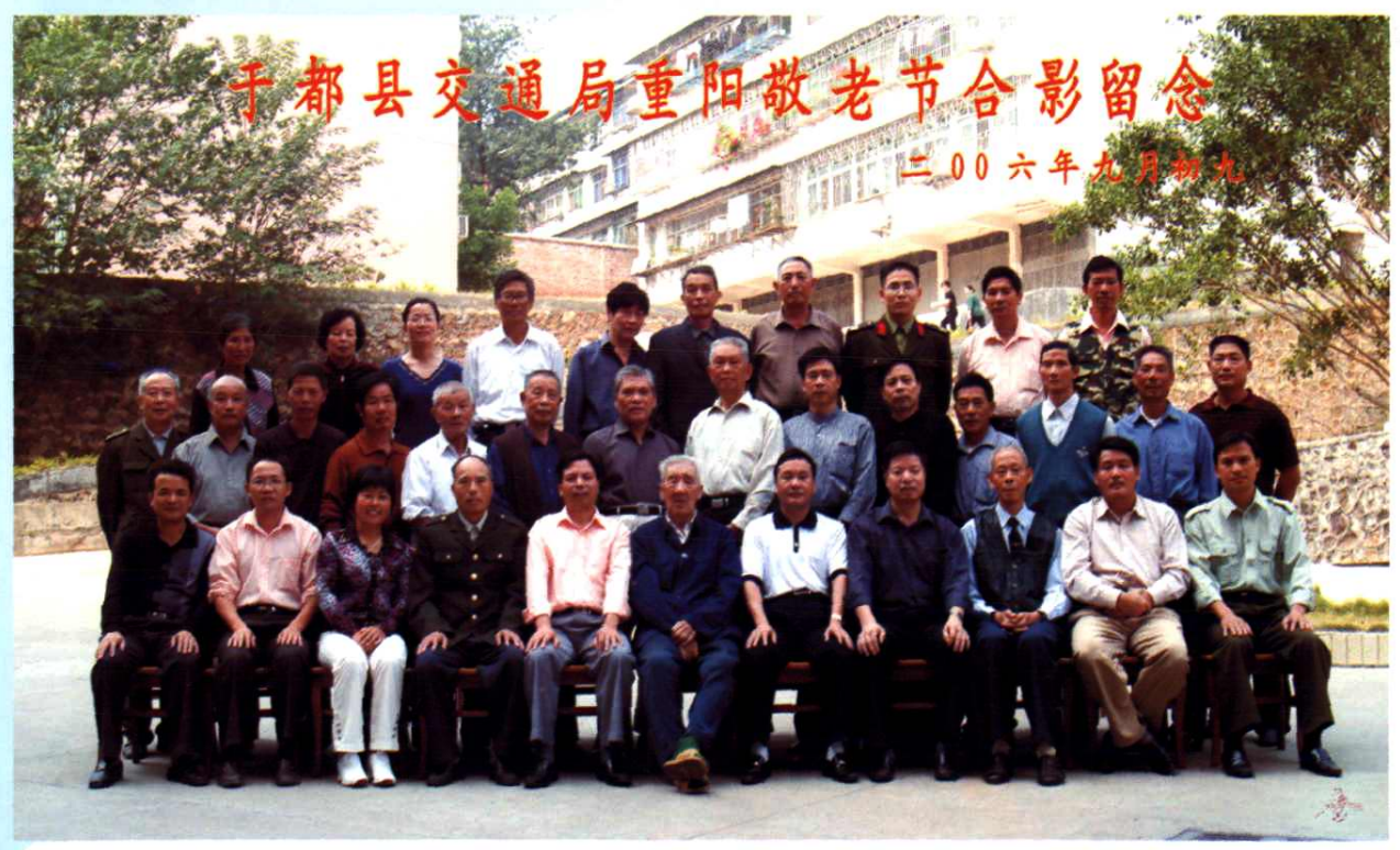
2006年重阳敬老节合影留念