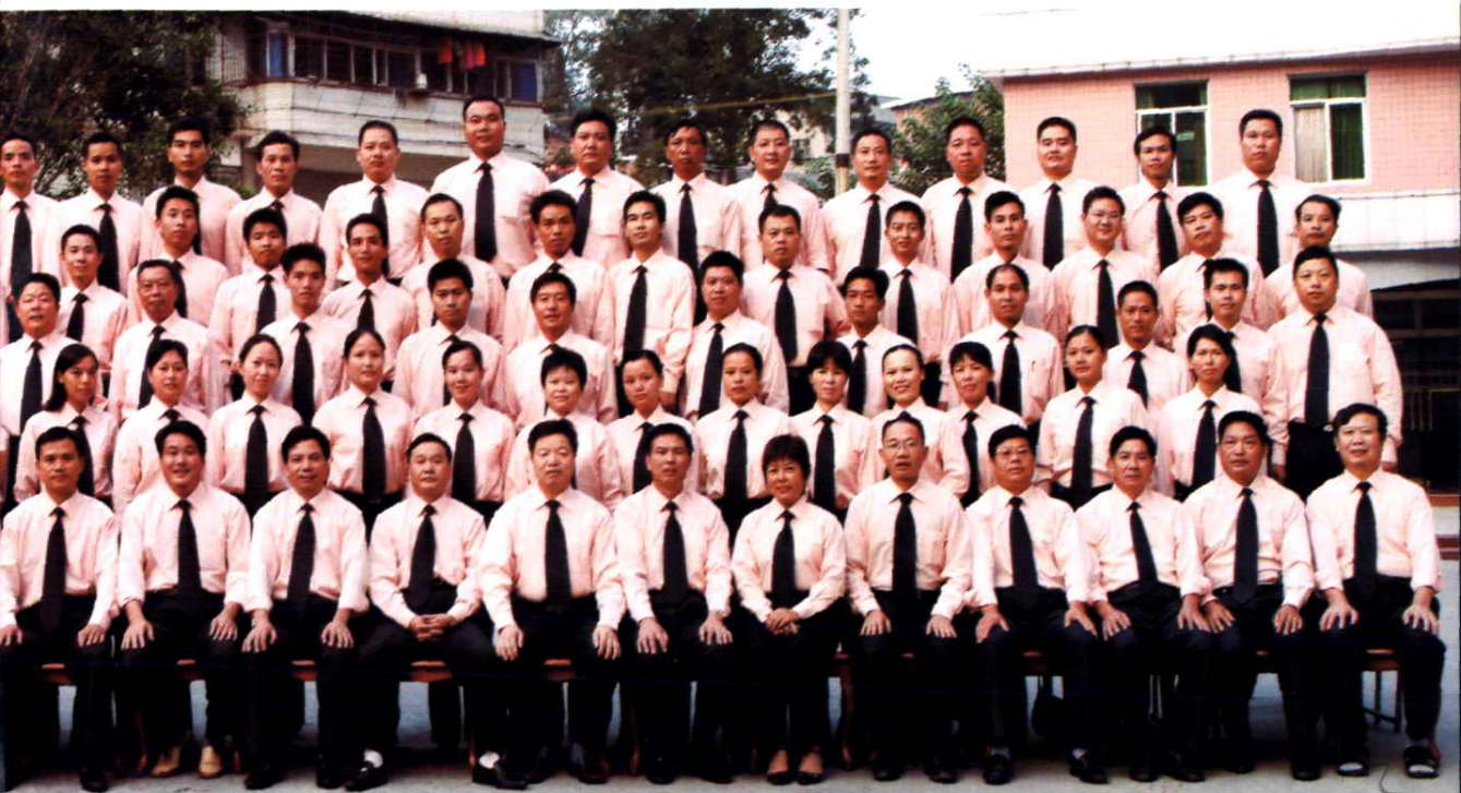
交通局全体干部职工合影