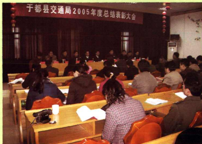
交通局总结表彰会会场