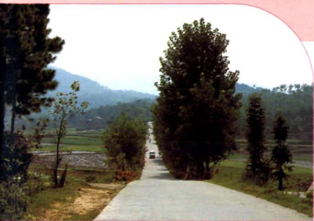
于都第一条通乡水泥路——马安公路