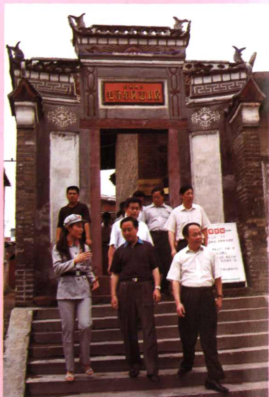
交通部副部长黄先耀在于都