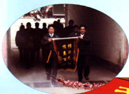
村民自发送来锦旗