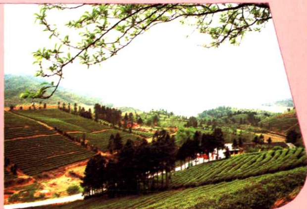
盘古茶场茶园水泥路