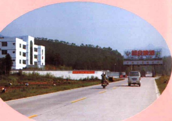
于银公路仙下收费站