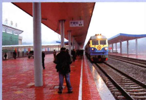
首列火车进入于都站