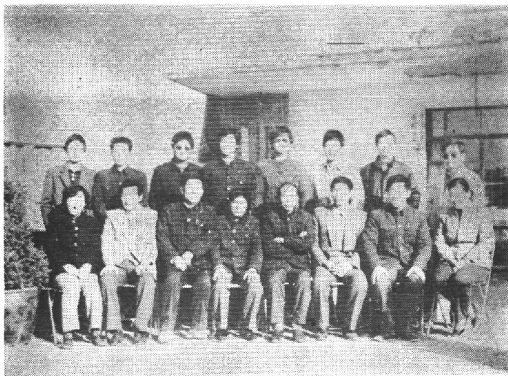
中国人民保险公司定远县支公司