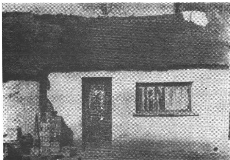
淮南银行池河支行