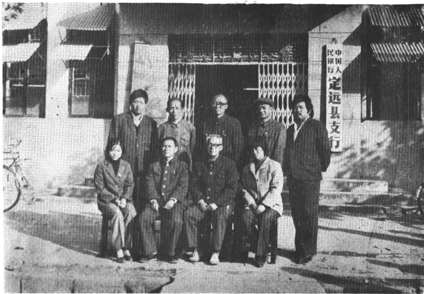
中国人民银行定远县支行