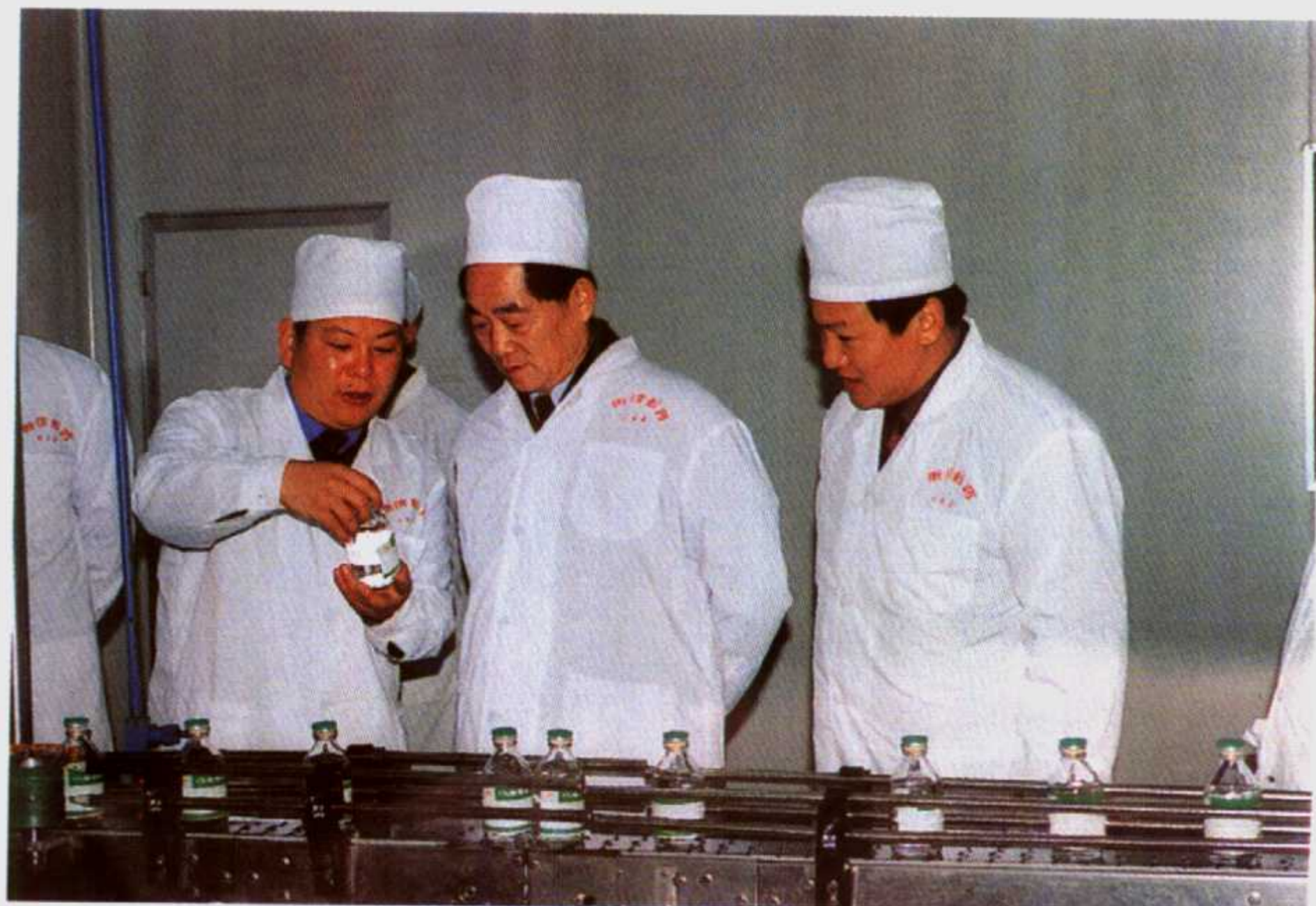
2002年11月16日,河南省副省长张以祥(中)在南阳普康集团衡涪制药有限责任公司董事长兼总经理余国全(左)、副总经理李健(右)的陪同下视察衡涪制药公司大输液车间。