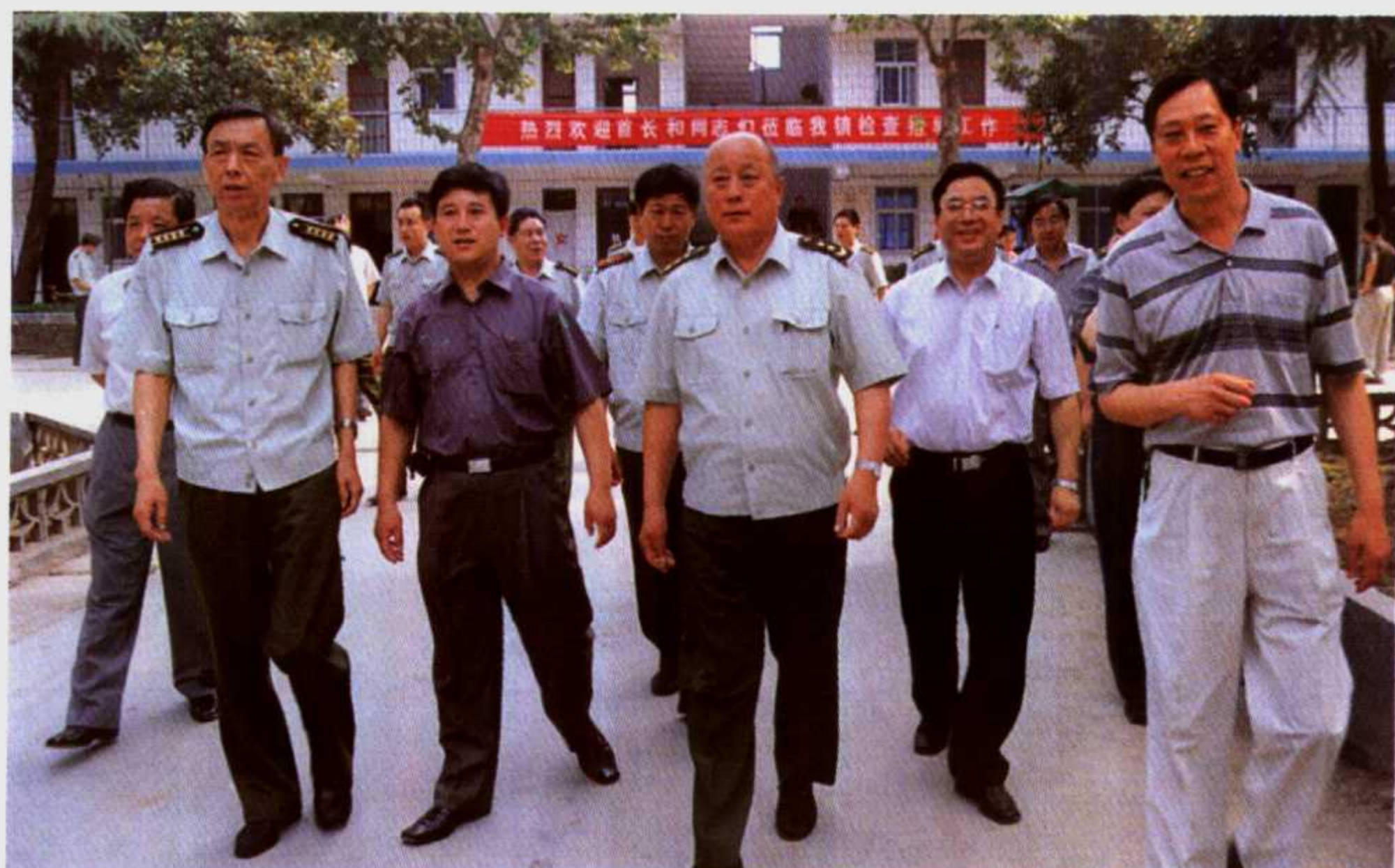
2002年6月6日至7日，中共中央委员、济南军区副司令员李良辉中将(中)在南阳军分区政委赵林生(左一)、宛城区委书记方瑜垠(右一)陪同下考察指导民兵预备役工作。