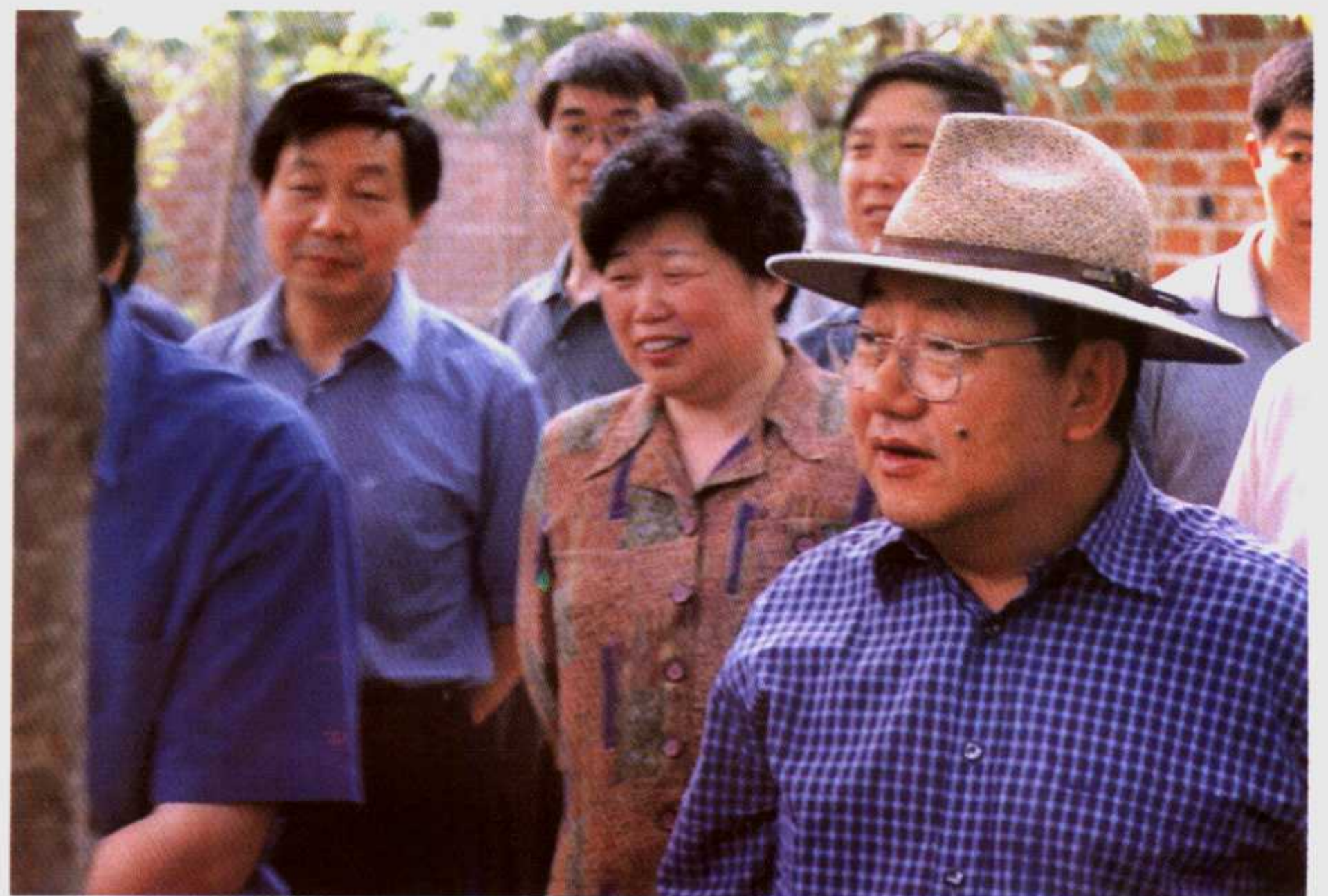
2002年6月20日，省委书记陈奎元(右一)在新野县委书记赵焕之(右二)、县长方显中(右三)的陪同下视察新野县沙堰镇猕猴繁殖训养基地。