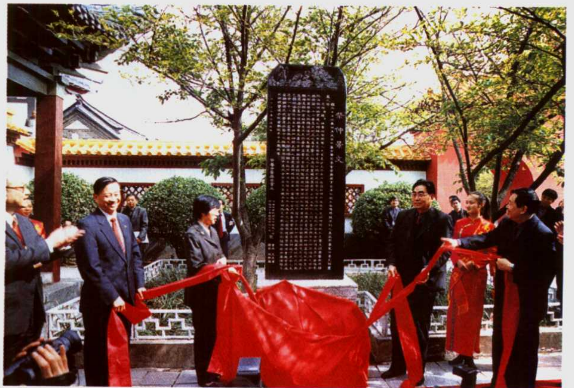
2002年4月9日，国家卫生部副部长、国家中医药管理局局长余靖，南阳市市长何东成，河南省卫生厅厅长刘全喜，香港浸会大学校长吴清辉共同为《祭仲景文》揭幕。