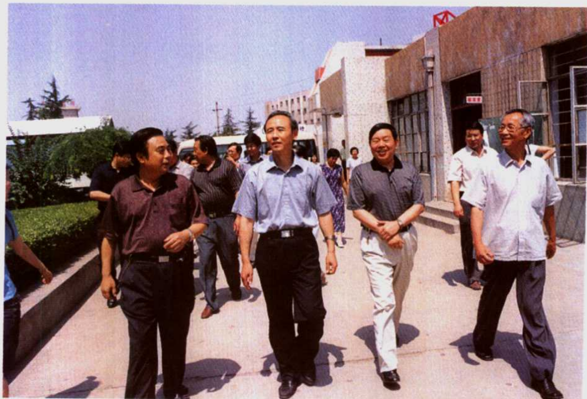
6月14日,副省长贾连朝(左二)在南阳市市长何东成(左三)、南阳理工学院党委书记安身健(左一)、院长薛谦让(右一)陪同下到南阳理工学院视察工作。