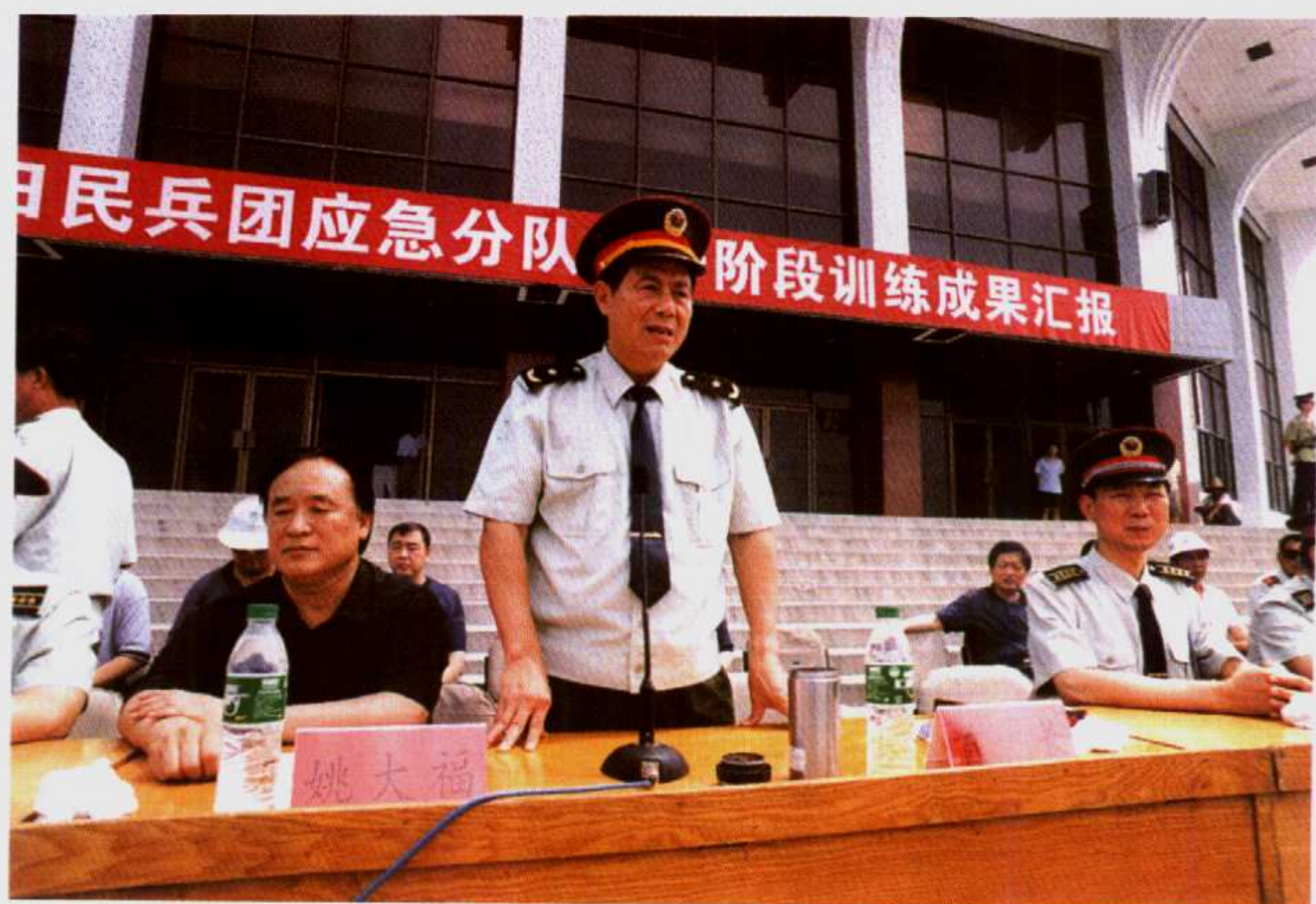
2002年6月30日河南省军区司令员杨迪铄少将(站立者)来油田检查指导民兵工作。左一为河南油田党委书记姚大福,右一为南阳军区司令员徐俭大校。