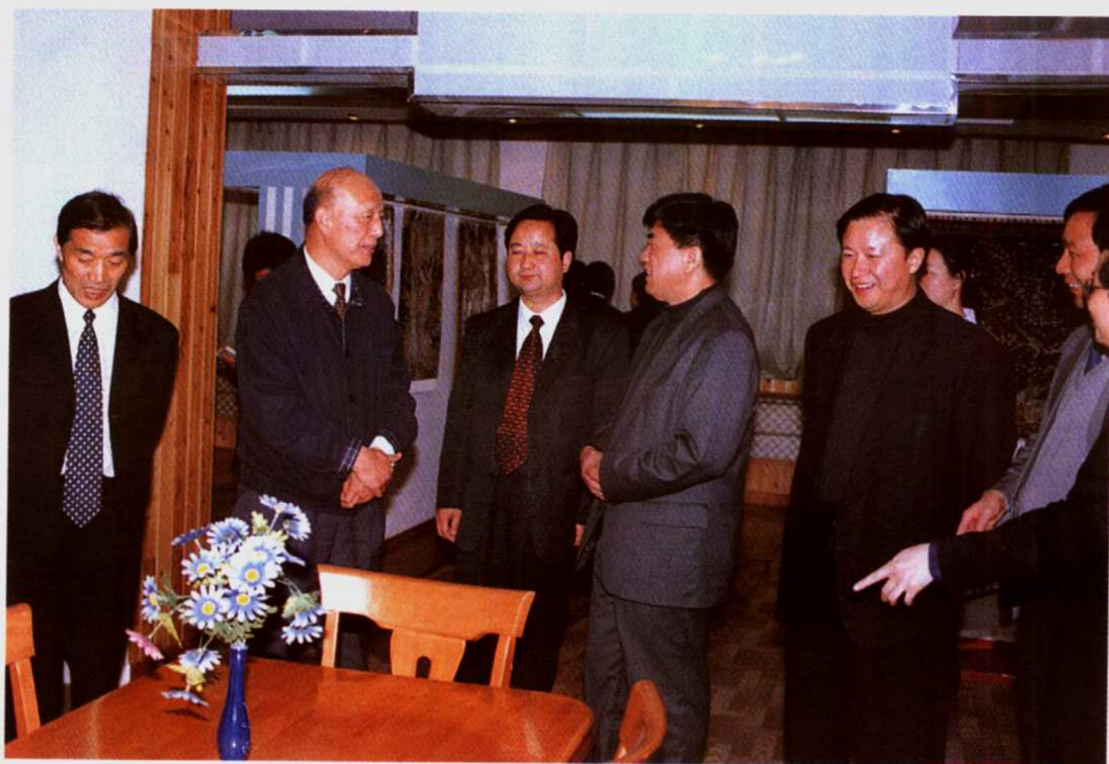
2002年4月7日,三峡工程建设委员会副主任兼办公室主任郭树言(左二)在市委常委、副市长李天岑(左一)和镇平县委书记王清选(左三)、县长赵金文(左五)陪同下视察镇平县地毯集团工业公司。