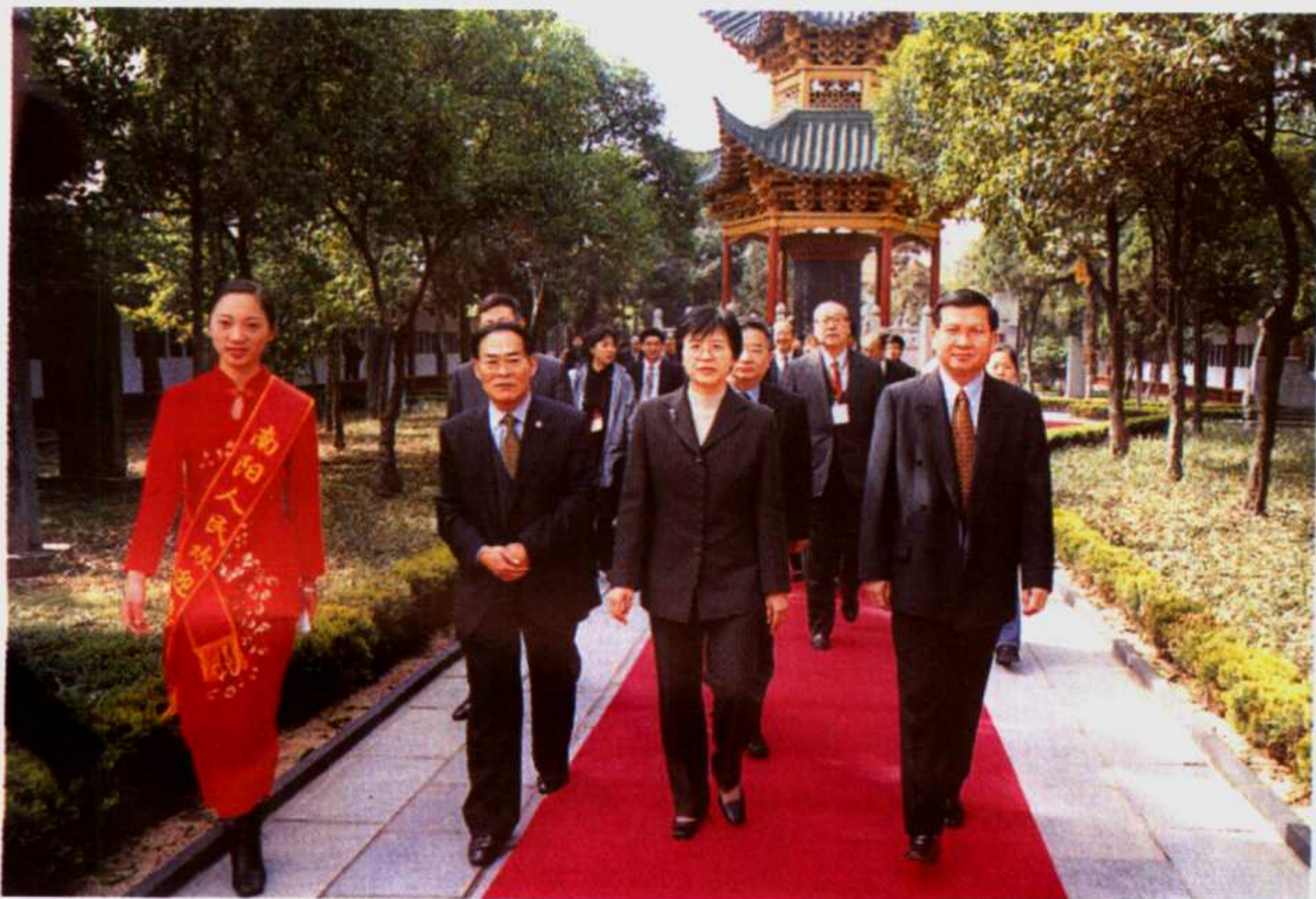
2002年4月9日，国家卫生部副部长、国家中医药管理局局长余靖(前排右二)、柬埔寨卫生部国务秘书吴飞如(前排右一)在市委书记马万令(前排右三)等陪同下在医圣祠参观考察。