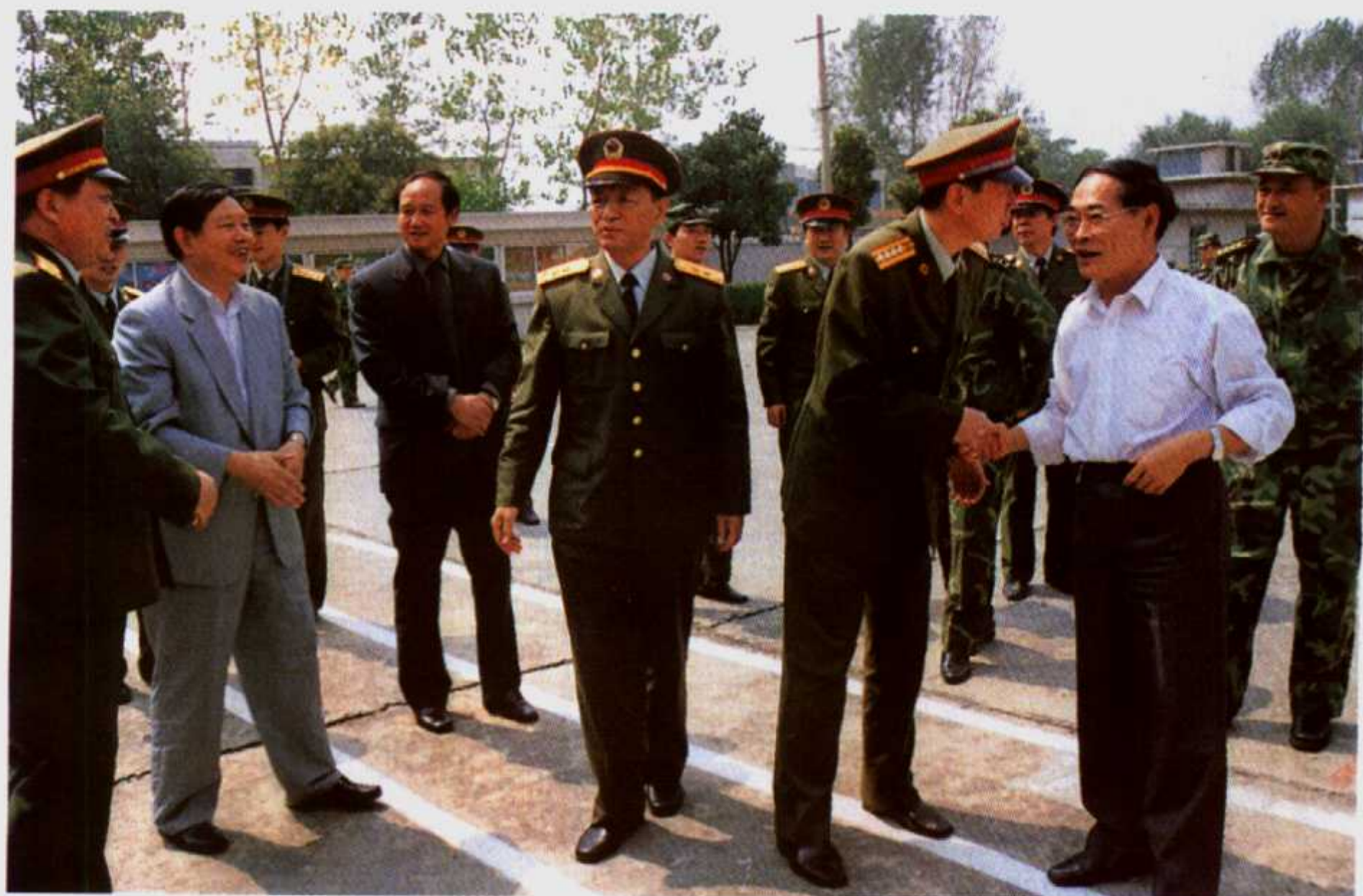
2002年9月16日，济南军区政委张文台中将(前排中)一行来宛，就邓州“编外雷锋团”现象进行专题调研。省军区副政委胡庆海少将(左一)、市委书记马万令(前排右一)、市长何东成(前排左二)、南阳军分区司令员徐俭(前排右二)等陪同调研。