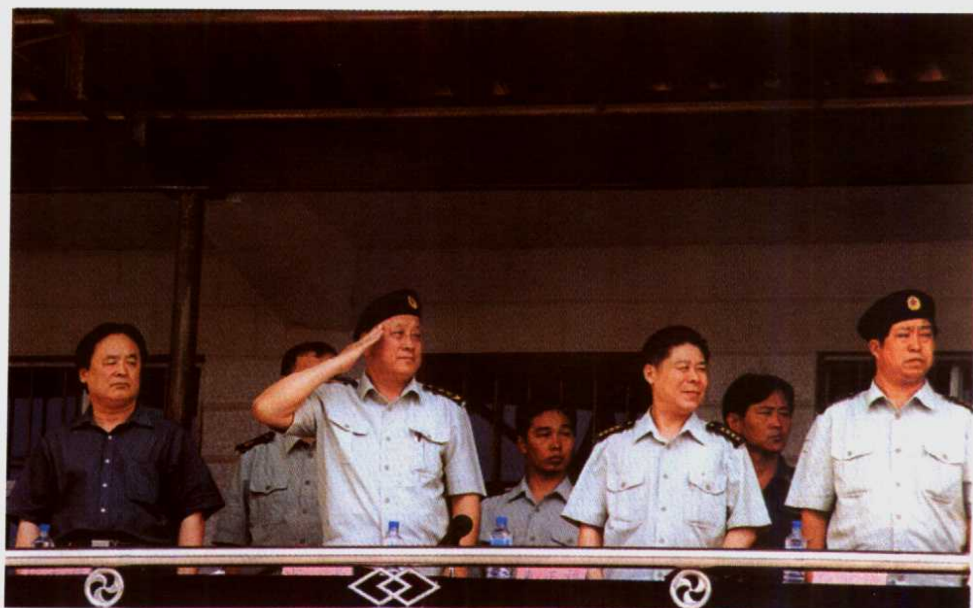
2002年6月7日，中共中央委员、济南军区副司令员李良辉中将一行莅临我市视察民兵预备役工作。图为李良辉中将(左二)在市委常委、河南石油勘探局党委书记姚大福(左一)陪同下检阅油田民兵队伍。