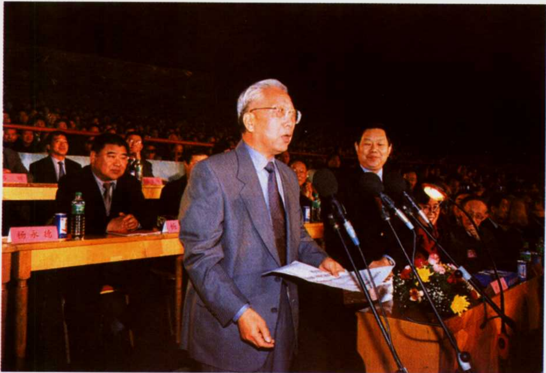
2002年4月8日晚，全国政协副主席张思卿在南阳市体育中心宣布中国·南阳张仲景医药创新工程推介暨经贸洽谈会开幕。