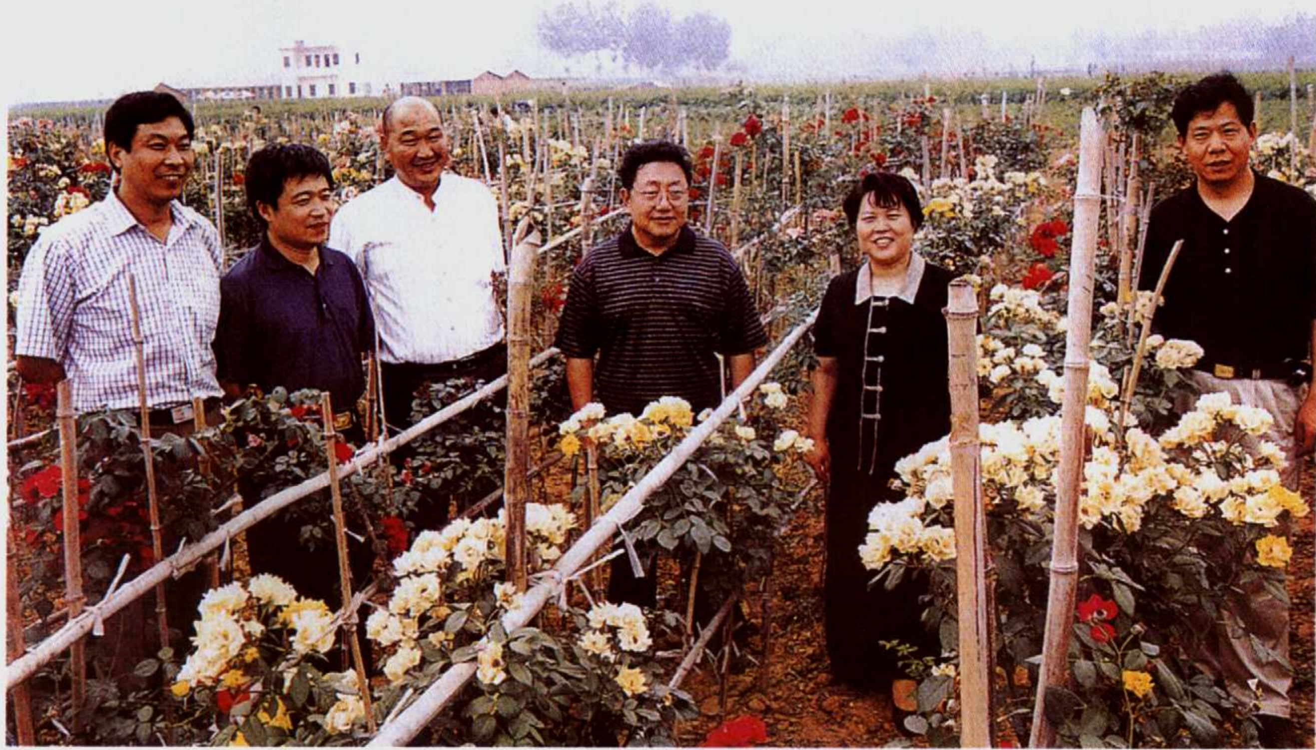
2002年6月19日，省委书记陈奎元(右三)在卧龙区委书记田向和(右二)、区长王吉波(右一)的陪同下视察卧龙区石桥镇花圃基地。