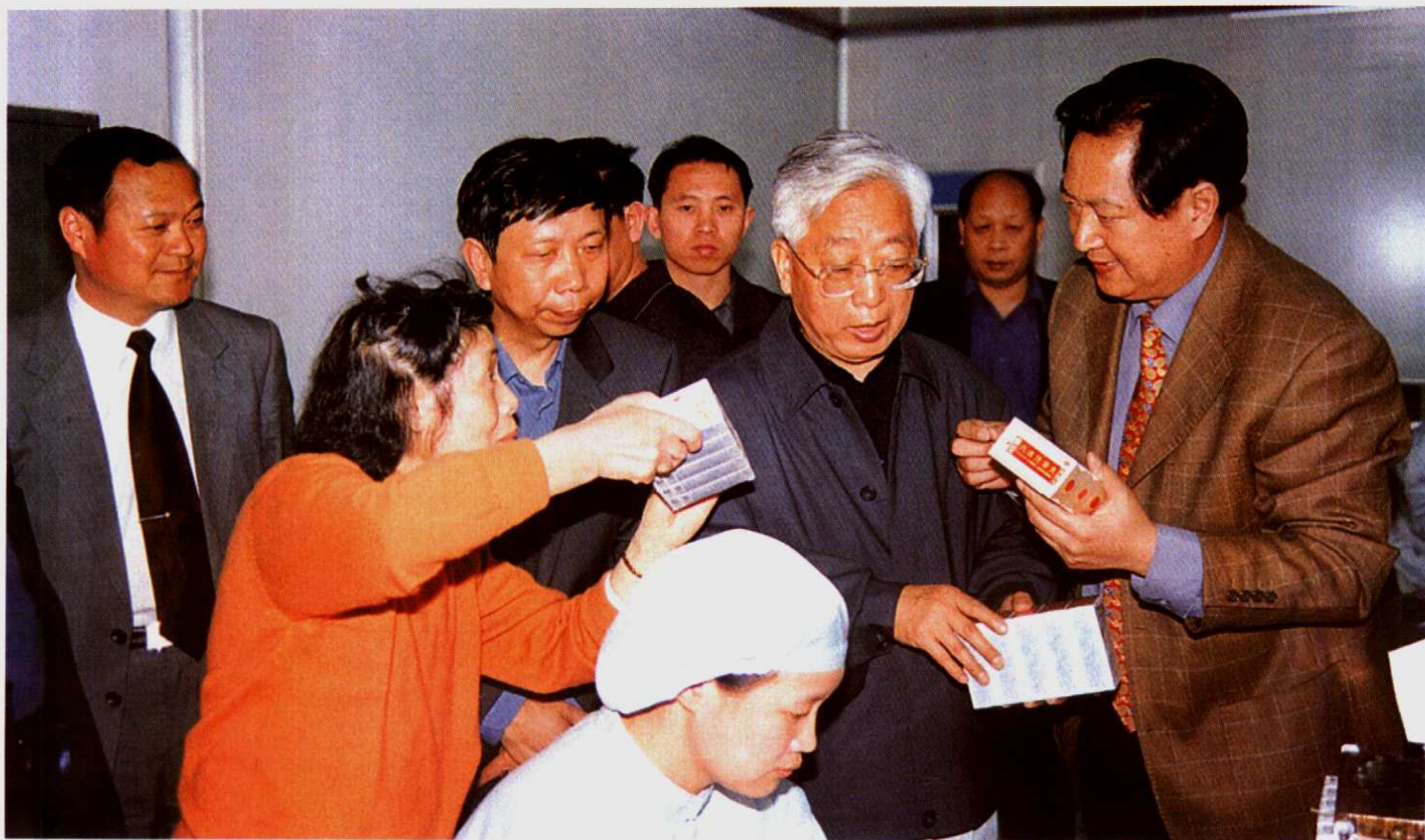
2002年4月5日至9日，全国政协副主席张思卿(右三)来我市考察指导工作。图为张思卿在西峡县委书记刘朝瑞(左三)、县长杨炳旭(左一)和宛西制药股份有限公司董事长孙耀志(右一)陪同下在宛西制药股份有限公司考察的情景。