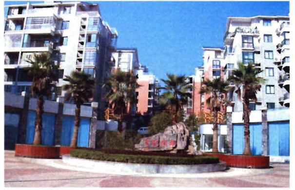
丰球绿都住宅小区