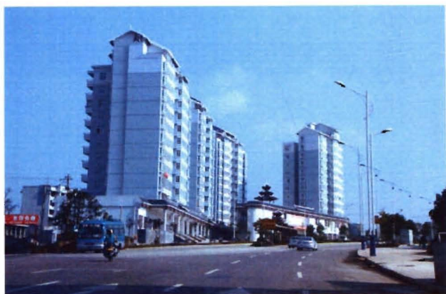
迎宾大道旁的富源天地