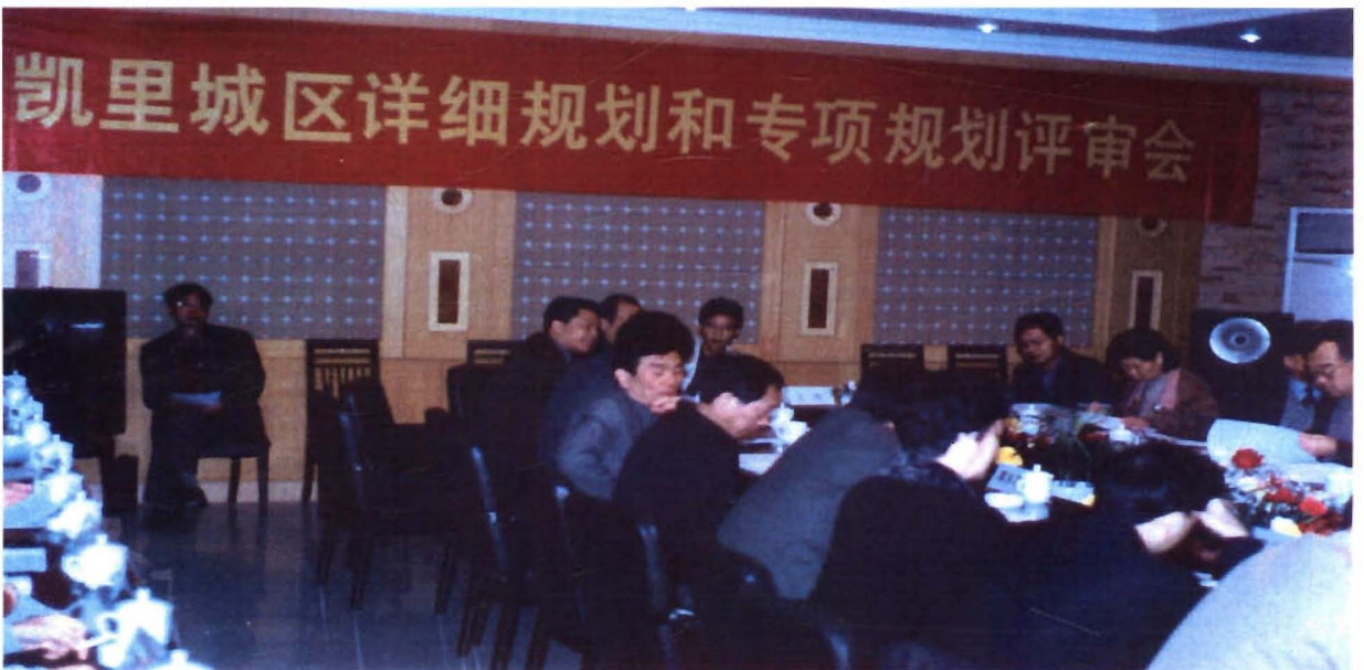
凯里城区详细规划和专项规划评审会现场