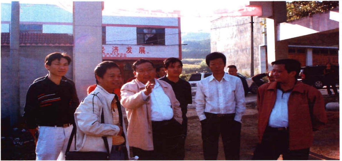
市委副书记、市长洪金州在凯棠检查指导建设工作