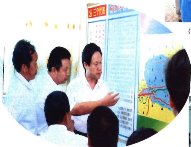
州委常委、市委书记杨正明深入社区检查指导工作