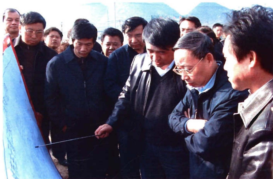
省长林树森视察凯雷公路建设