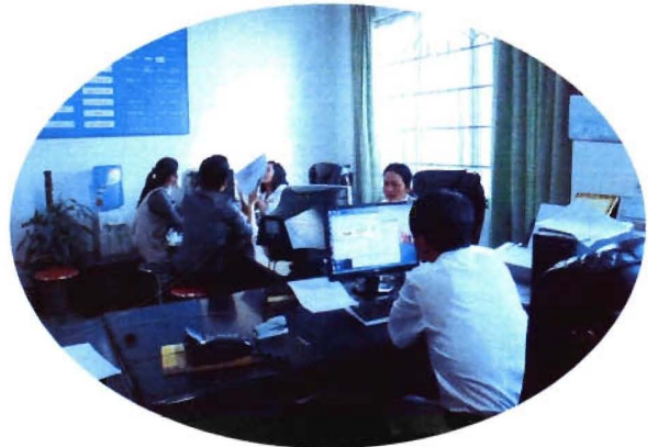
凯里市建设局办证大厅