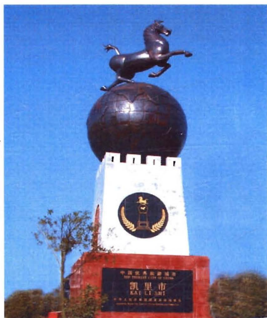
全国优秀旅游城市标志雕塑《马踏飞燕》