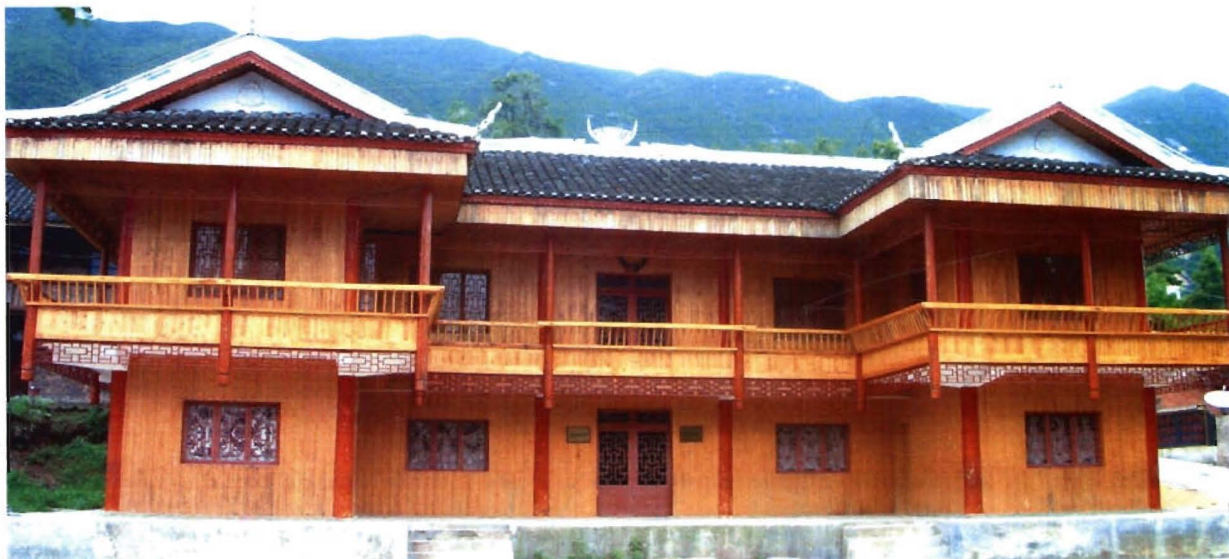
曼洞村民族刺绣陈列馆