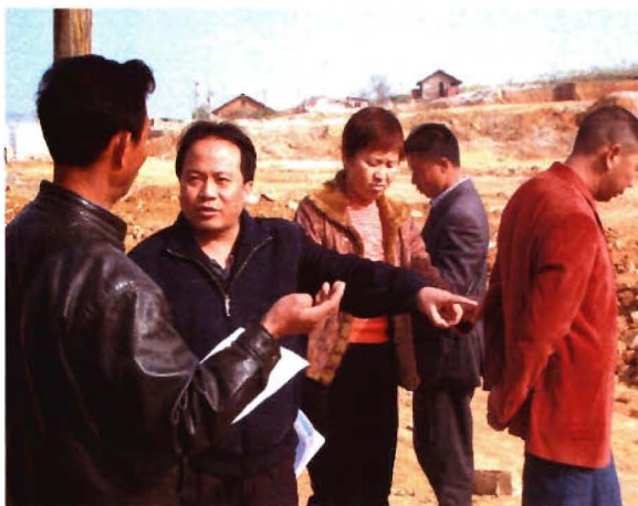
局党组书记吴启明深入工地检查工作