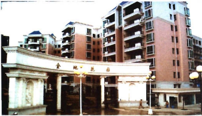
金地花园住宅小区