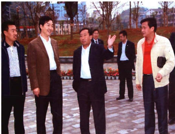
市委副书记、市长洪金州检查行政 中心绿化广场工程