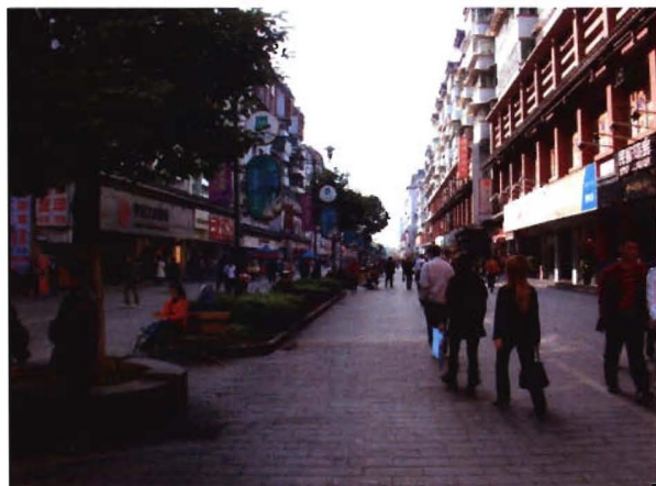
凯里营盘西路商业步行街