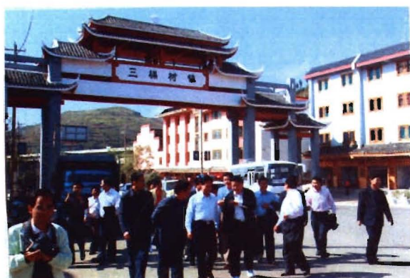
省纪委书记王正福视察小城镇建设工作