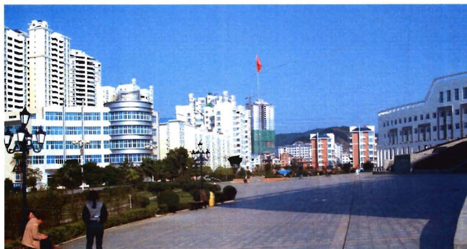
凯里行政中心广场一角