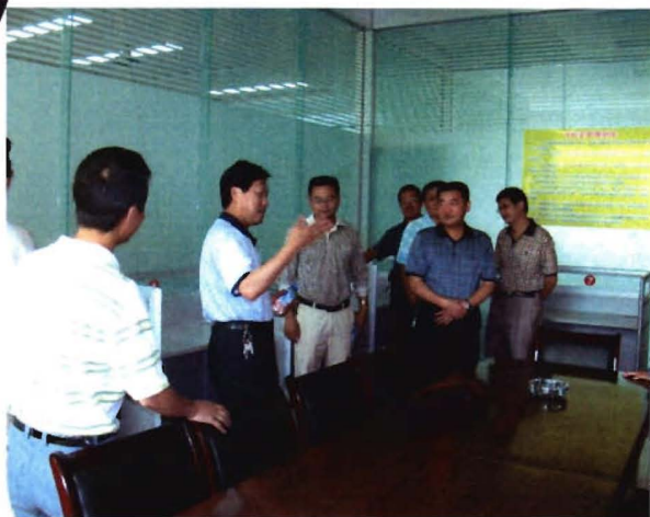
州委常委、市委书记杨正明视察凯里市建设局工作