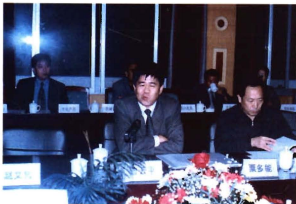
州委常委、市委书记曹云平在凯里城区详细规划和专项规划评审会上