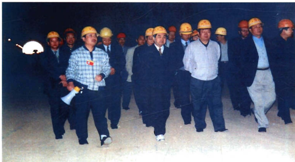
省长石秀诗视察大阁隧道工程