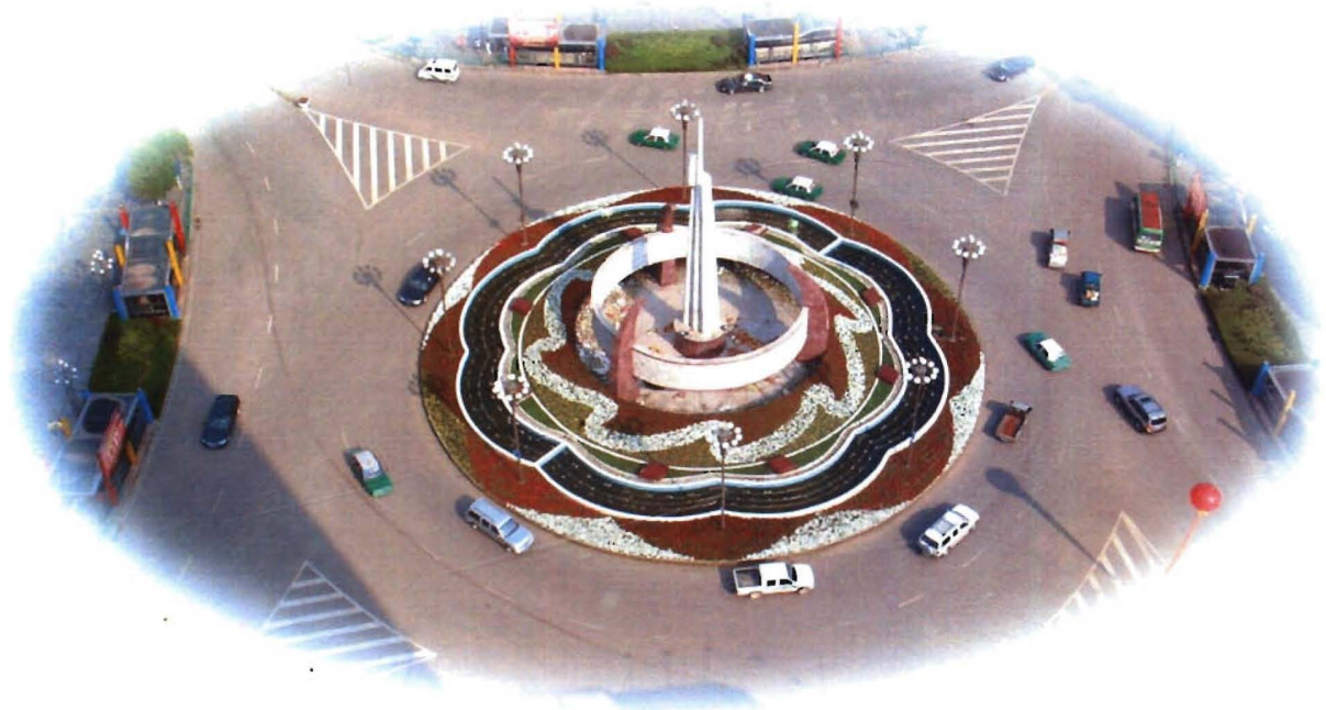
凯里大十字街心花园