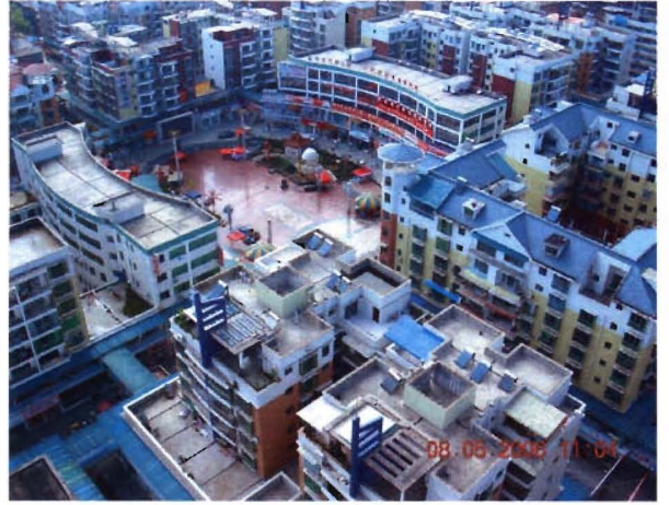
开发建设后的中博广场