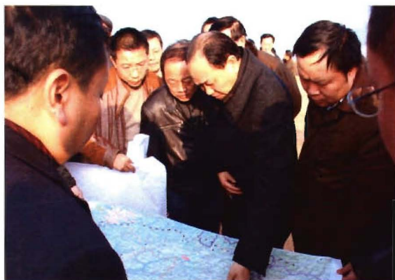
副省长孙国强(左二)视察炉山工业园区建设工作