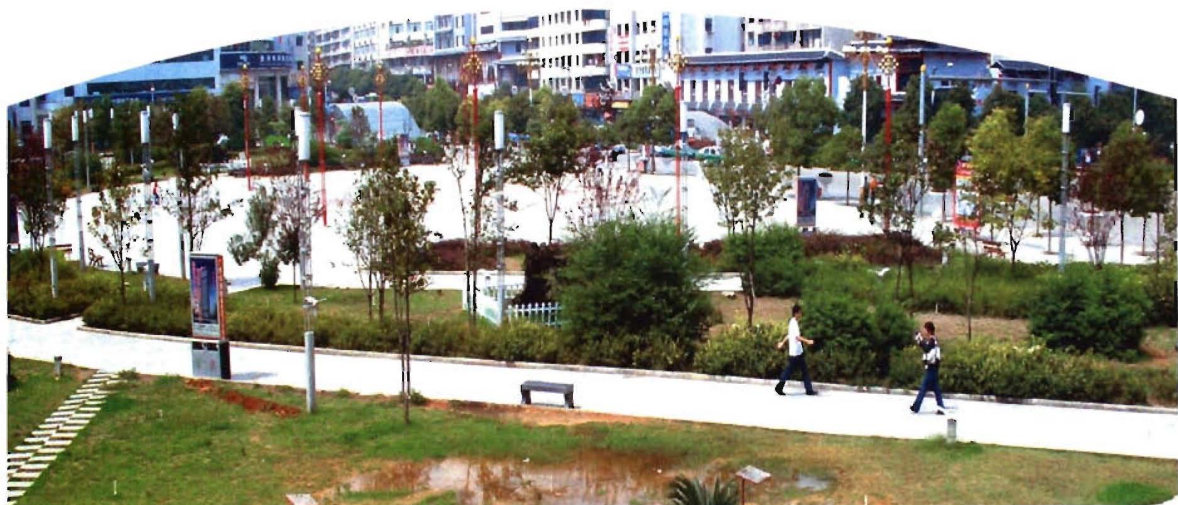
凯里万博文化休息广场