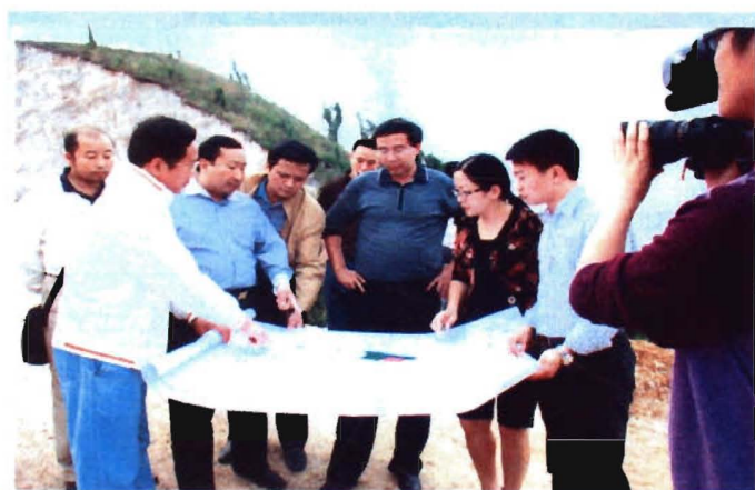
州长李飞跃深入凯里市视察建设工作