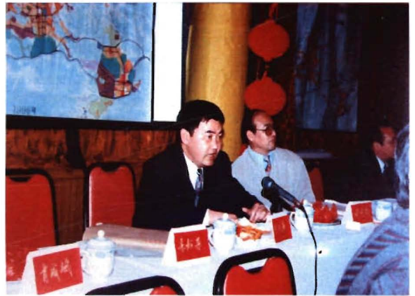
市人民政府副市长马仁华 在96总规审查会上汇报工作