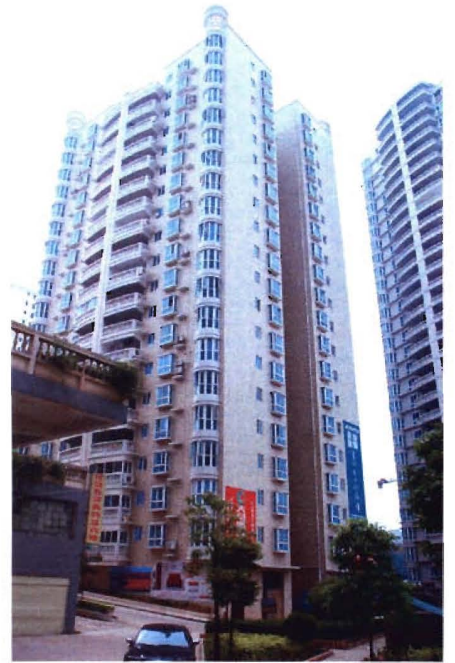
昆鹏家园住宅小区