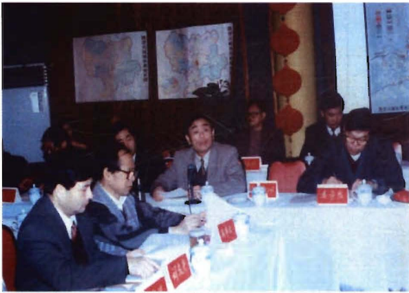
州委常委、市委书记邓锦洲在凯里96总规评审会上