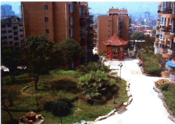
鸿洲桂园住宅小区