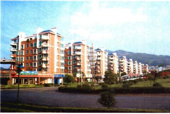
东升金湖华庭住宅小区