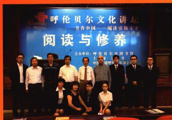
2013年7月30日，新馆开馆后与上海图书馆、中国网通呼伦贝尔分公司联合举办首期呼伦贝尔文化讲坛。图为著名学者阎崇年先生（左五）与工作人员合影。