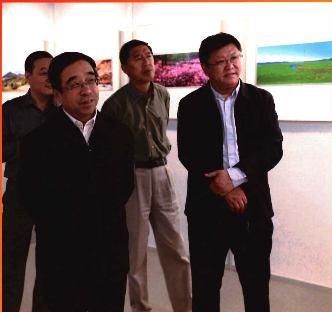
呼伦贝尔市市长张利平视察图书馆。