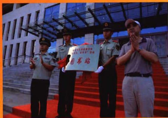
2013年7月31日，市图书馆向呼伦贝尔市森林支队授图书站牌匾。