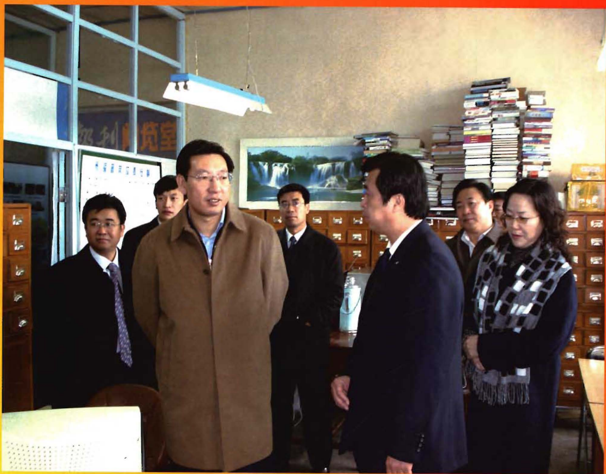
2007年，呼伦贝尔市市委书记曹征海视察市图书馆。