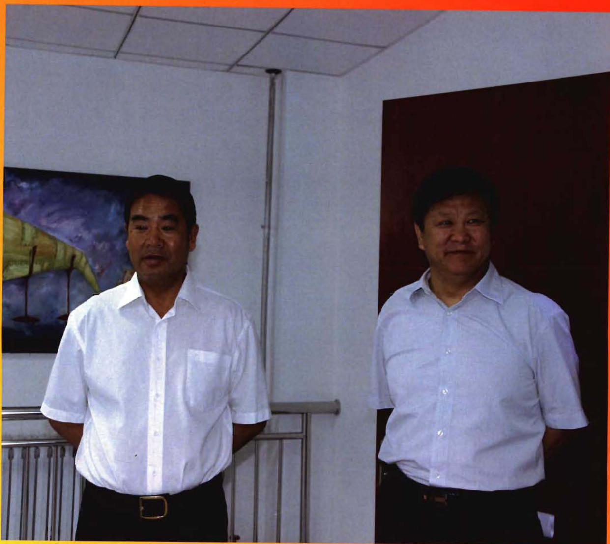
呼伦贝尔市副市长牛振声、文新广局局长何涛视察少儿图书馆。