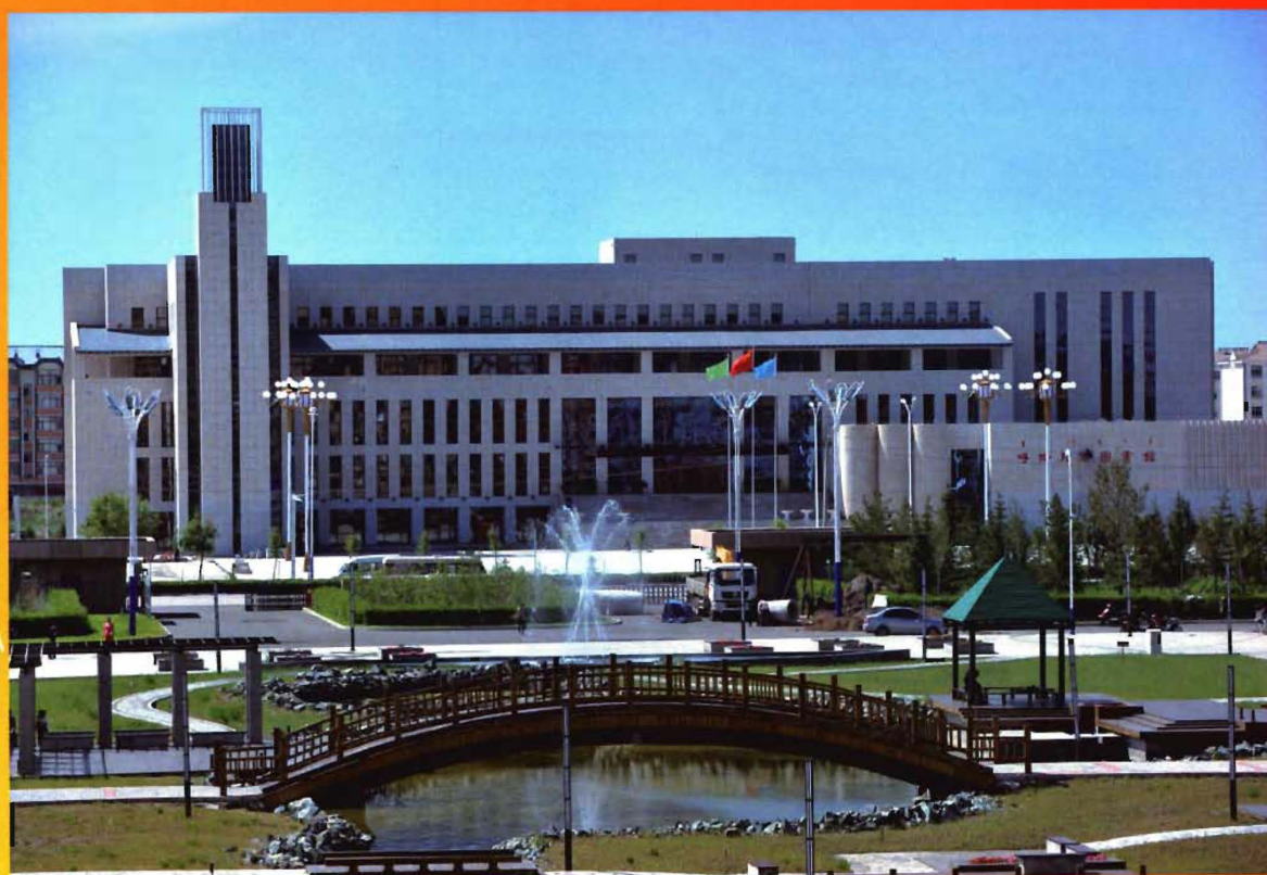
呼伦贝尔市人民政府投资兴建的呼伦贝尔市图书馆大楼 2013 年 6 月 29 日试开馆。