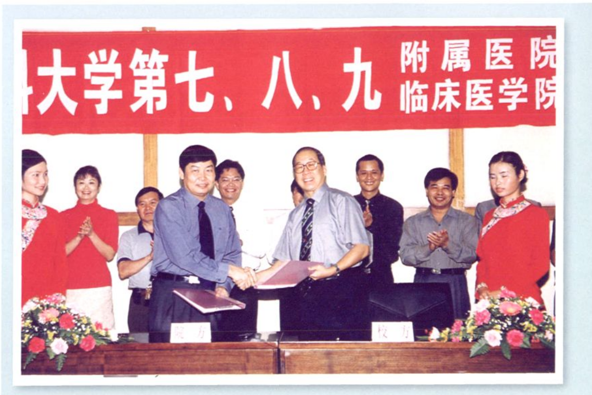
广西医科大学第八附属医院、第八临床医学院签字仪式