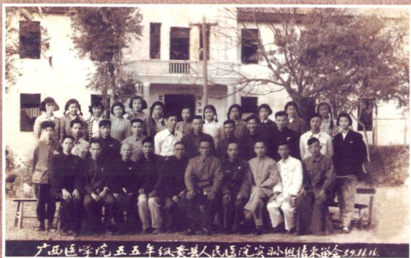
广西医学院55级 贵县人民医院实习小 组实习结束留念