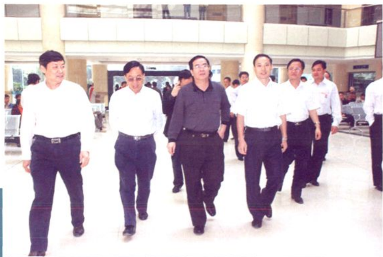
自治区卫生厅厅长李国坚（左三）到医院检查、指导工作