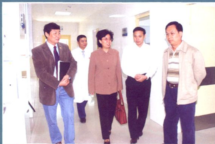
自治区卫生厅巡视员徐亚南（中）到医院检查、指导工作