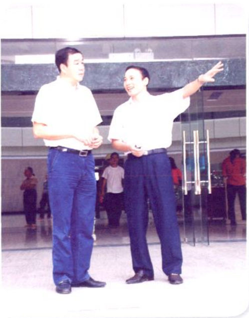
贵港市市长唐成良（左）到医院指导工作