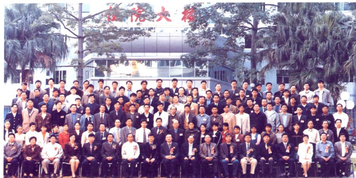
贵港市人民医院医学人才培养基地手外科、显微外科、微创外科学习班合影