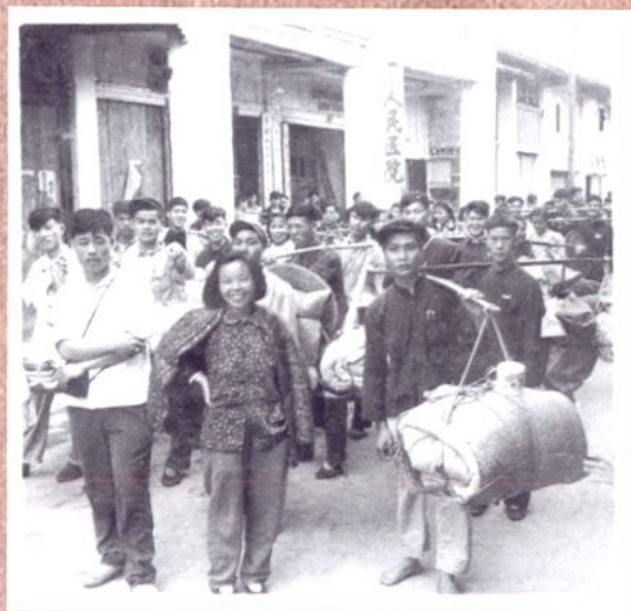
20世纪50年代下乡医疗队