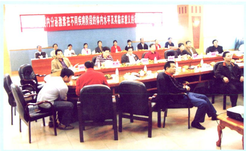
医院科研鉴定会现场