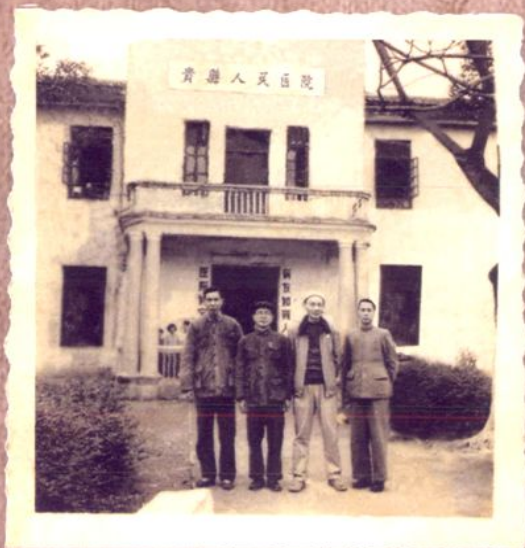
20世纪50年代人民医院(旧公医院)正门