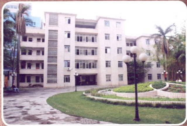
1978年建成的医院住院综合楼