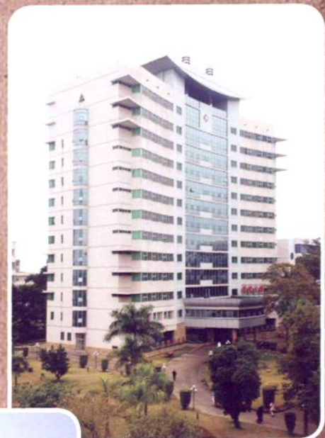
2000年启用的医院外科住院大楼