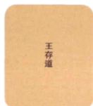
王存道 院长 1938.12~1946.4