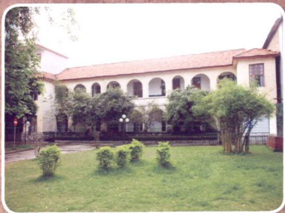
1962年医院住院楼(原玉林地区农校红瓦楼)