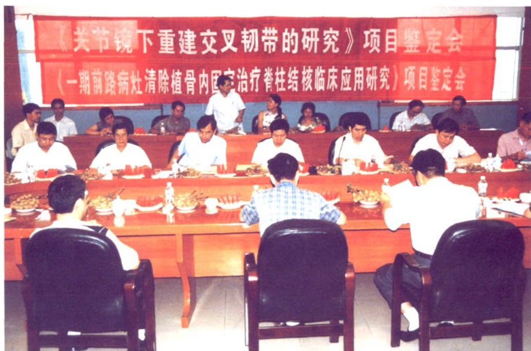
医院科研鉴定会现场