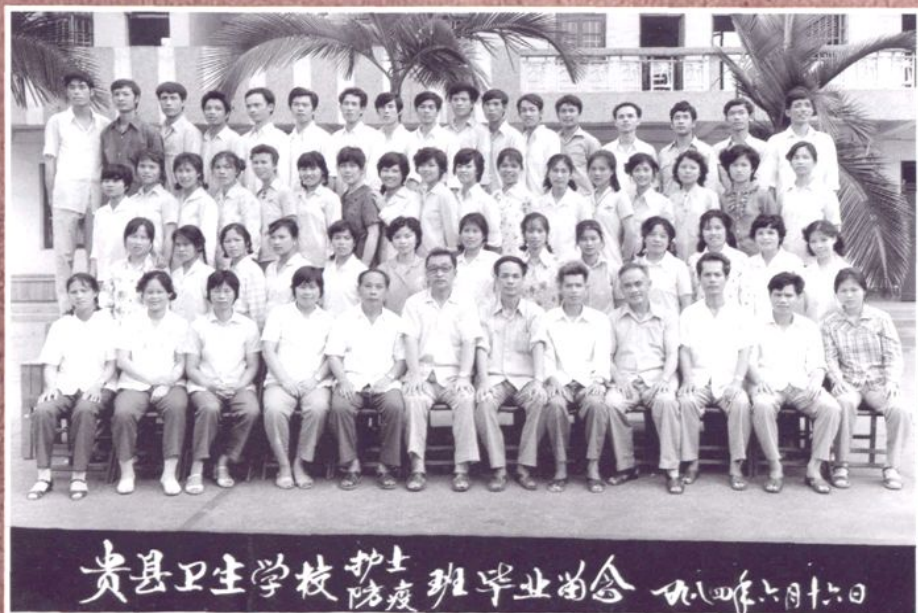
1984年贵县卫校护 士、防疫班毕业留念