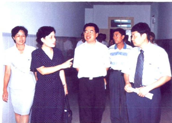
自治区人民政府原副主席袁凤兰（左二）到医院指导工作