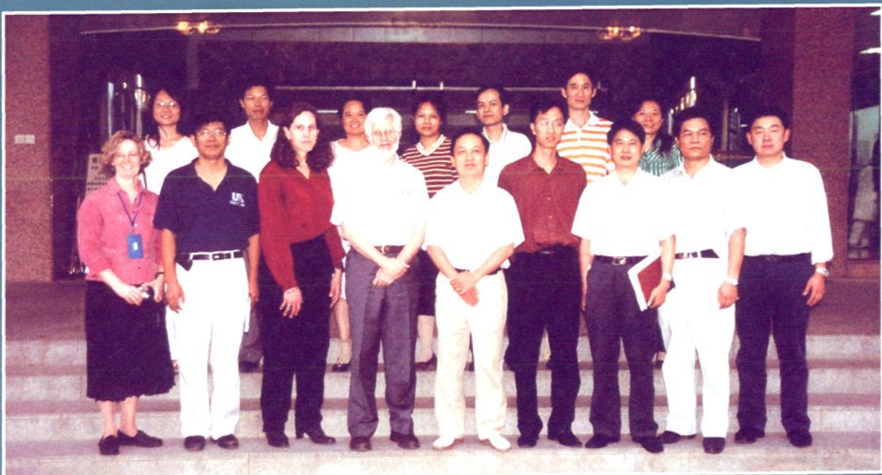
世界卫生组织专家团到医院指导工作