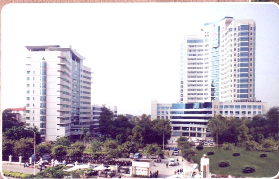
2008年医院外科住院大楼和门诊医技综合楼