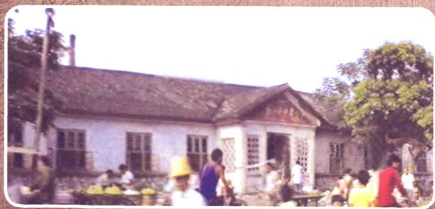
1965年~1970 年贵县人民医院门诊 (现骨科医院地址)