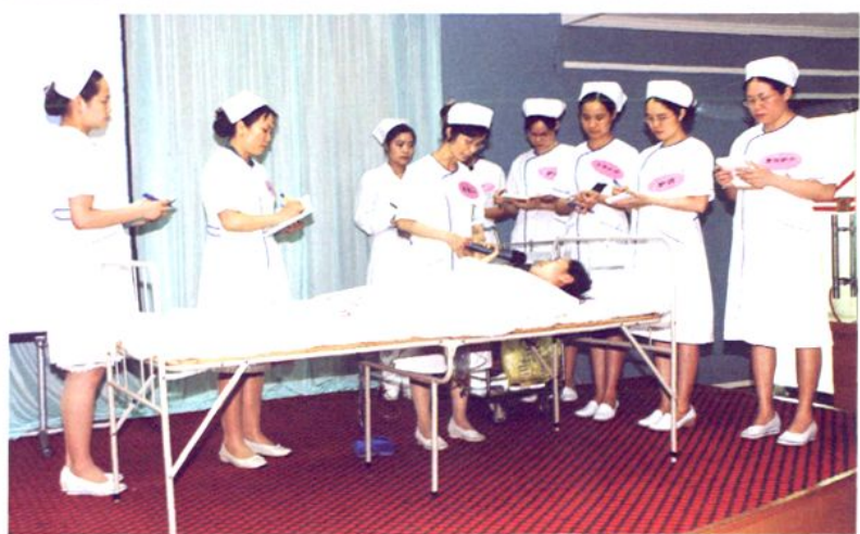
医院护理技能培训