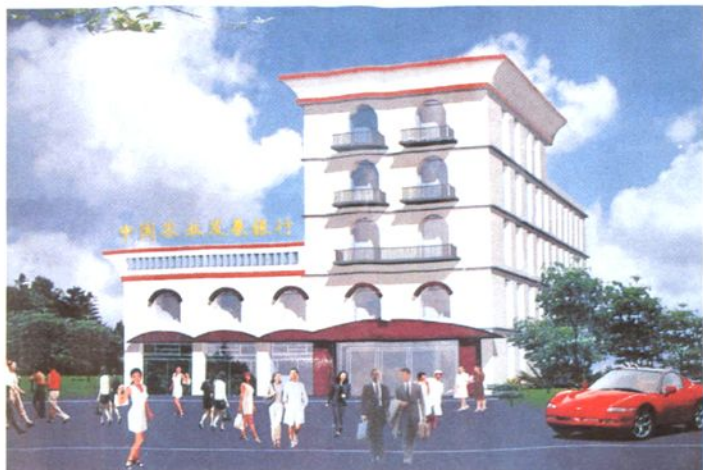
农发行叶县支行办公楼