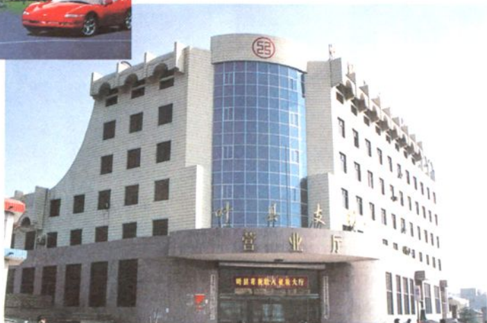
工行叶县支行办公楼