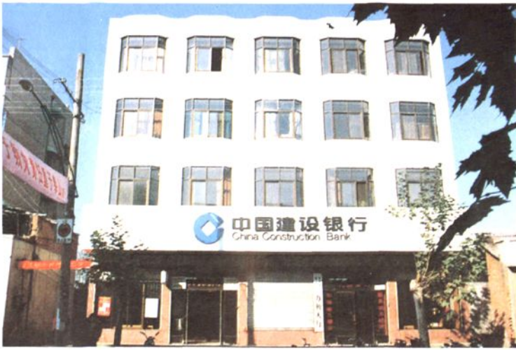
建行叶县支行办公楼