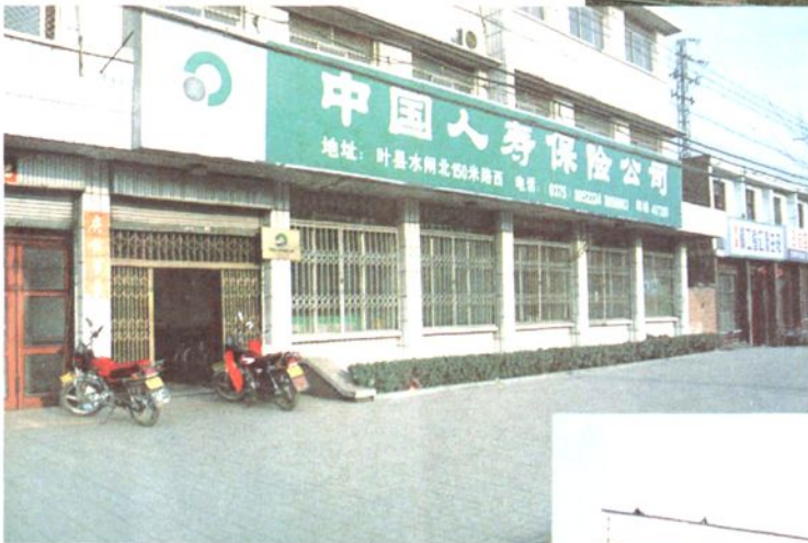
寿险叶县支公司办公楼