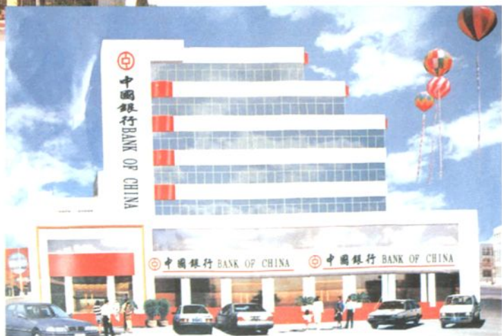
中行叶县支行办公楼