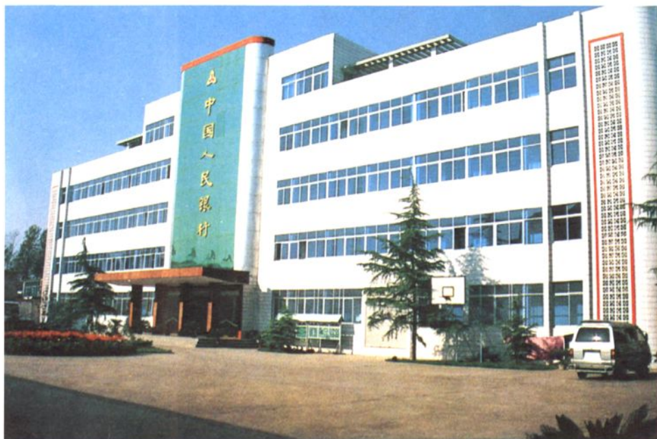
人行叶县支行办公楼