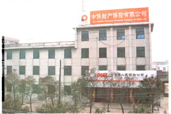
财险叶县支公司办公楼