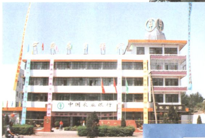
农行叶县支行办公楼