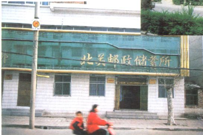
邮政储蓄营业网点