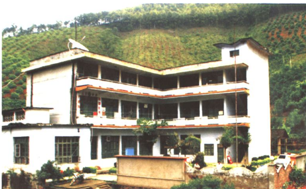
广运林场办公大楼