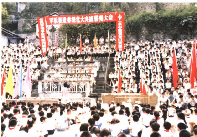
平乐县造林绿化大决战誓师大会