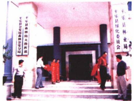
2003年11月5日林业局新办公大楼落成庆典