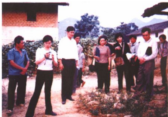
国家农业部到我县检查验收小型公益事业项目沼气池。