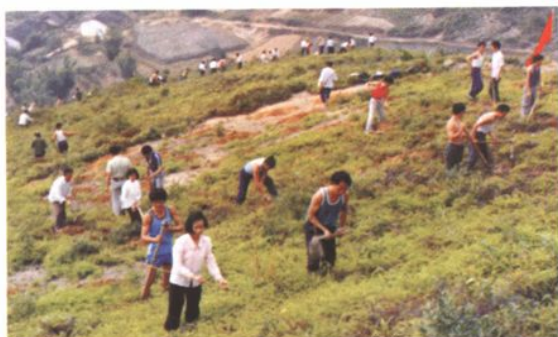
轰轰烈烈的植树造林活动