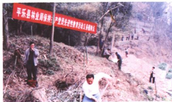
林业局保持共产党员先进性教育活动义务植树造林。