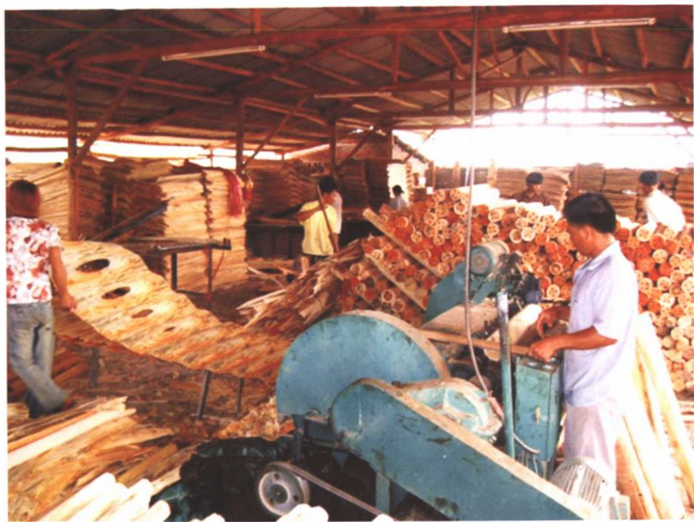
平乐县新兴的林产加工业