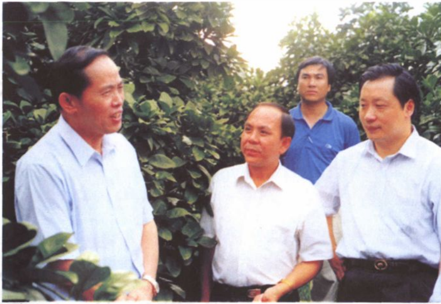
自治区原主席李兆卓（左一）桂林市人民政府原市长李金早（右二），在平乐县县长杨思情（左二）的陪同下，视察我县沙子十里坪柚子基地。