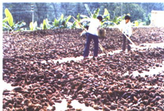
精心翻晒马尾松树种