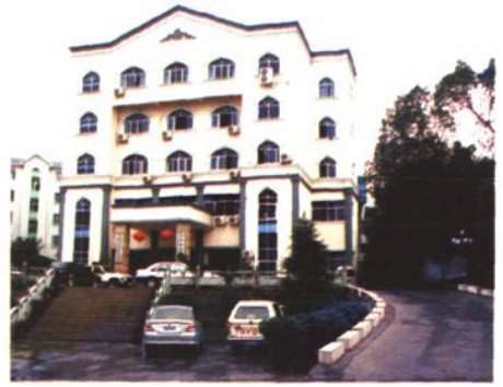
林业局新办公大楼