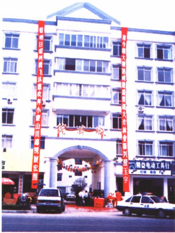
“绪林城”林业局大院正门