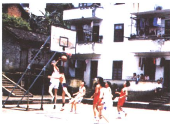
活跃的林业职工文体活动