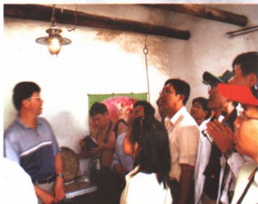
东南亚多国能源专家考察组在沙子考察沼气建设情况。