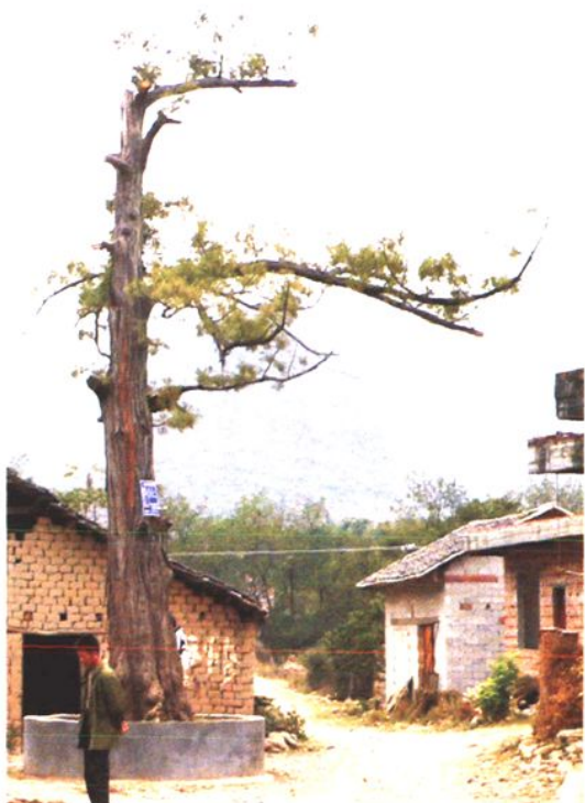
生长在沙子保安村的树龄600年的水松树