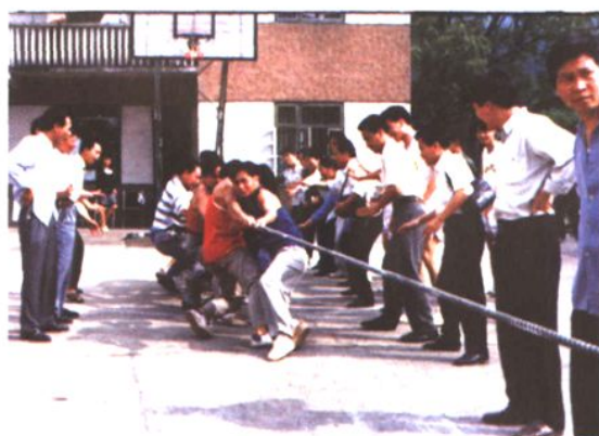
林业局和广运林场开展拔河比赛活动