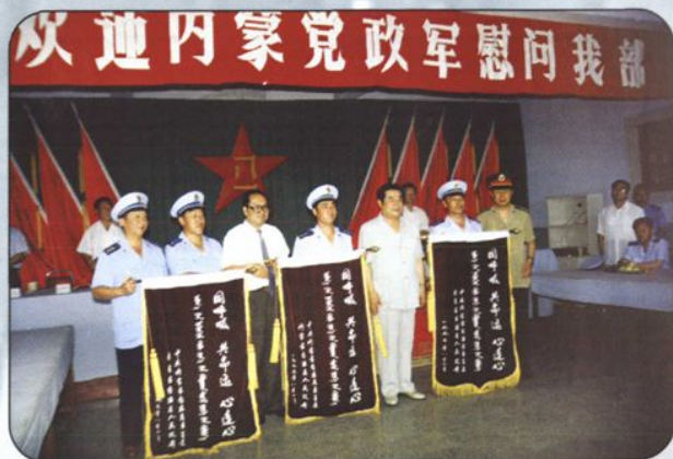
↑自治区党委书记刘明祖、政府主席云布龙、内蒙古军区政委彭翠峰在“八一”建军节慰问驻自治区空军某部指战员，并赠送锦旗和慰问品，受到驻军热烈欢迎。