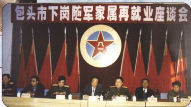
↑ 千方百计解除部队指战员的后顾之忧。