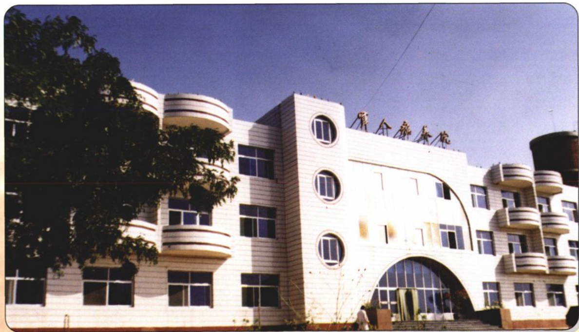
↑克什克腾旗复员军人慢性病疗养院，以温泉疗养为主，配有中、西、蒙医。已对外开放，每年接待国内外患者千余名。