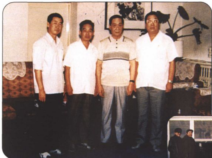
↑1992年7月，内蒙古、吉林省到国家民政部汇报划界情况，并与崔乃夫部长合影。