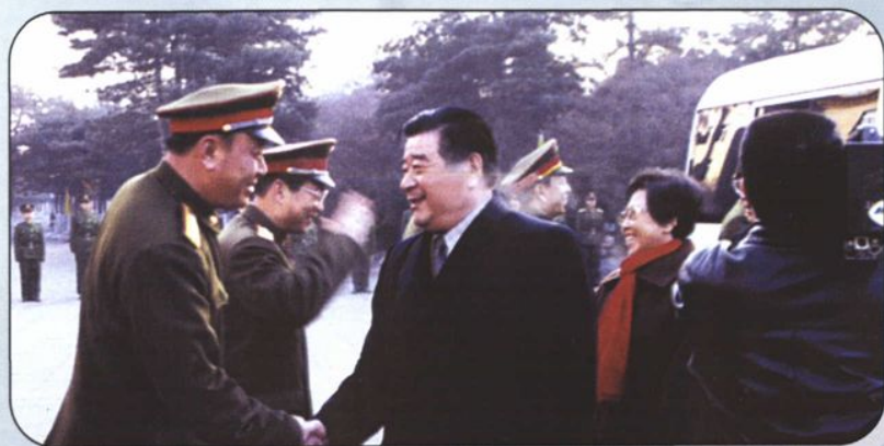
←2001年春节前夕，自治区党委书记刘明祖、政府主席乌云其木格慰问内蒙古军区机关指战员。