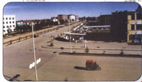
↑小城镇建设的典型——扎赉特旗音德镇。