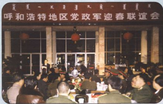
↑1997年春节期间，自治区党委、政府召开呼和浩特地区党政军迎春联谊会。