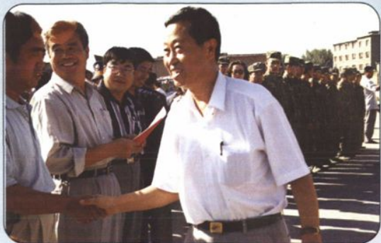
←1998年，自治区副主席周维德慰问参加运输抢险物资的解放军指战员。