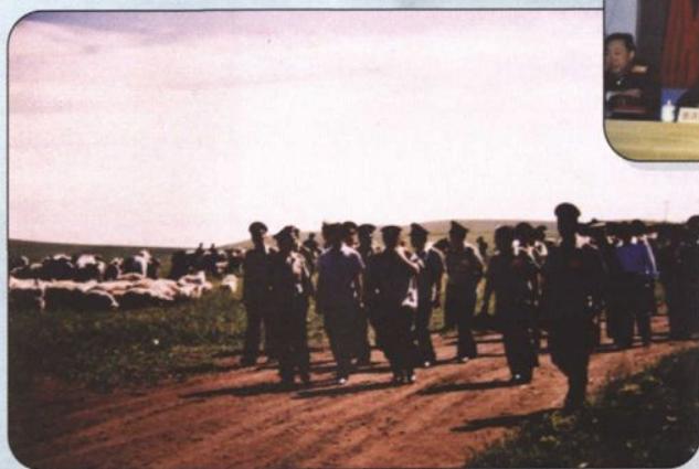
↑ 兴安盟政府为驻军武警部队划拨优质草场，支援部队建设。