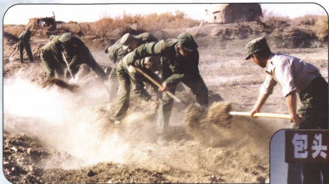
↑ 1993年，内蒙古军区官兵在参加自治区重点工程建设——修建光缆线。