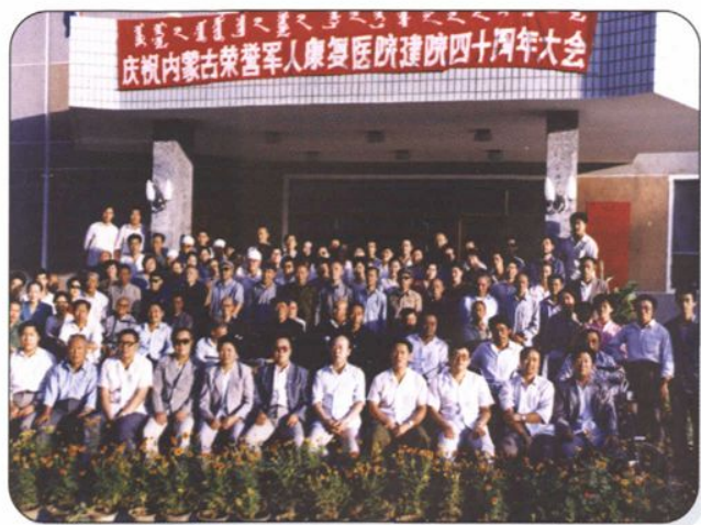
←1991年，内蒙古荣誉军人康复医院建院40周年。图为民政厅领导和全体医护人员合影。

→1994年5月，国家民政部多吉才让部长在自治区副主席周维德和民政厅任凤翔厅长陪同下，视察荣誉军人康复医院。