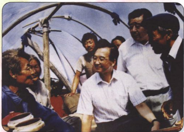
↑1998年8月，中共中央政治局委员、国务院副总理温家宝，在自治区党委书记刘明祖陪同下慰问兴安盟受灾群众，鼓励大家生产自救。