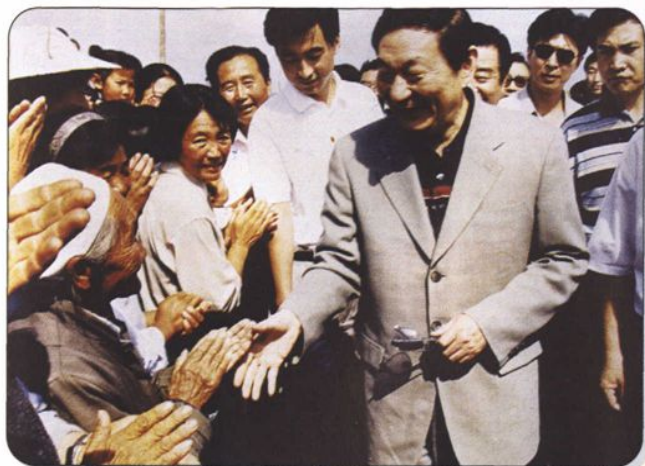
↑1998年8月28日，中共中央政治局常委、国务院总理朱镕基，前往兴安盟重灾区看望灾区的群众。