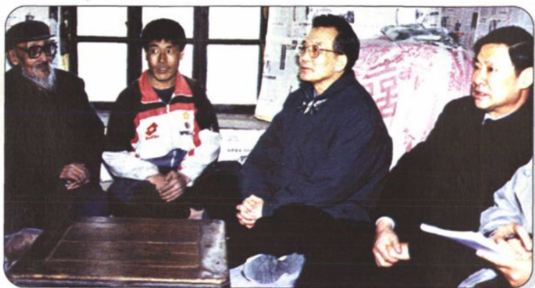
→2002年2月8日，中共中央政治局委员、国务院副总理温家宝在自治区党委书记储波陪同下，到赤峰市翁牛特旗牧民家看望。