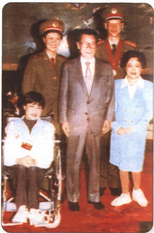
↑1998年秋，中共中央政治局常委、全国政协主席李瑞环，亲切接见“热爱祖国、自强不息、报告演出团”，并与内蒙古冠军运动员边建欣等合影。