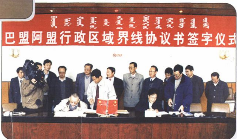
↑巴彦淖尔盟与阿拉善盟达成区域界线协议。图为双方在协议书上签字。