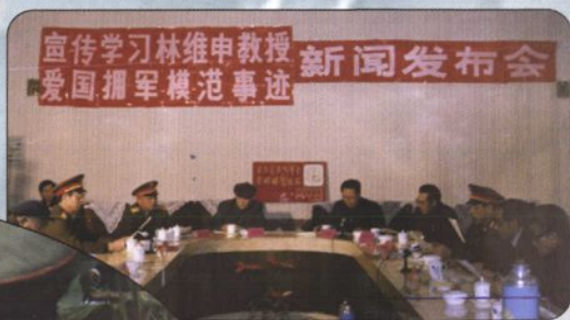
↑ 自治区党政领导号召全区各族人民学习林维申教授的先进事迹。