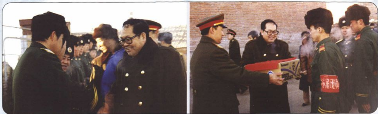
↑1997年春节期间，自治区副主席云布龙、内蒙古军区副司令员昭日格图慰问乌兰察布盟边警、武警官兵。