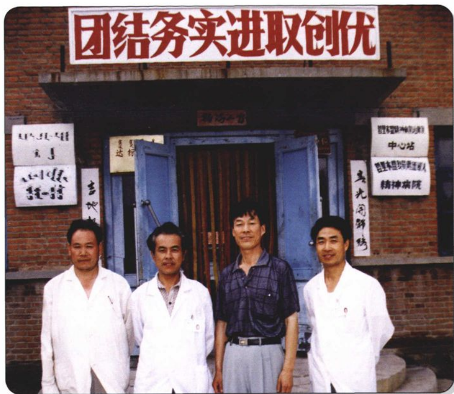
←哲里木盟复员军人精神病院已向社会开放。至1998年，医疗设备已比较齐全，有床位100张。