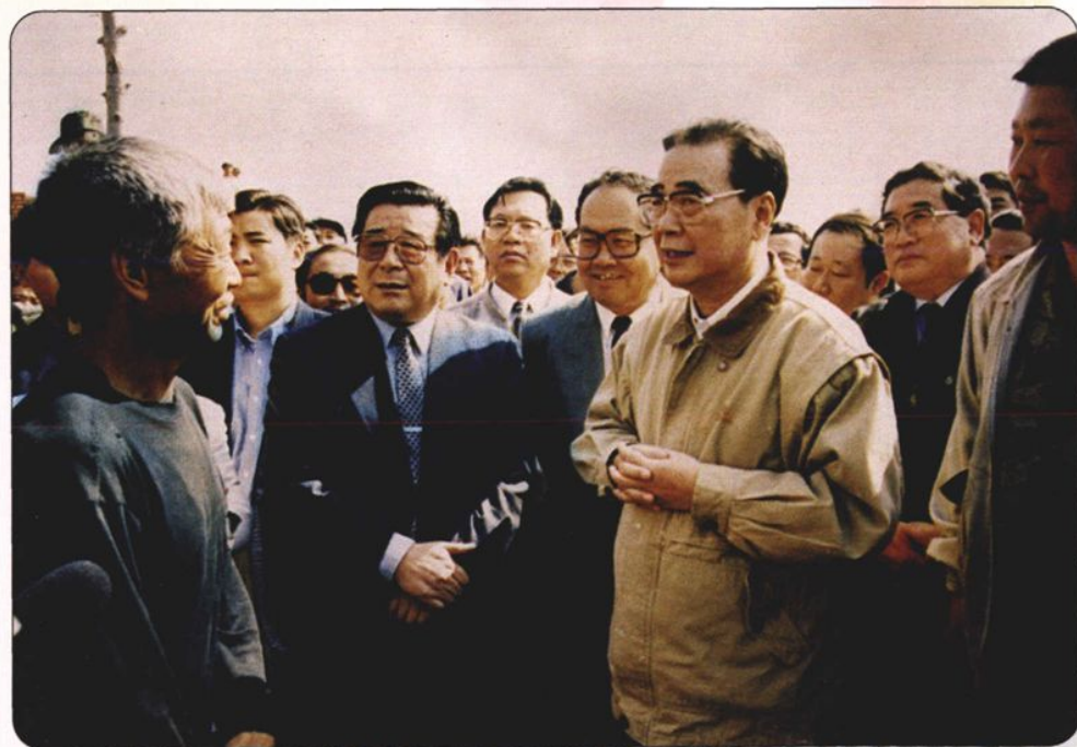
↑ 1998年9月24日，中共中央政治局常委、全国人大常委会委员长李鹏在自治区党委书记刘明祖、自治区主席云布龙陪同下，在重灾的兴安盟科右前旗归流河白音居办合嘎查特布新艾里，考察灾后重建工作，并与村民亲切交谈。