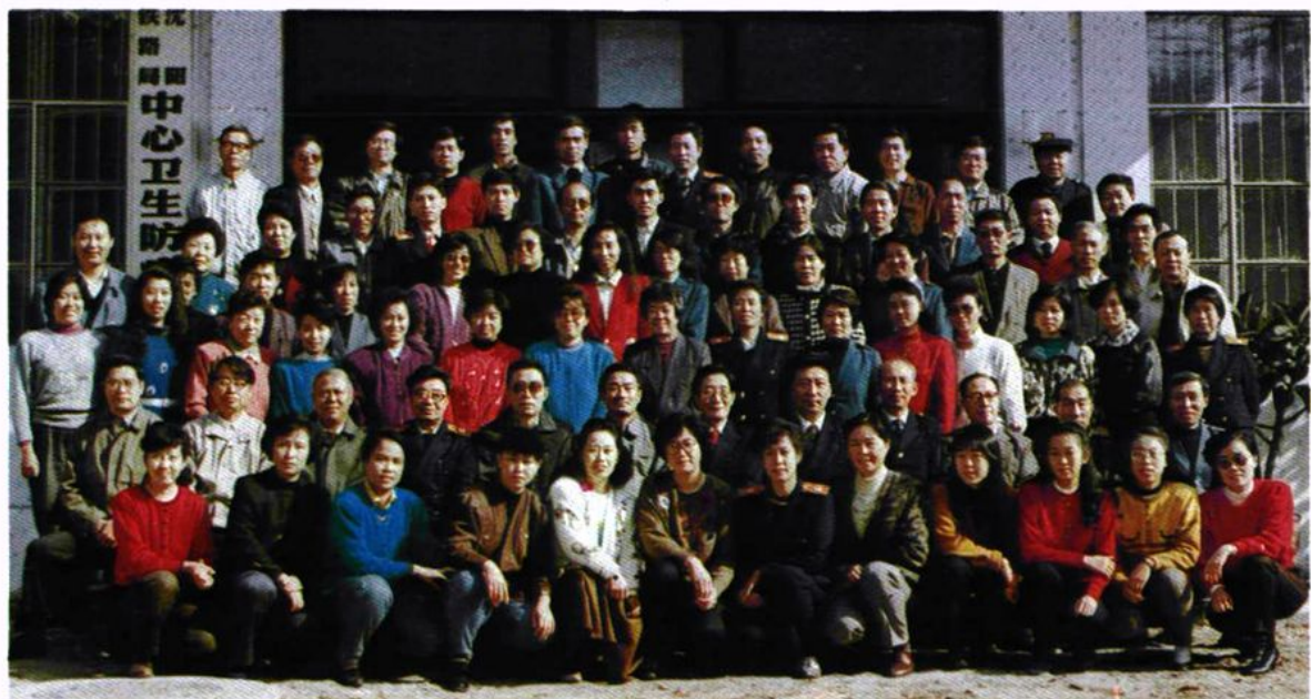
▲ 一九九二年全站职工合影