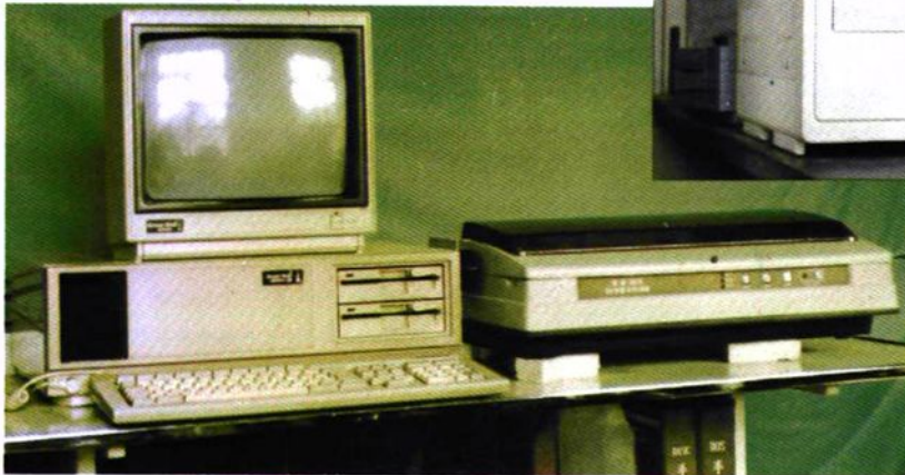
液相色谱仪 气相色谱仪 原子吸收分光光度计 荧光显微镜 高速离心机 微型电子计算机