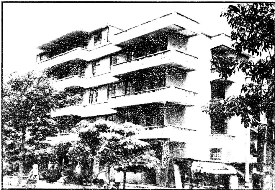
梅州市民政局办公大楼