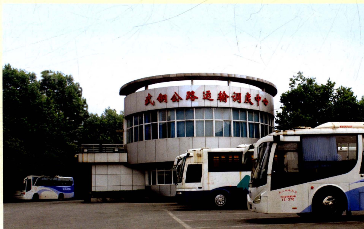
武钢公路运输调度中心