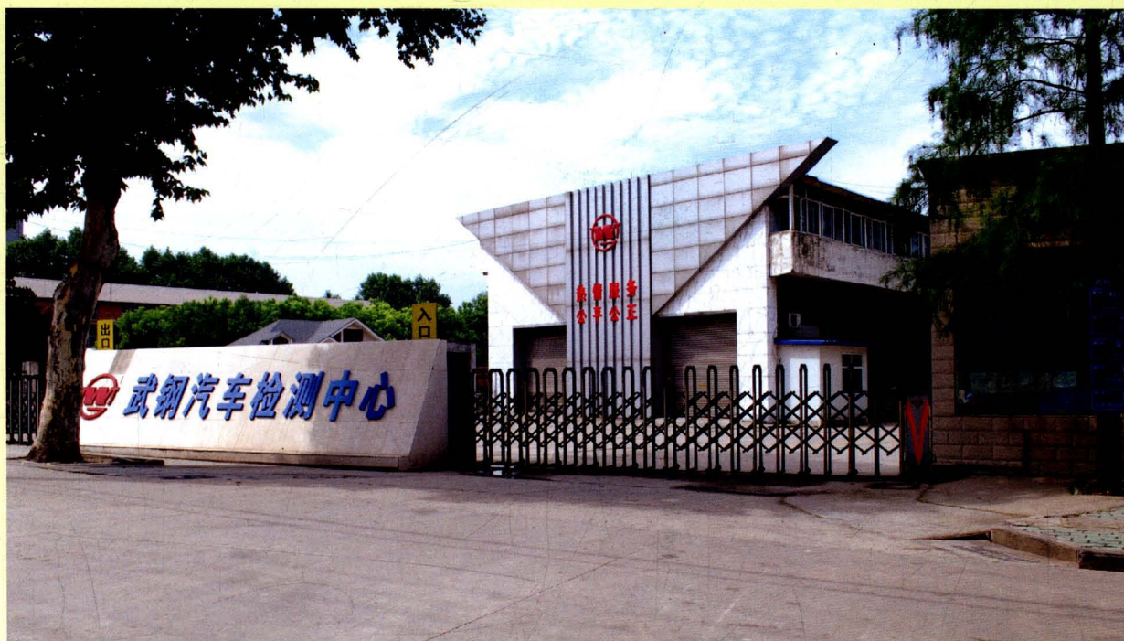
武钢汽车检测中心