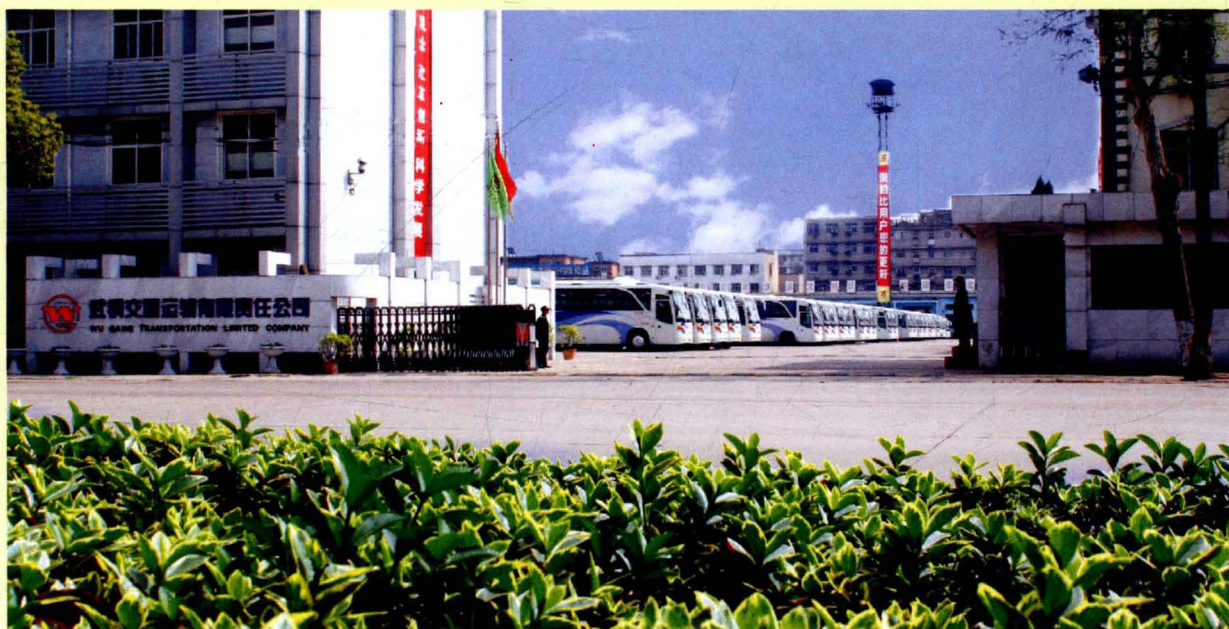
交运公司26街基地大院