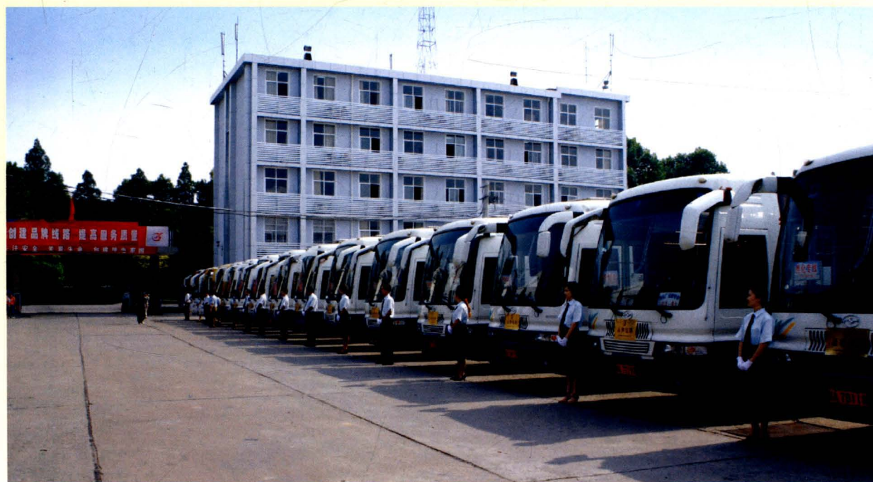
整齐划一，规范服务