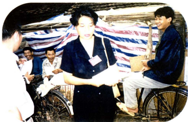
1998年岳阳市卫生局长宋爱华来临湘灾区视察救灾防病工作。