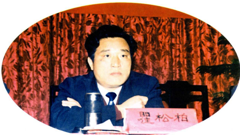
1998年市长瞿松柏在卫生工作会议上作报告。