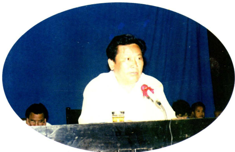
1996年市长杨国清在卫生工作会议上作重要讲话。