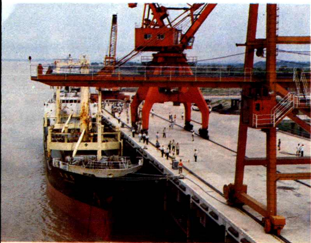
武汉港青山外贸港区码头