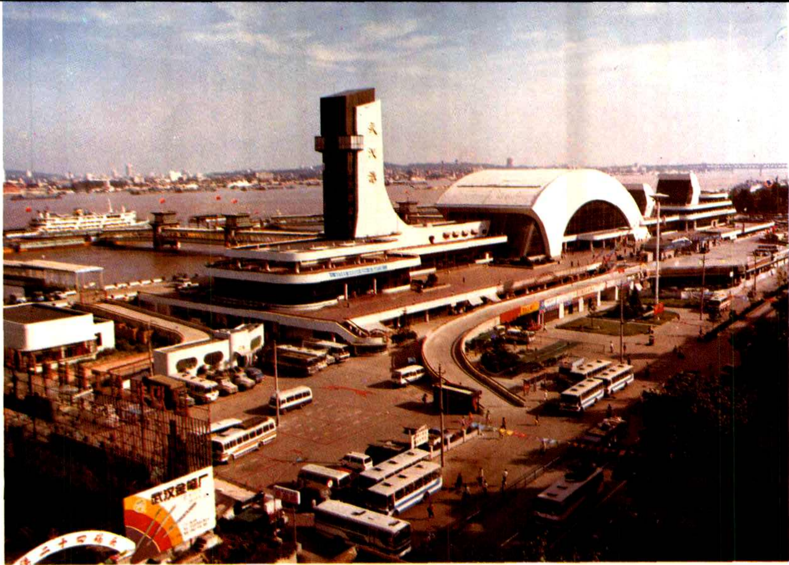
新建的武汉港客运中心枢纽