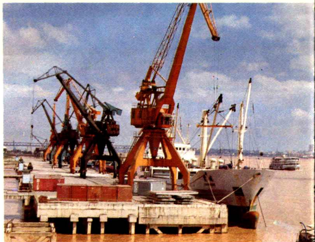
武汉港汉阳水陆联运港区码头之一