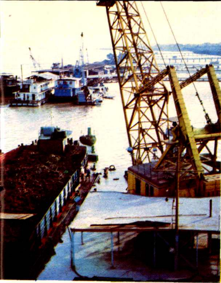
武汉港江岸水陆联运港区 栈桥码头群