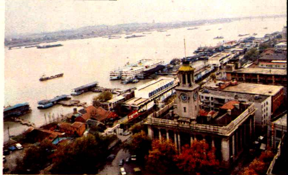
武汉港汉口客货运港区码头