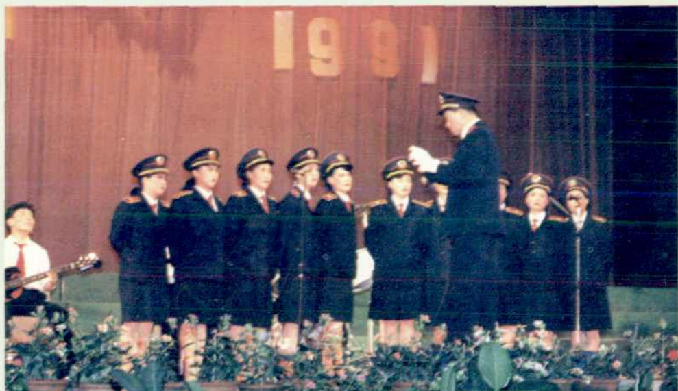
▲感谢群众对市法院工作的鼓励。