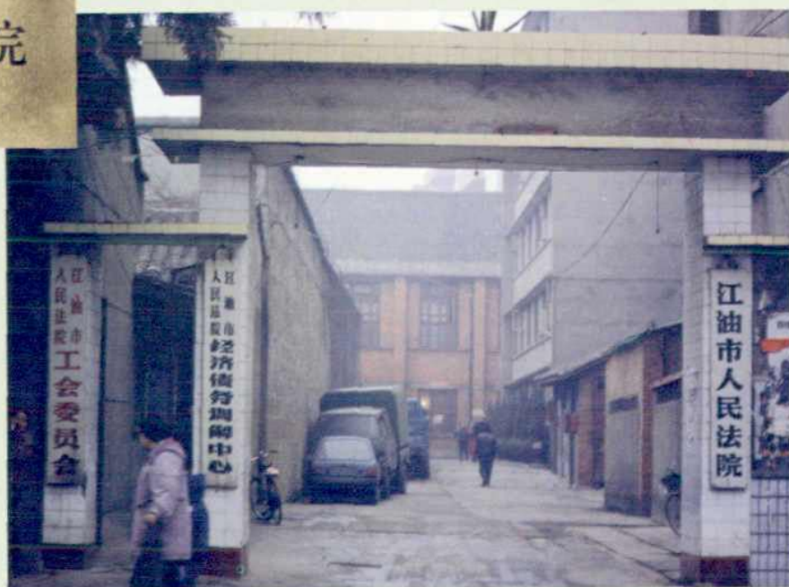
▼ 八九十年代县、市法院办公地点。