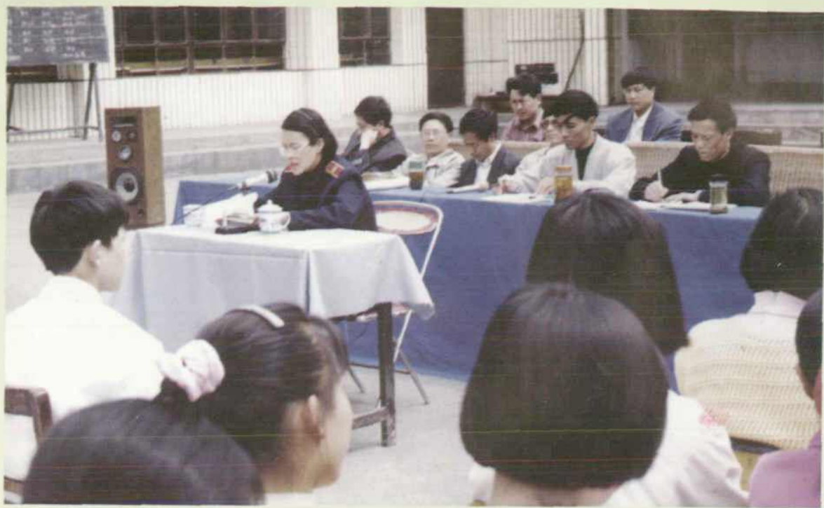
▲ 少年庭庭长在学校向师生宣讲话纪。