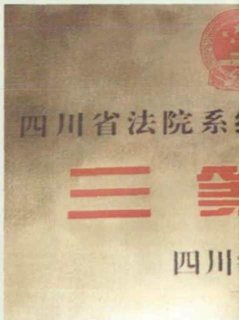
▲ “两庭”建设受到上级表彰。