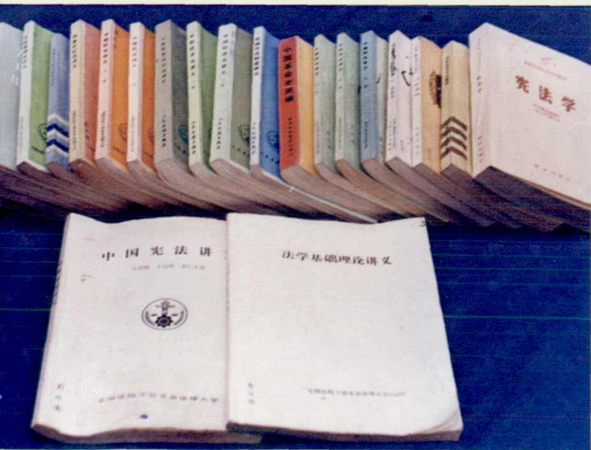
▲ “业大”教学班学员攻读的23册教科书。