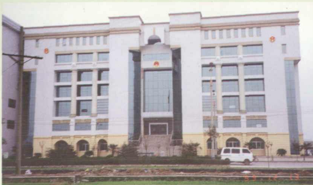
▲ 1999年12月建成的市法院审判法庭和办公大楼。