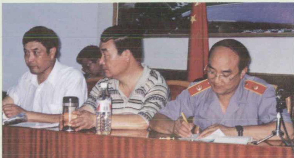
▲ 市法院又一批法官获表彰奖励