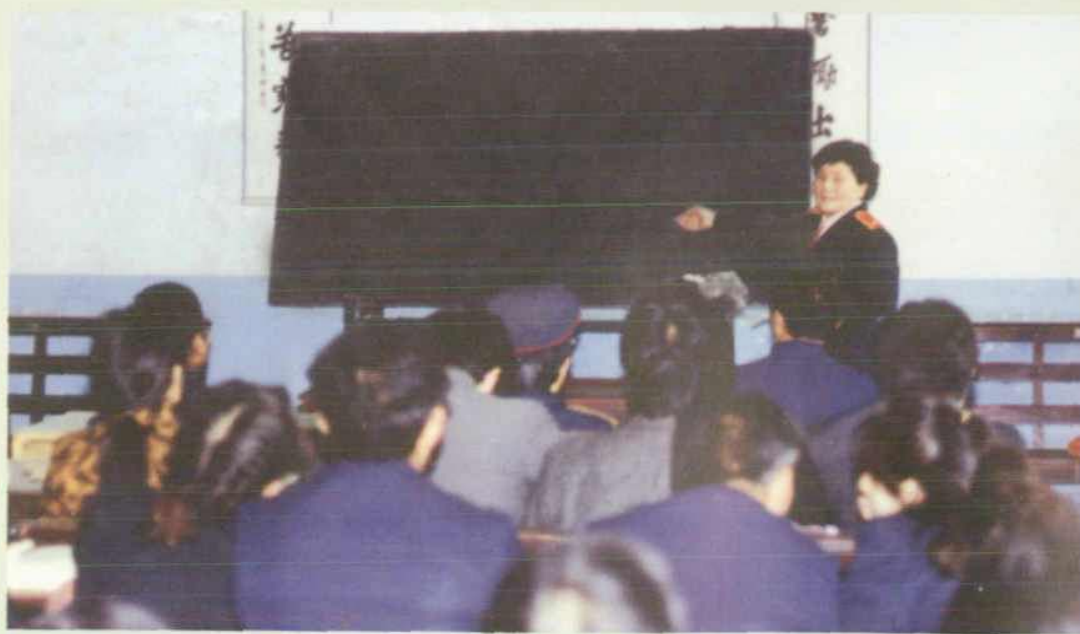
▲ “业大” 教学班老师精心授课。