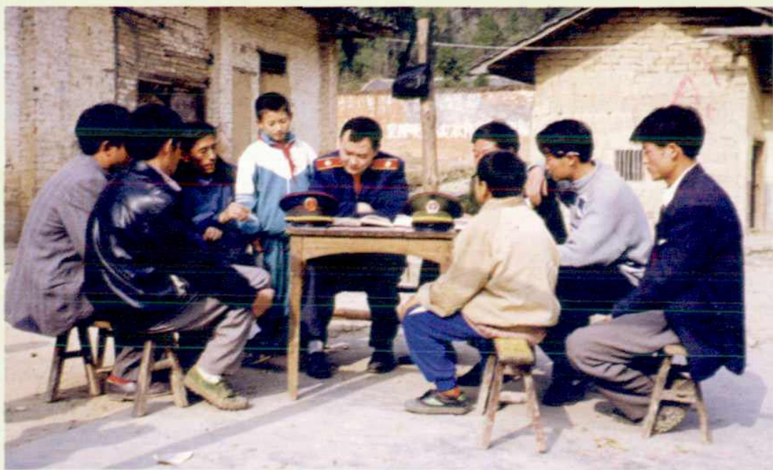
▲ 重华法庭法官深入山村向农民宣讲话纪。