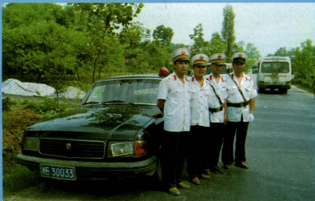
◀ 运政人员整装待发