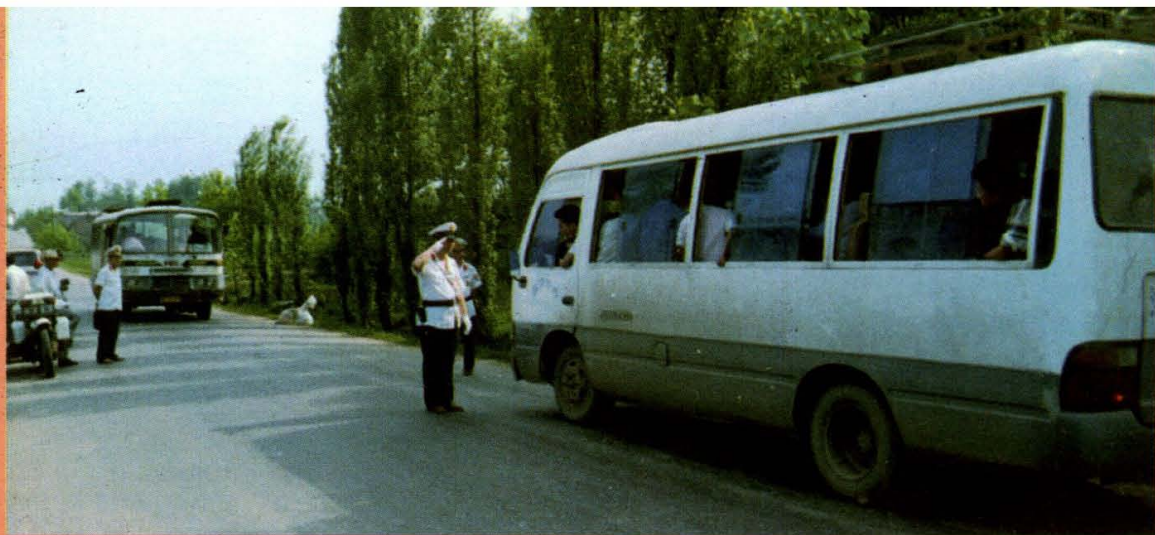
◀ 运政人员上路执勤