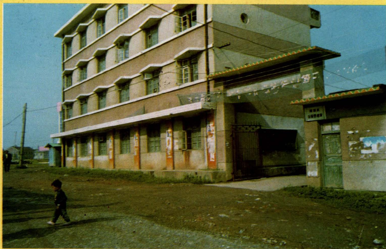
▲隆回县运输管理所