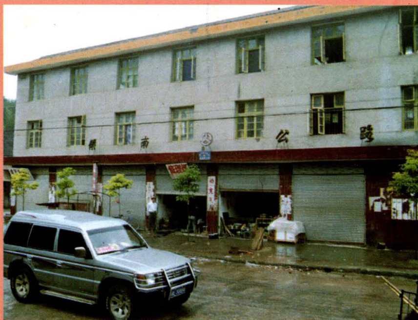
▶ 县公路段金石桥养路工班