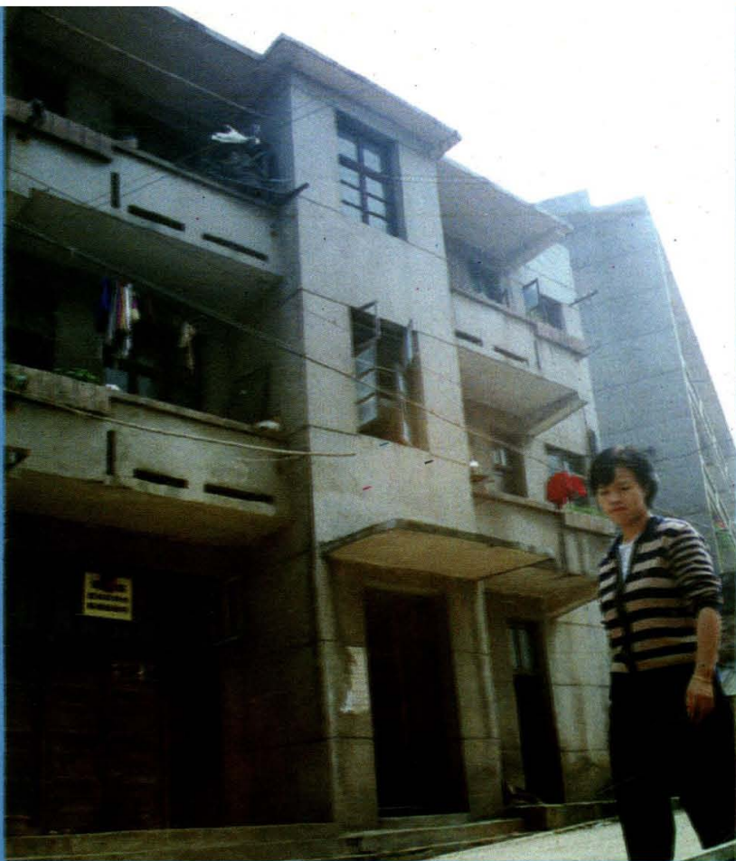
◀ 湖南隆回港航监督、船舶检验所