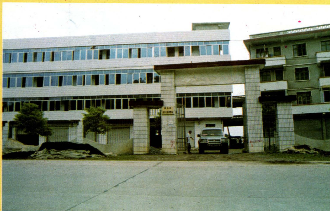
▲隆回县县乡公路管理站