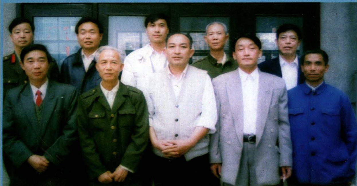
▲隆回县交通志编纂 领导小组部分成员及 编辑人员