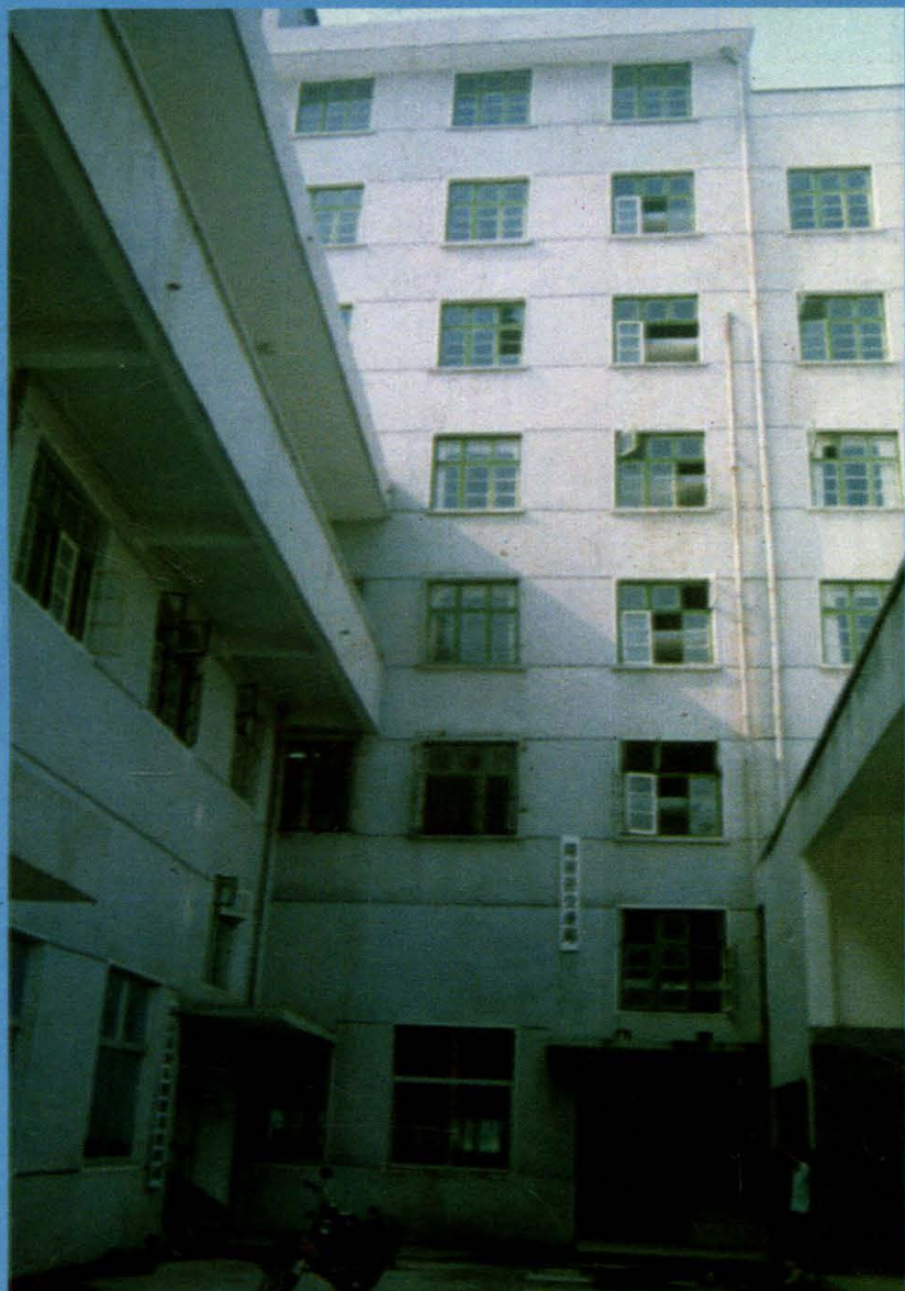
►隆回县交通局办公楼