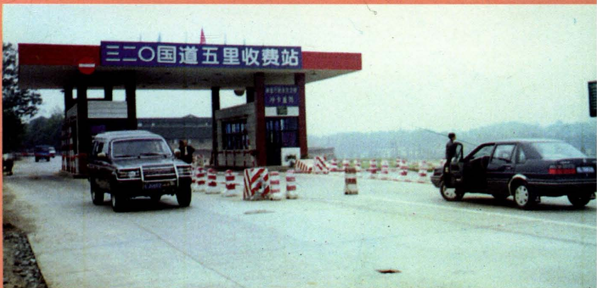
► 320 国道隆回县段五里收费站