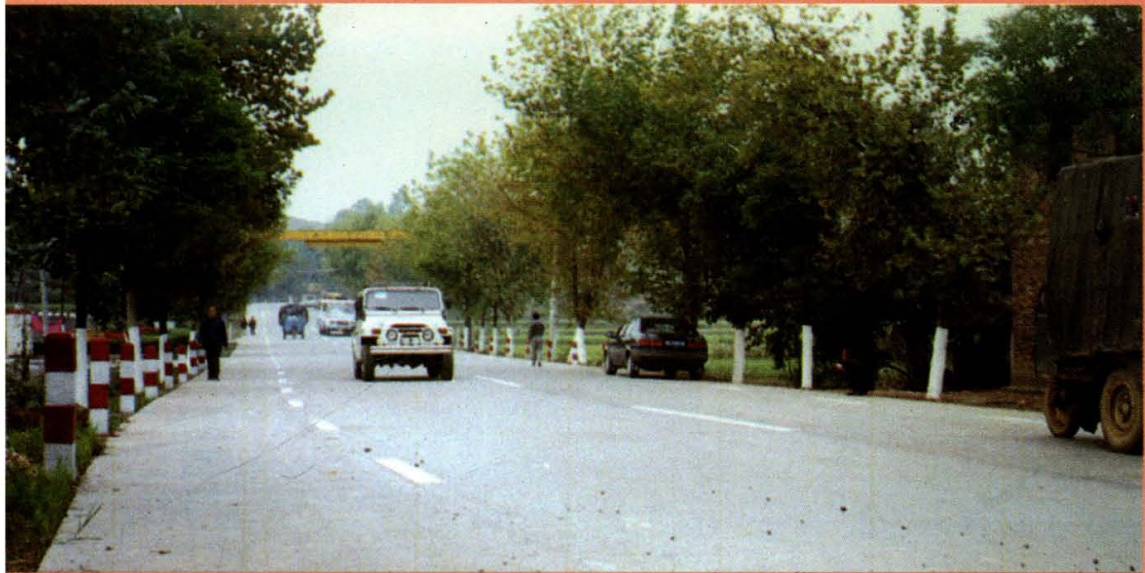
▲ 320 国道隆回段水泥路面一段