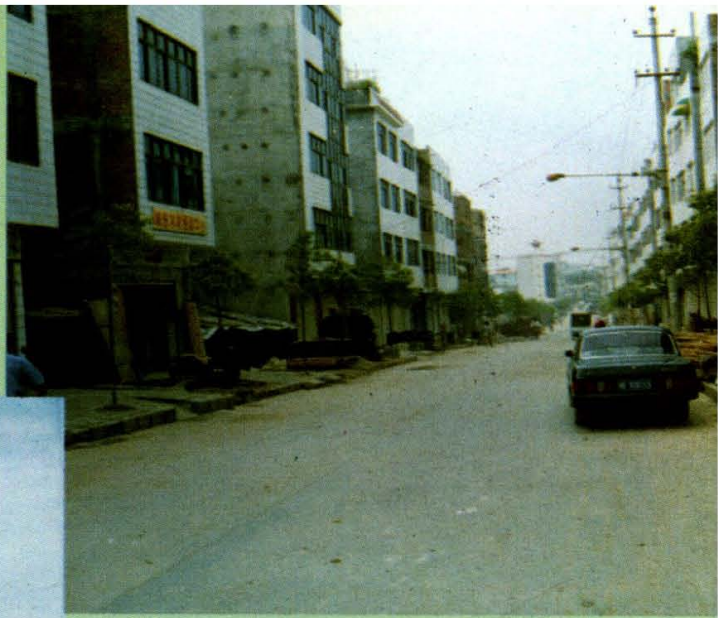
▲90年代兴建的桃花新村街道