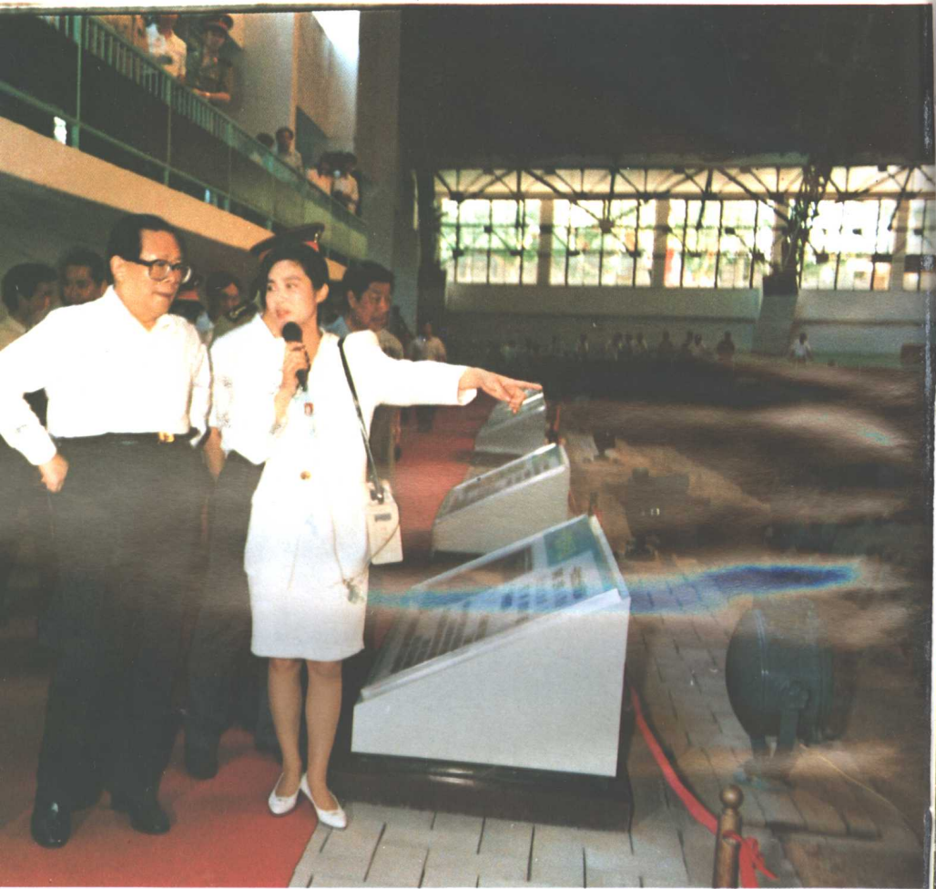
1993年6月12日中共中央总书记江泽民(左)在秦兵马俑馆视察