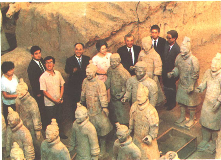
1989年8月29日省长侯宗宾(左四)陪同日本首相竹下登(右三)参观秦兵马俑