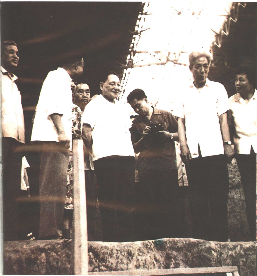
1980年7月1日邓小平同志(左三)视察秦俑一号坑