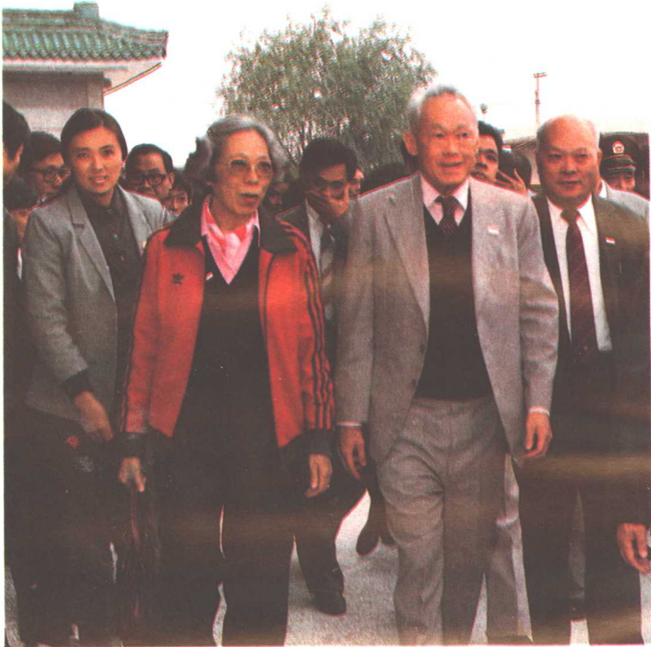
1985年9月17日张斌副省长(右一)陪同新加坡总理李光耀(右二)参观秦兵马俑馆