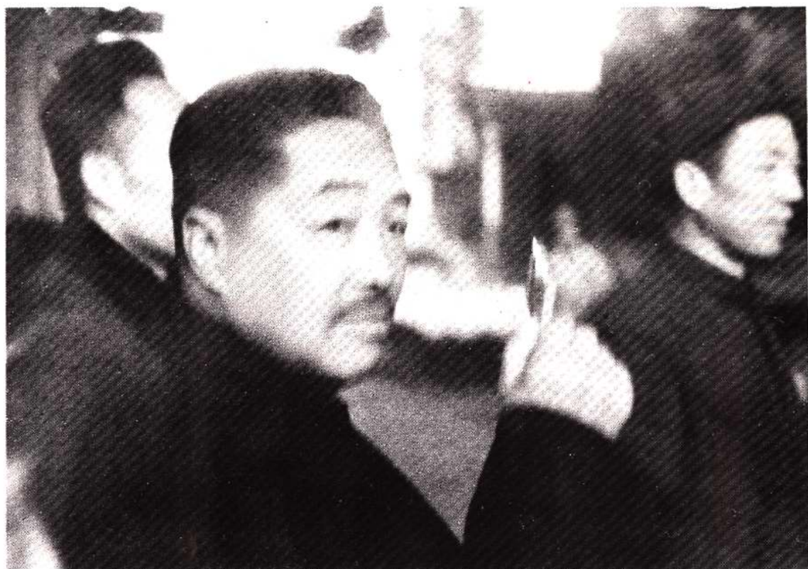
贺龙副总理在炼钢炉旁