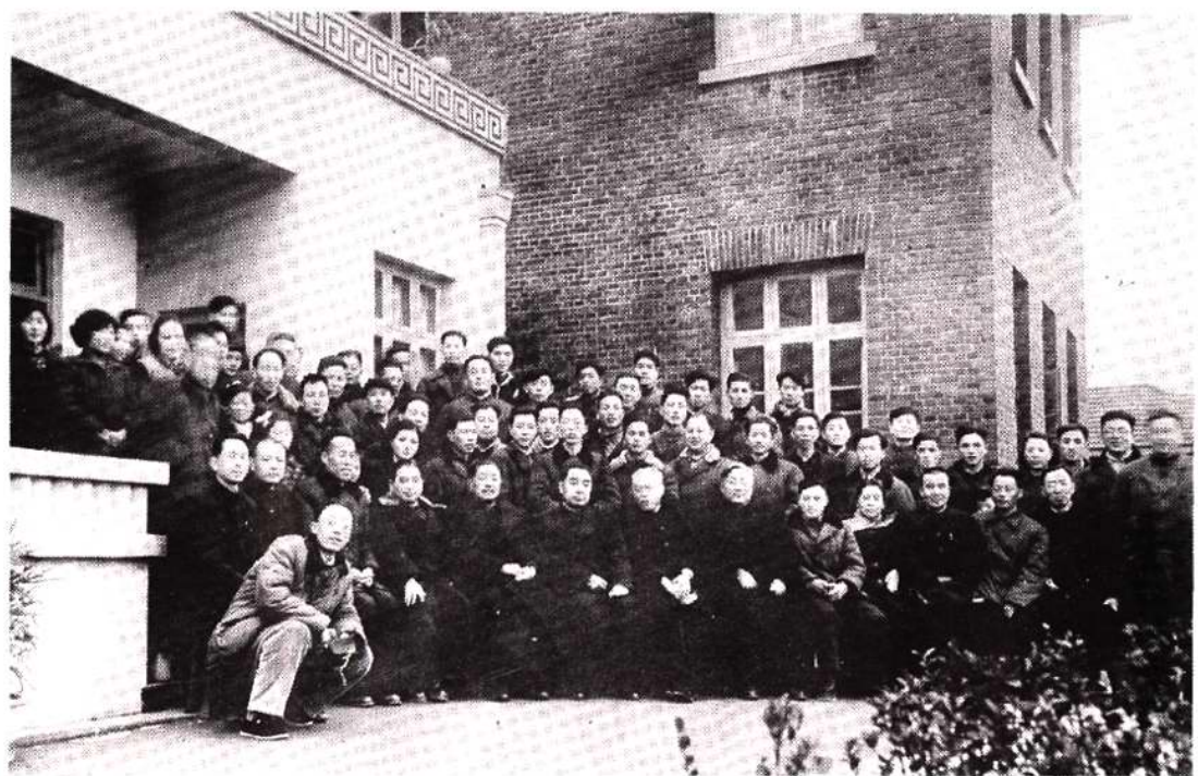
周恩来总理，贺龙副总理、西南局书记李井泉同重钢党政干部合影