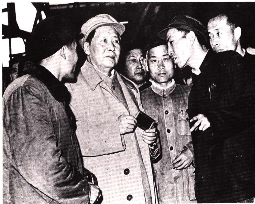
毛泽东主席视察重钢