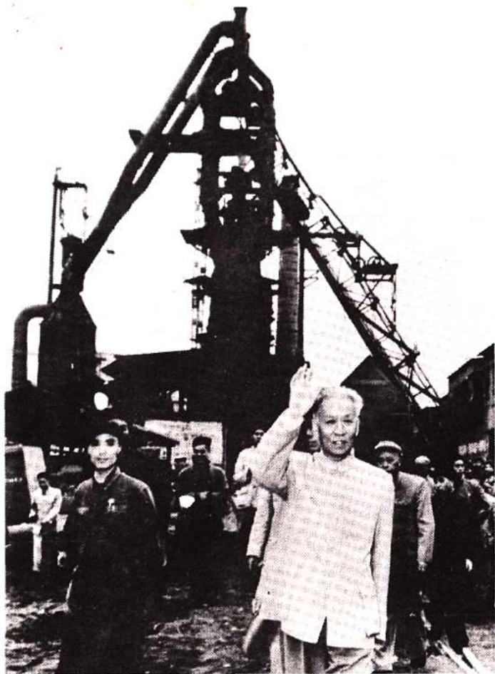
刘少奇主席视察重钢