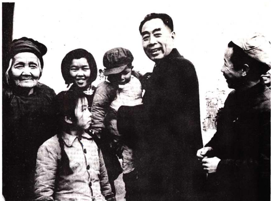
周恩来总理访问工人家庭