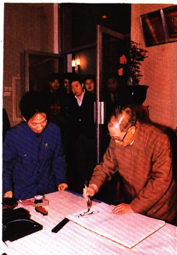
国务委员方毅视察重钢