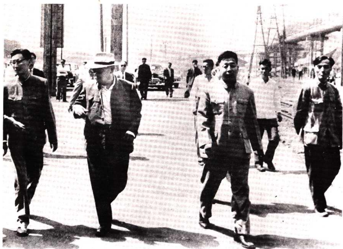
陈毅副总理视察重钢