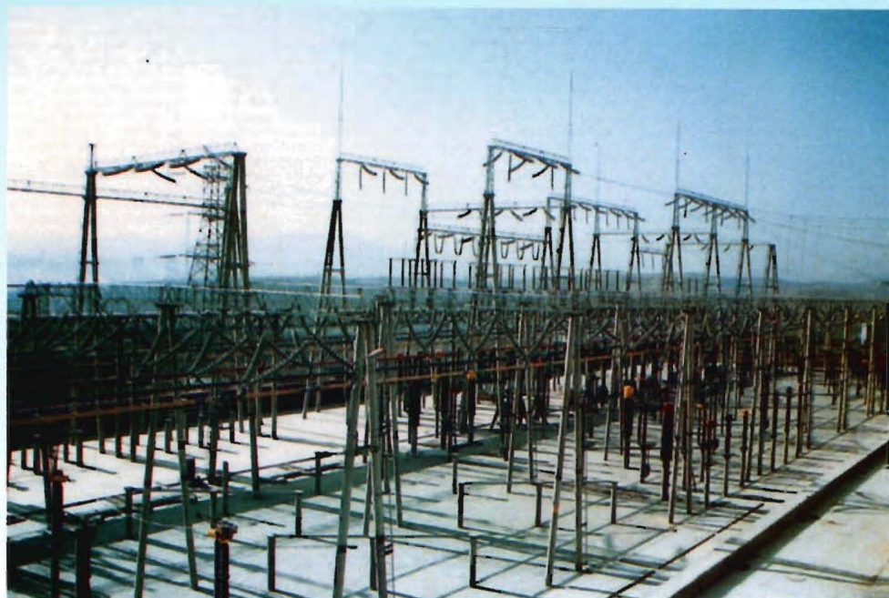
1995年，220千伏红卫变电站落成。