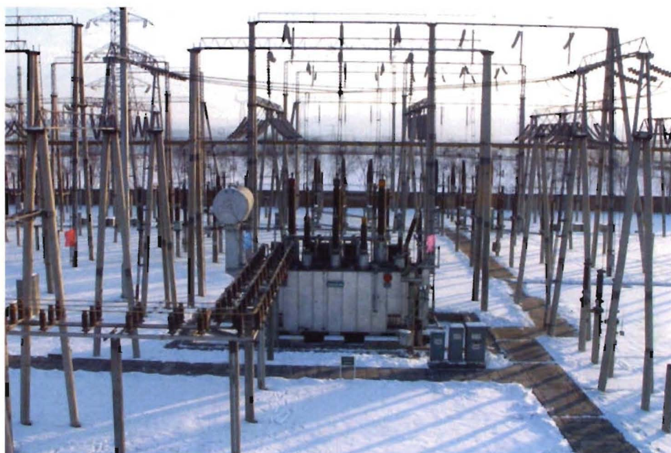
1999年7月1日，220千伏海落湾变电站落成。