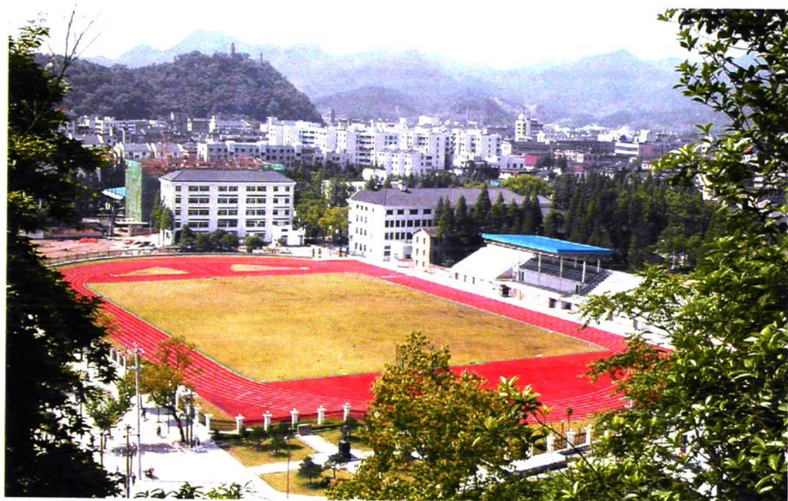
新建标准 400 公尺塑胶跑道之运动场