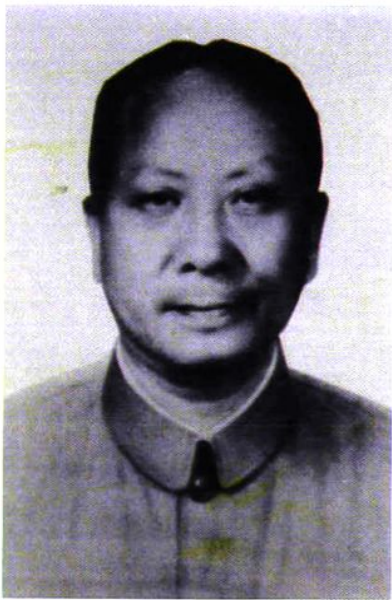
校友、中科院院士朱洗