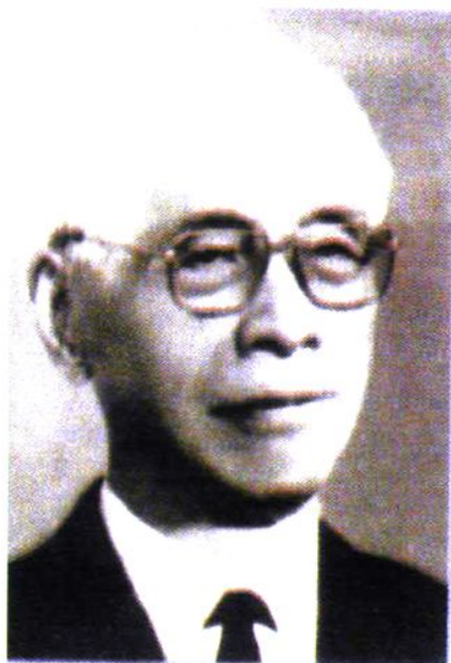
校友、中科院院士、副院长冯德培