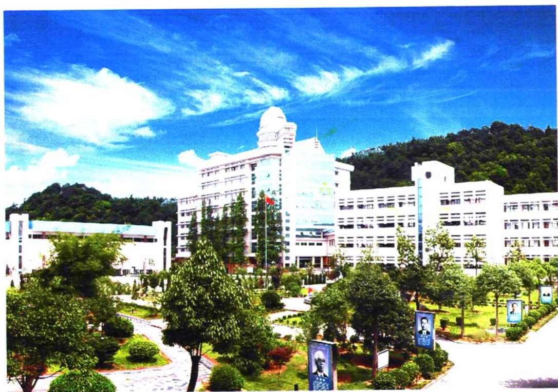
体育馆、科学馆、志山教学楼