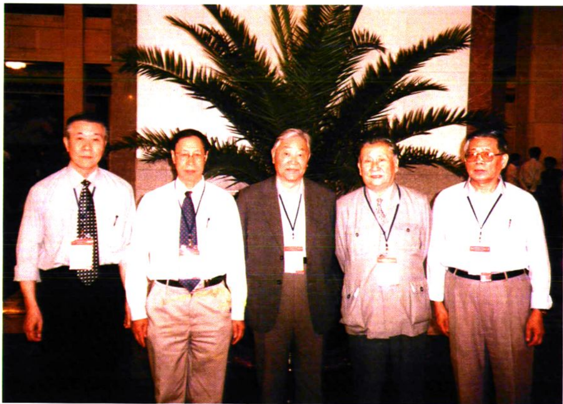
2002年5月，校友、中科院、工程院院士陈洪渊、闻邦椿、池志强、吴全德、徐世浙在北京合影，以贺母校百年校庆