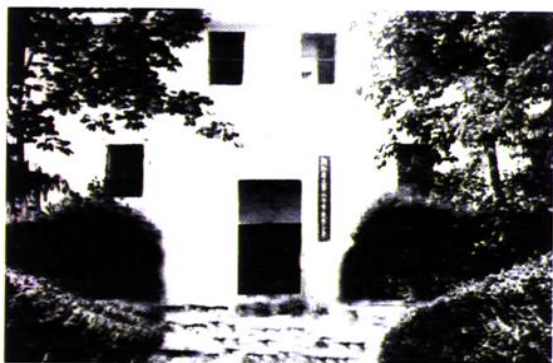
民国初年在磊落岩的省立六中(台中前身)