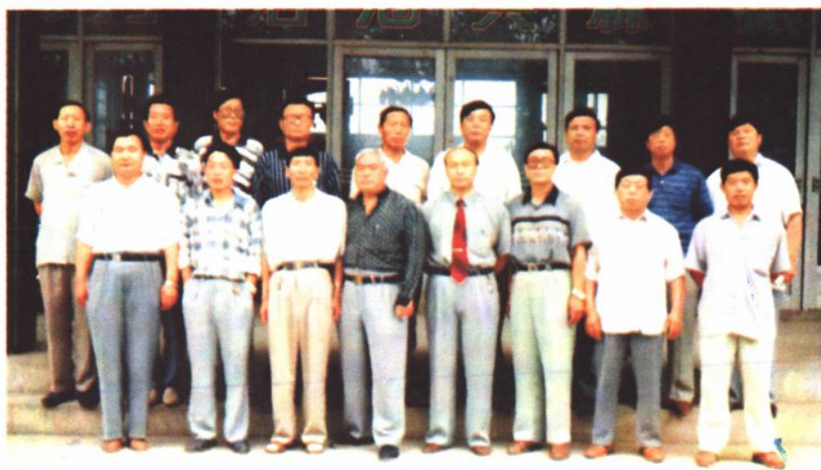
▲迎春林业局《局志》编审委员会成员