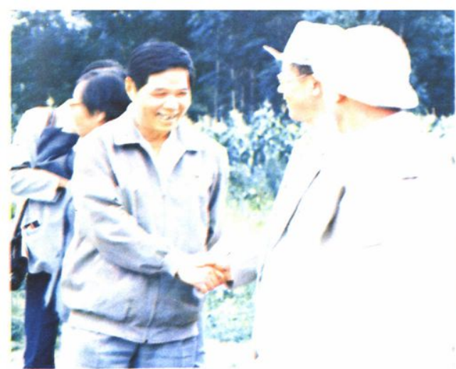
▲1988年7月26日,林业部蔡延松副部长来局视察。