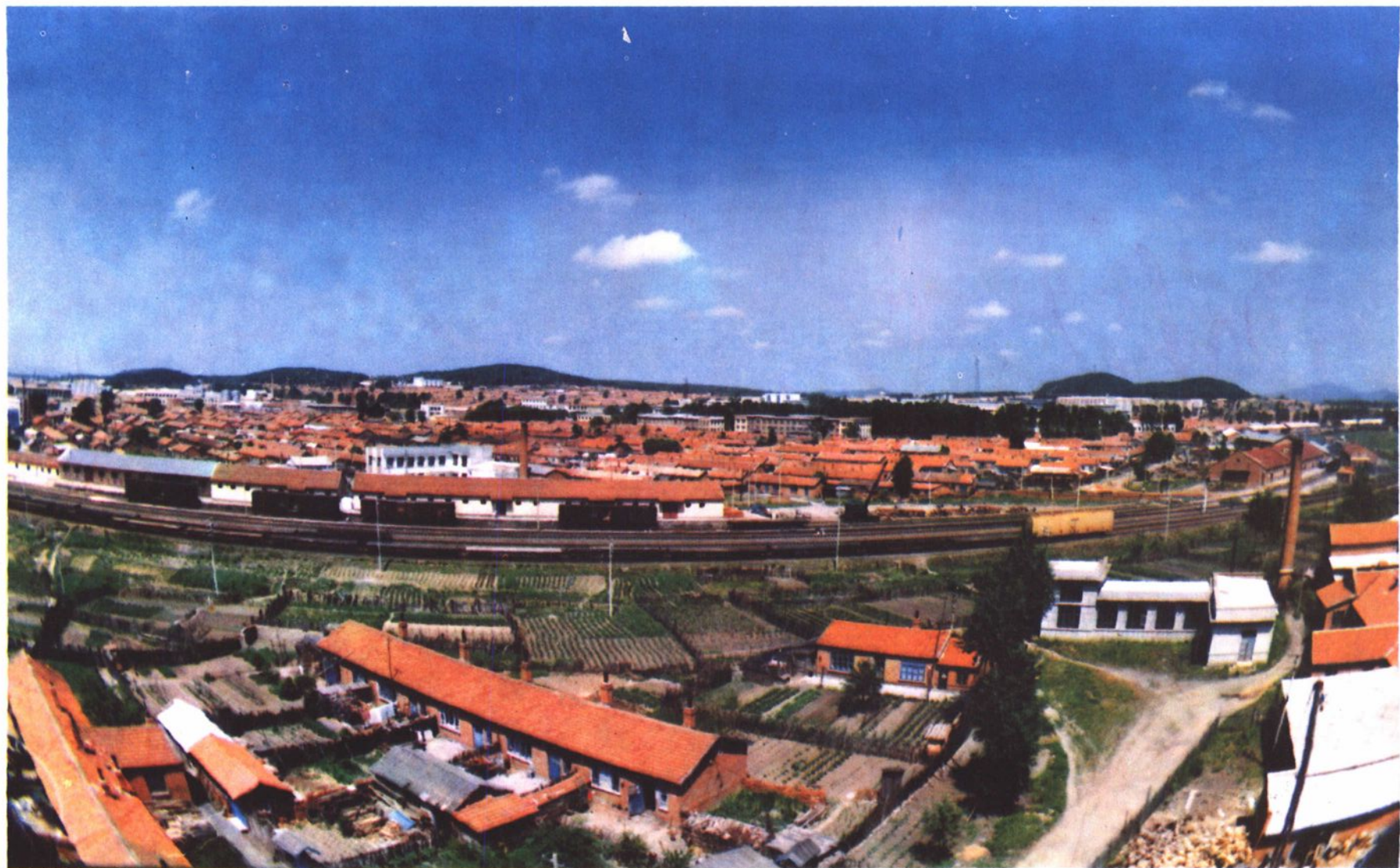
▲迎春林业局局址鸟瞰