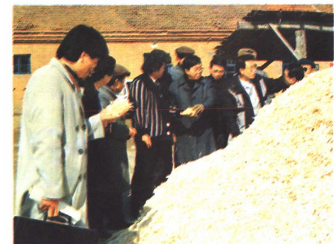
▲1992年,日商来局考察火柴梗生产。