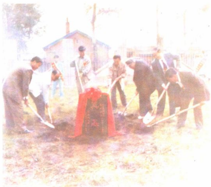
▲造林抚育双百万亩奠基。