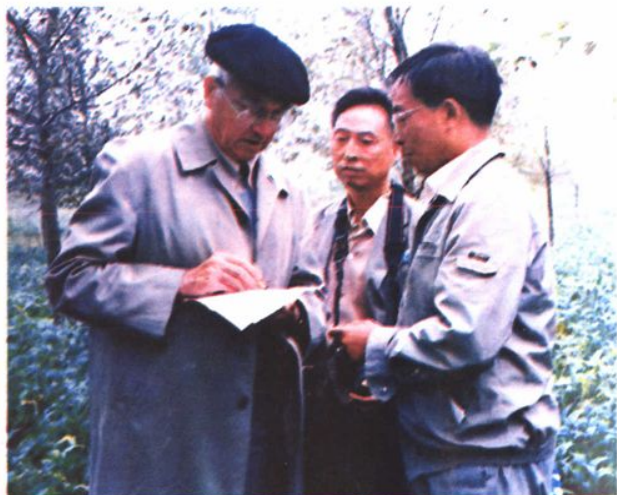
▲1988年国际杨树节18届年会,外国专家来局考察杨树速生丰产林。