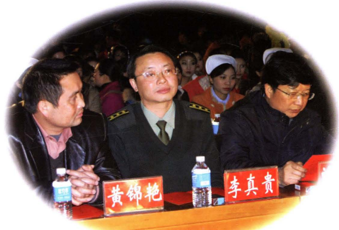
县领导观看医院文艺演出