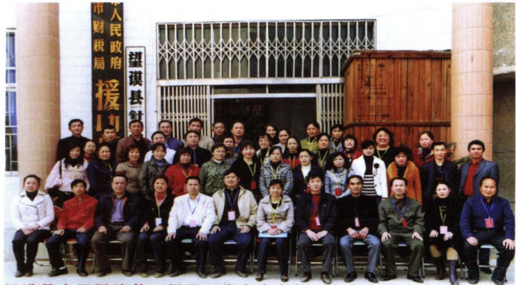
望谟县人民医院第一届职工代表大会第一次会议全体代表合影 2008.3.2