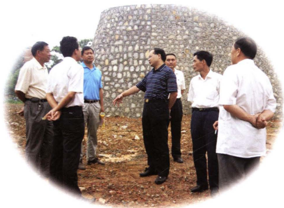
县领导在住院楼建设工地上现场办公