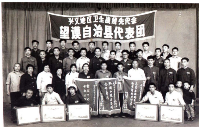
1978年医院在地区先代会上获得锦旗