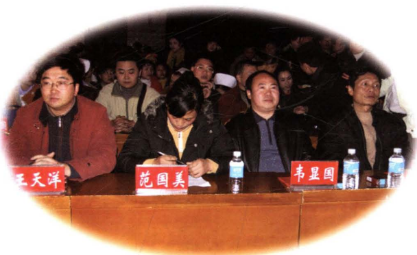
县领导观看医院元旦晚会演出