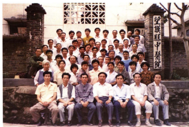
1991年成立中医院，县领导与职工合影