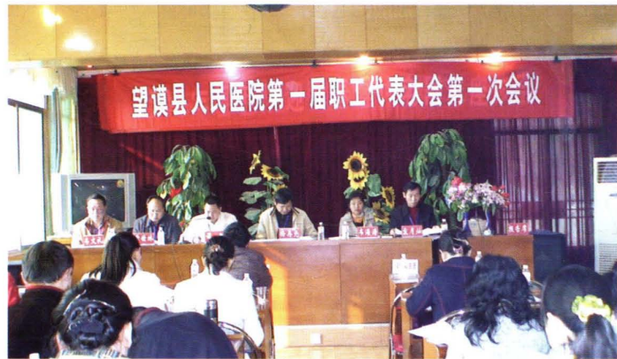
首届职代会会场一角