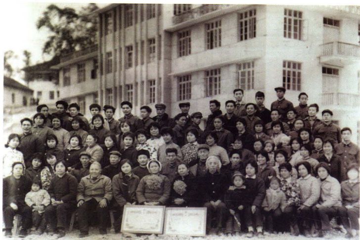
1980年全院职工在刚建成的门诊部大楼前与退休老同志合影