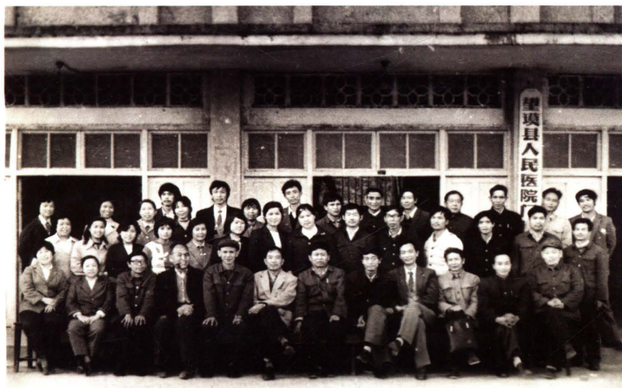
1986年县领导与职代会代表合影