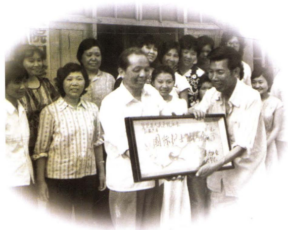
县总工会赠送匾牌