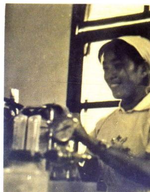
20世纪70年代旧式上氧