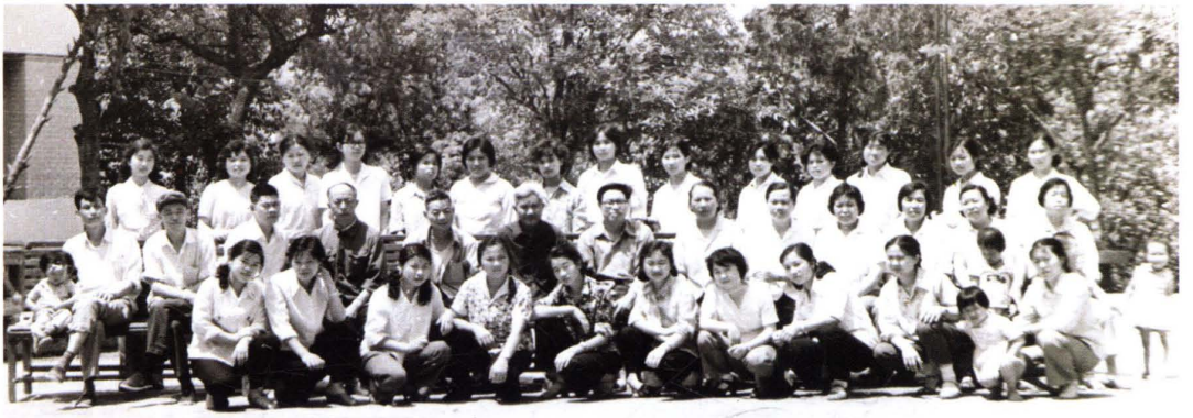
1983年“5.12”护士节县领导与医院护士合影