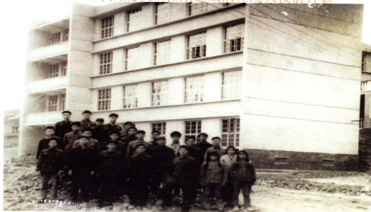
1983年医院职工在刚建成的住院大楼前合影