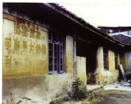
20世纪60年代医院门诊部