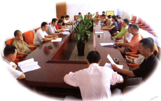
中心学习组集中学习