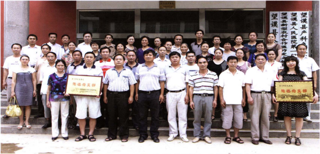
2010年医院党政班子成员与全体党员合影