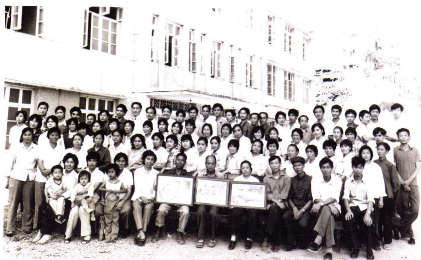
1985年全院职工在门诊部大楼前与退休老同志合影