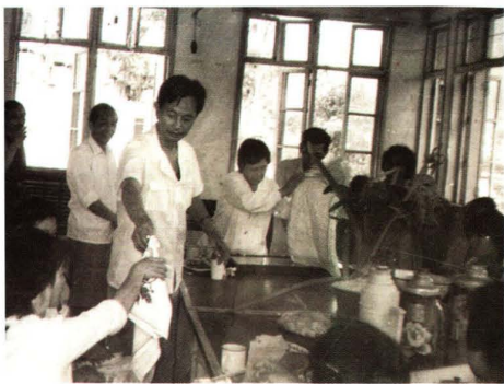
5.12 "护士节"医院领导颁发纪念品