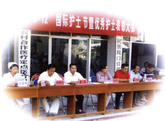
2007年县领导出席护士表彰大会