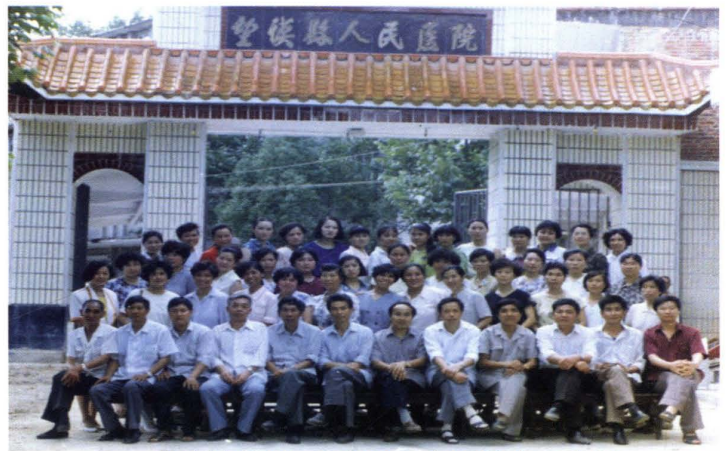
1993年县领导与医院职工在医院大门合影