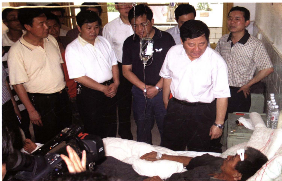
2006年9月中共贵州省委副书记王富玉同志到医院病房看望病人