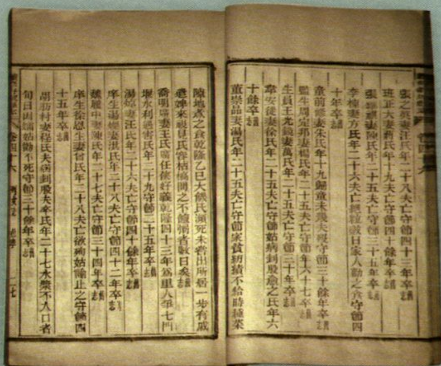
《续修舒城县志》书影之二