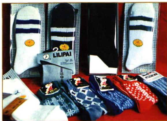
都匀袜厂系列产品