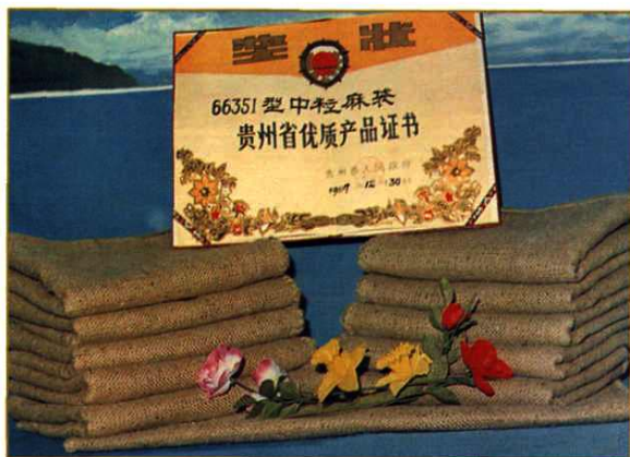
都匀黄麻纺织厂生产的优质麻袋