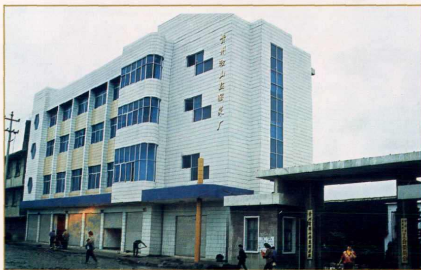
独山盐酸菜厂厂区一角