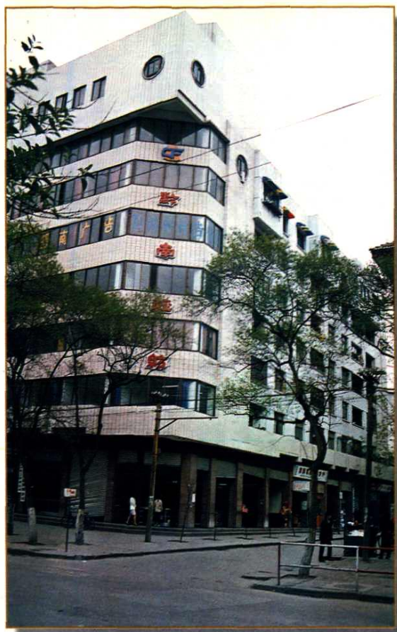
黔南州轻纺工业局综合大楼