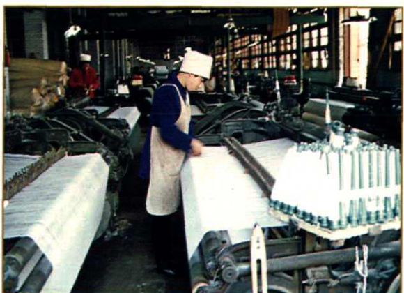
都匀织布厂生产车间一角