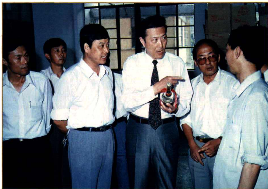
省长陈士能、州长兰天权、州委副书记肖永安等领导视察都匀酒厂