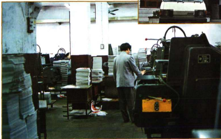
贵定印刷厂生产车间一角