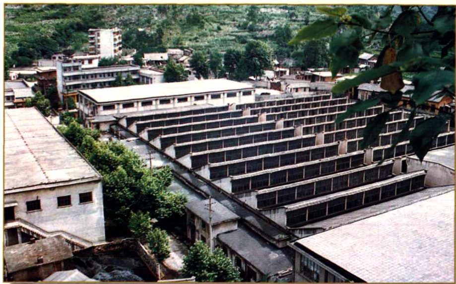
都匀黄麻纺织厂厂区一角