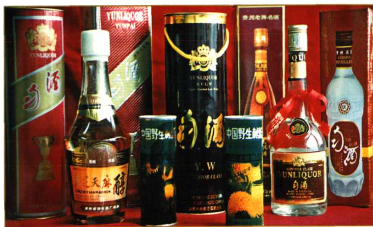
都匀酒厂系列产品