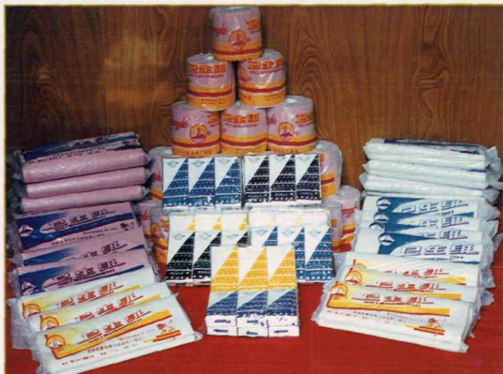
都匀匀阳造纸厂生产的系列卫生用纸