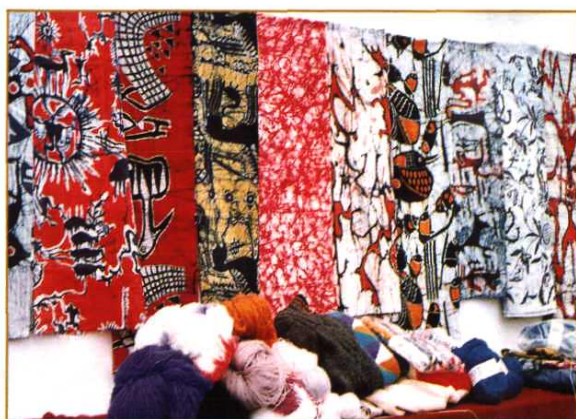
都匀毛麻纺织印染总厂生产的系列苕麻印花布