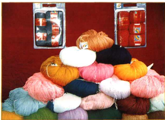
都匀毛麻纺织印染总厂生产的腈纶绒线