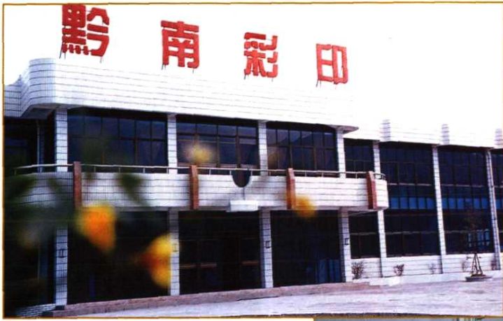
黔南彩色印刷有限公司综合楼