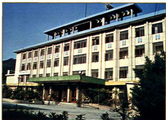
都匀毛纺织厂综合办公大楼