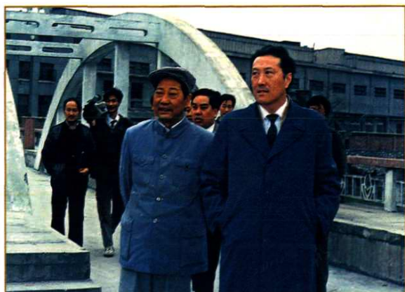
省长陈士能视察都匀毛麻纺织印染总厂