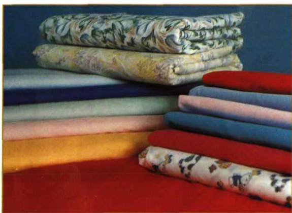
都匀毛麻纺织印染总厂生产的系列印染布