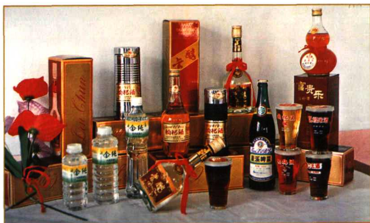
贵定酒厂系列产品