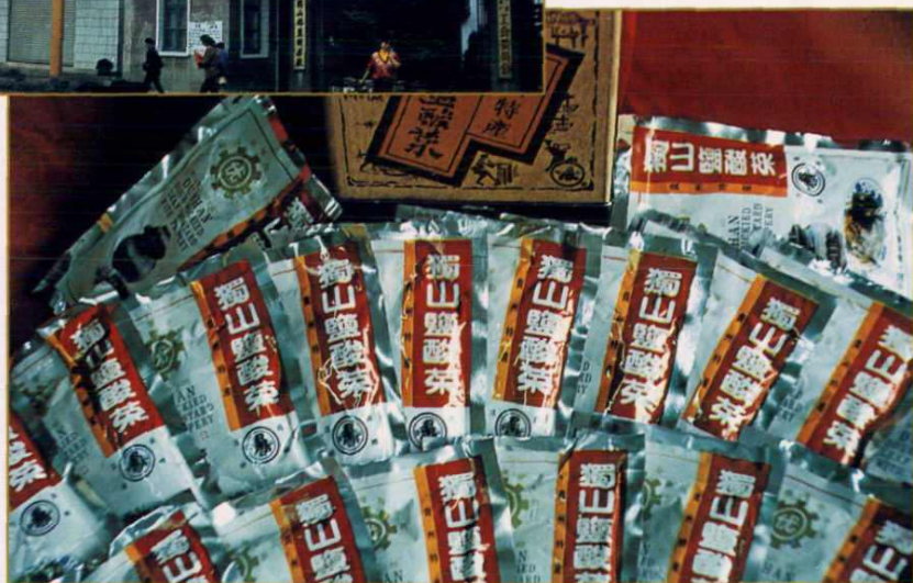
轻工部优质产品——独山盐酸菜