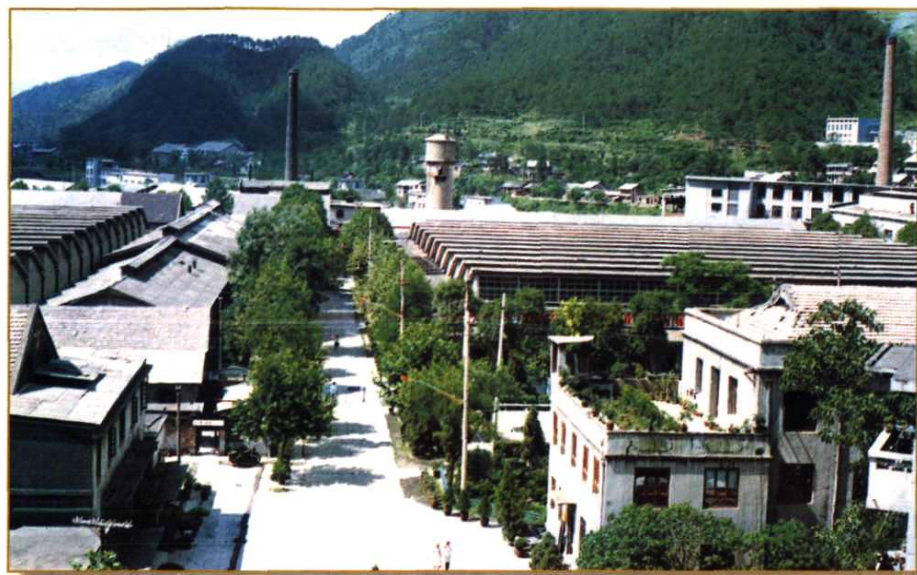
都匀毛麻纺织印染总厂厂区一角