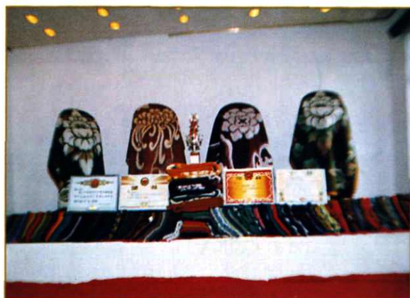
都匀毛纺织厂系列产品