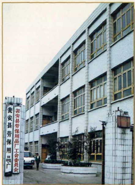
瓮安县劳保用品厂厂区一角