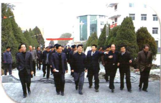
自治区党委常委、银川市委书记崔波到我校视察