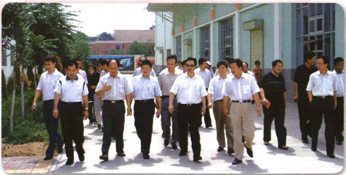
自治区主席马启智到我校调研