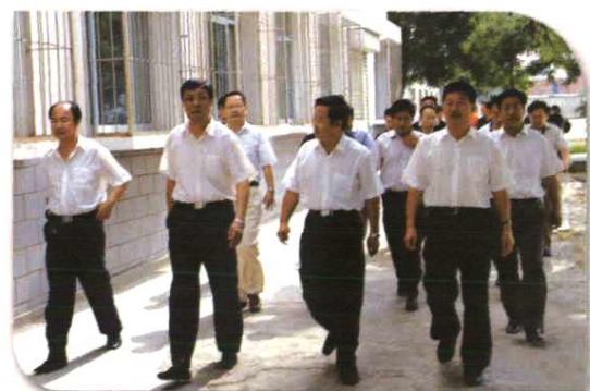
银川市市长白雪山及县领导到我校视察调研