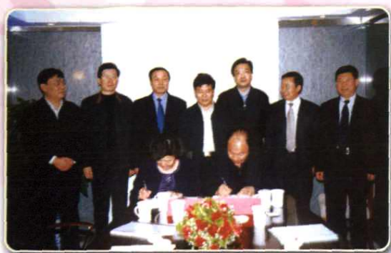
2006年4月12日“北京 宁夏友谊中学” 签字仪式在北京举行