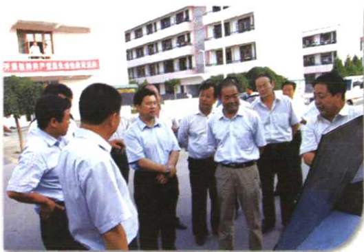
自治区党委常委、自治区副主席王正伟视察调研