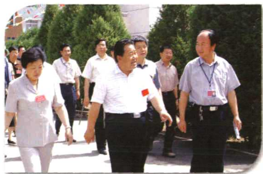
自治区副主席刘仲、政协副主席金晓昀到我校视察