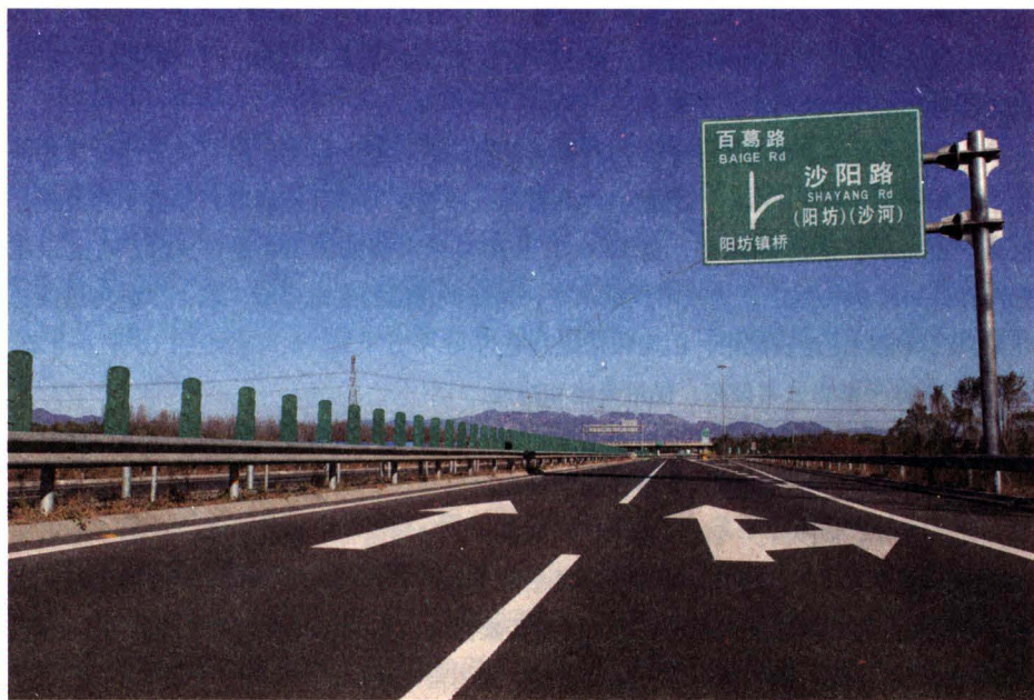
北京市六环高速公路阳坊段

阳坊镇是北京市昌平区的建制镇。位于昌平城西南 20 千米，北京城德胜门西北 31 千米。镇党委、政府驻西贯市村，地理坐标为东经 116 度 07 分 52 秒，北纬 40 度 08 分 13 秒。镇区东邻海淀区上庄镇，南与海淀区苏家坨镇接壤，西靠流村镇，北接马池口镇。镇域东西长 8 千米，南北宽 6.5 千米，面积 40.55 平方千米。西部山地占镇域总面积近三分之一。下辖 10 个行政村、1 个社区，其中西贯市村为京北地区较大的回民聚居村，前白虎涧、后白虎涧 2 村临山而居，前白虎涧所属自然村二道河村坐落山间，其余阳坊、西贯市、东贯市、西马坊、四家庄、史家桥、八口、辛庄等 8 村分落于平原地带。京密引水渠依东北—西南方向斜贯镇域东南部。镇内有驻军单位 11 家，中央、市属单位 2 家，各种经济成分企业百余家，教育、卫生、金融、商贸、电信、邮政等公共服务机构齐全。2012 年末，乡镇户籍人口 15769 人，其中农业人口 9183 人；辖区常住人口 22417 人，其中外来人口 6593 人。沙（河）阳（坊）路、温（泉）南（口）路、颐（和园）阳（坊）路和沙河三家店铁路交汇境内，六环高速公路掠域而过并设有沙阳路出口。642 路、887 路、昌 20 路、昌 57 路公交均途经本地。