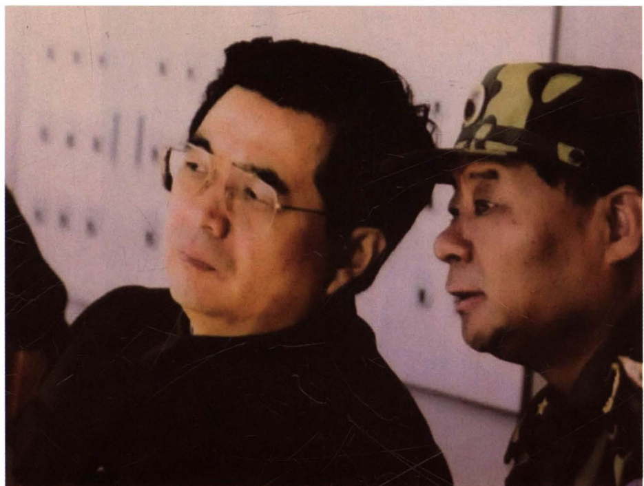
2000年10月13日，国家副主席、中央军委副主席胡锦涛由总参兵种部副部长张宝书陪同，在阳坊靶场观看全军科技练兵成果交流活动汇报演示。