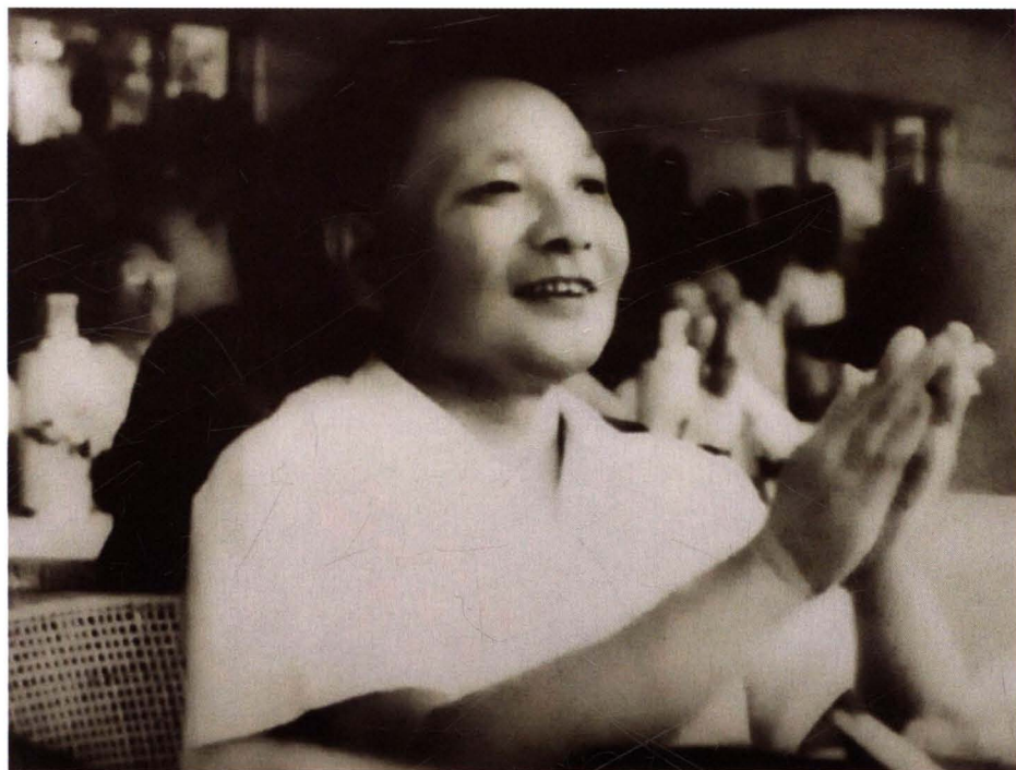
1964年6月16日，邓小平到阳坊靶场观看大比武汇报表演。