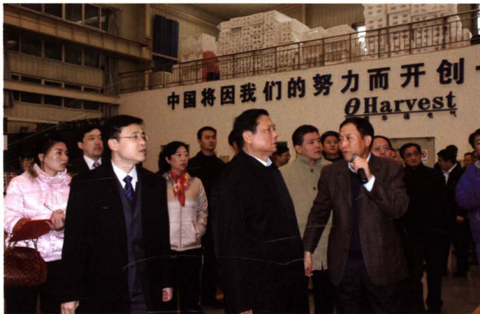
2009年11月12日市委书记刘洪到北京利德华福电气技术有限公司视察。