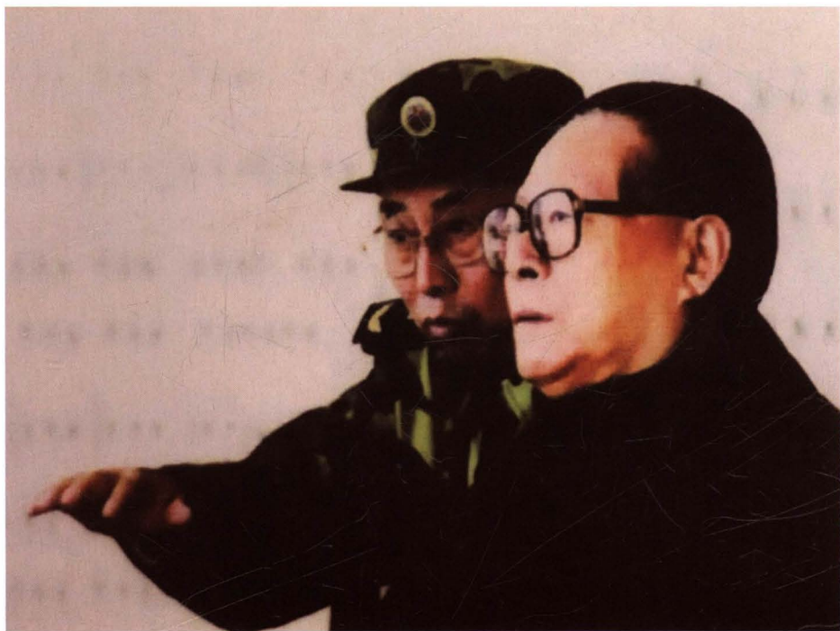
2000年10月13日，中共中央总书记、国家主席、中央军委主席江泽民由总参兵种部部长战永盛陪同在阳坊靶场观看全军科技练兵成果交流活动汇报演示。