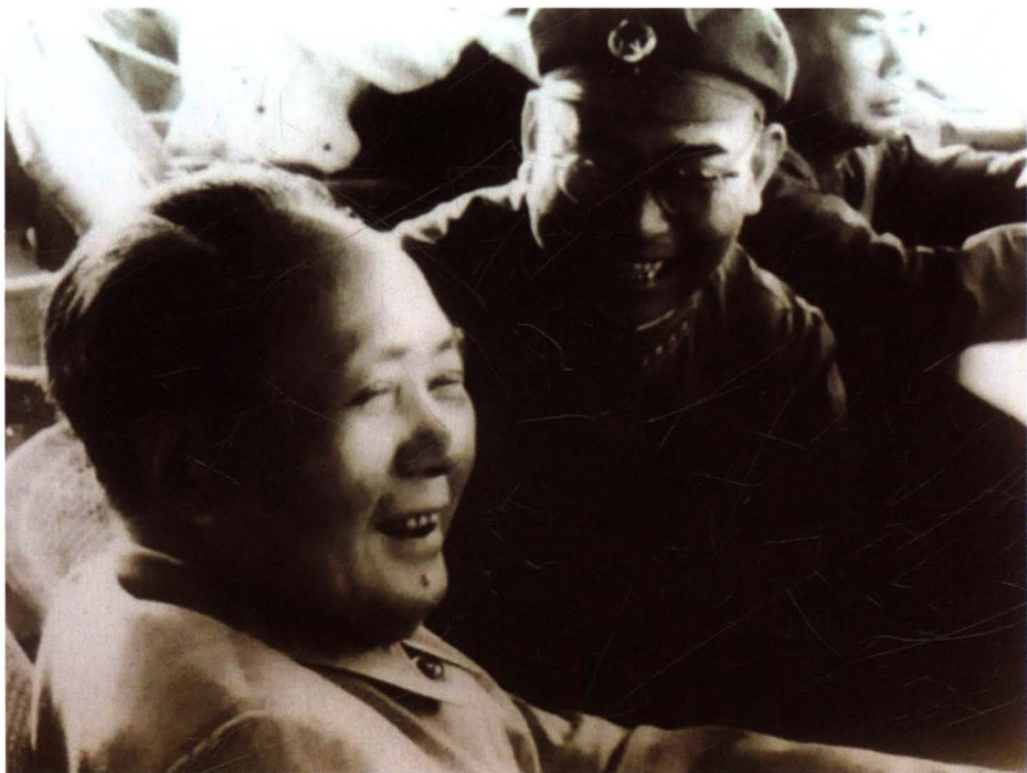
1964年6月16日，毛泽东主席在阳坊靶场观看由北京军区装甲兵为中央首长组织的坦克分队实弹射击汇报表演。图为毛泽东主席和军委装甲兵司令员许光达在观看表演时亲切交谈。