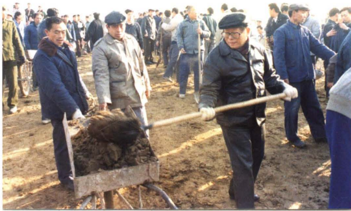
1990年12月3日，中共中央总书记、国家主席江泽民在昌平温榆河治理工地与阳坊群众一起劳动。