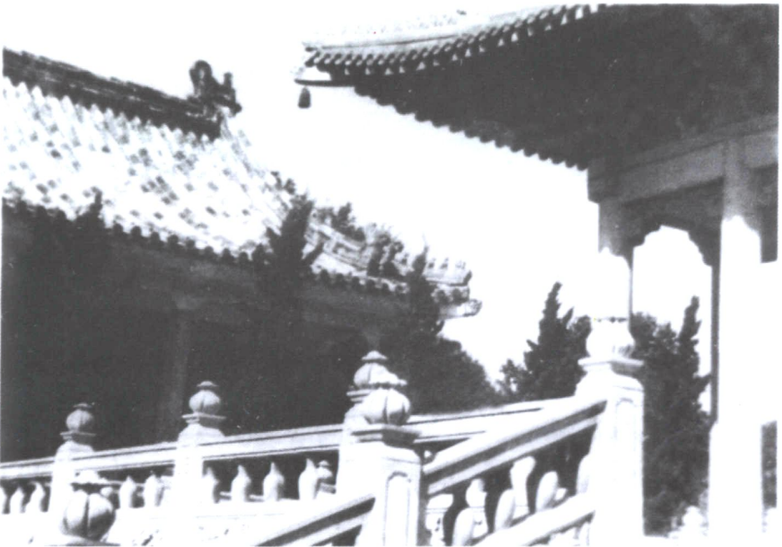
即墨黃氏修建的嶗山華嚴寺