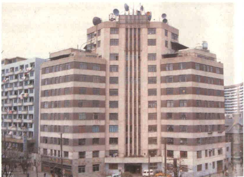
江宁大楼 京西大楼