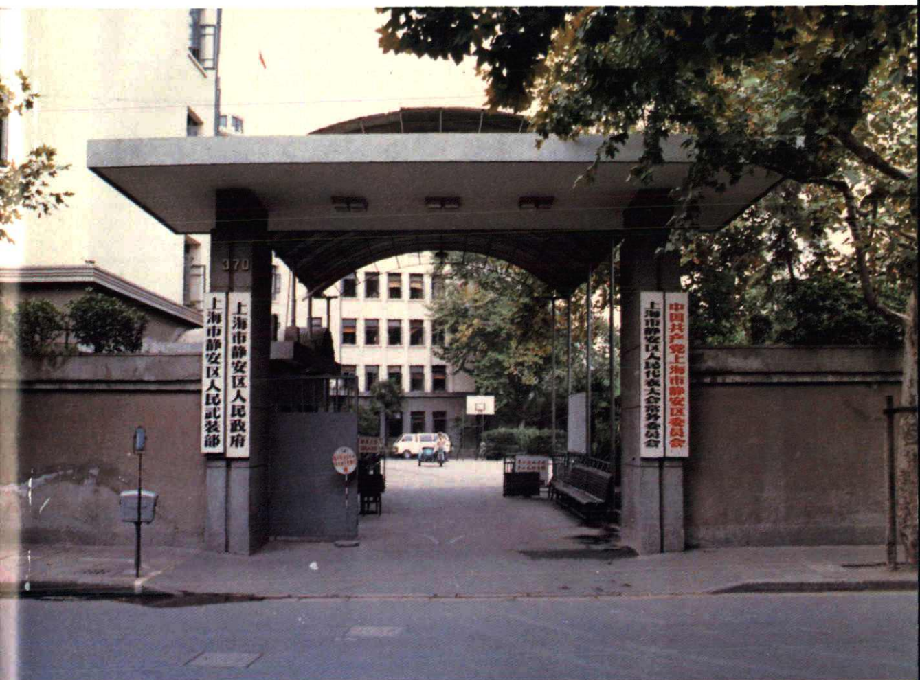
静安区人民政府大门