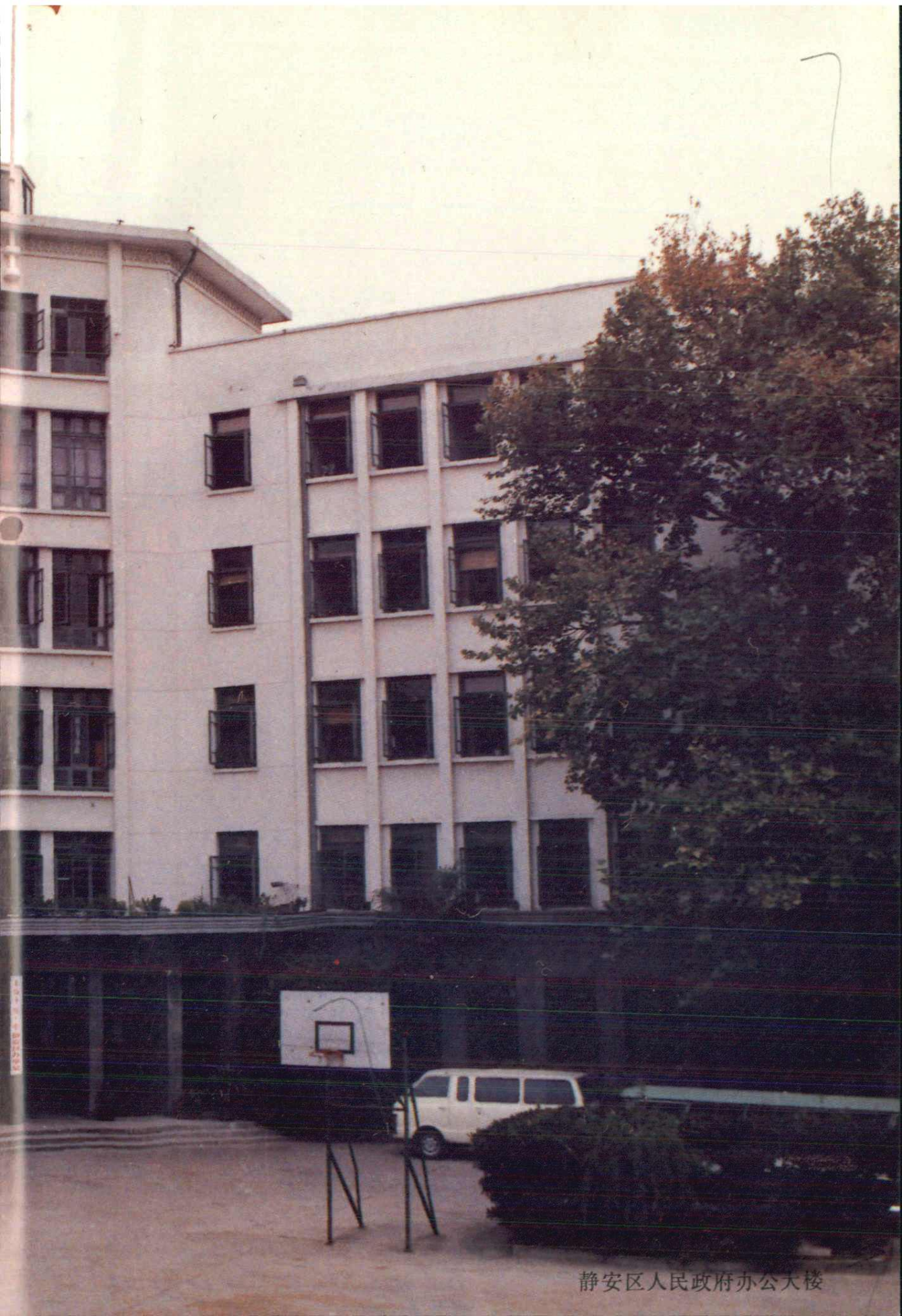
静安区人民政府办公大楼