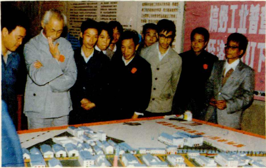
1984年我厂在全国第二次工业普查常州试点工作中获“金杯奖”。图为国务院工普领导小组组长许刚（左二）等来厂参观“工普成果展览”。