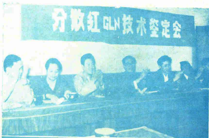
◀ 新产品分散红 GLN 技术鉴定会。