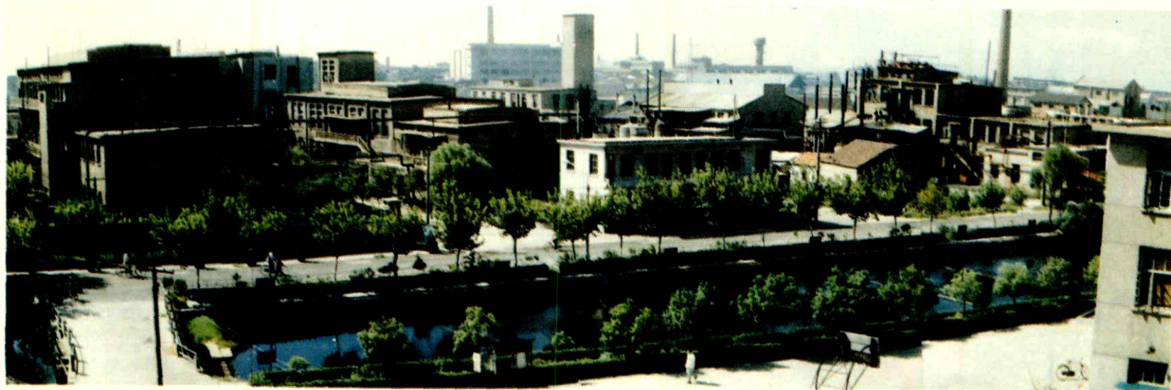
旧貌变新颜—工厂全景