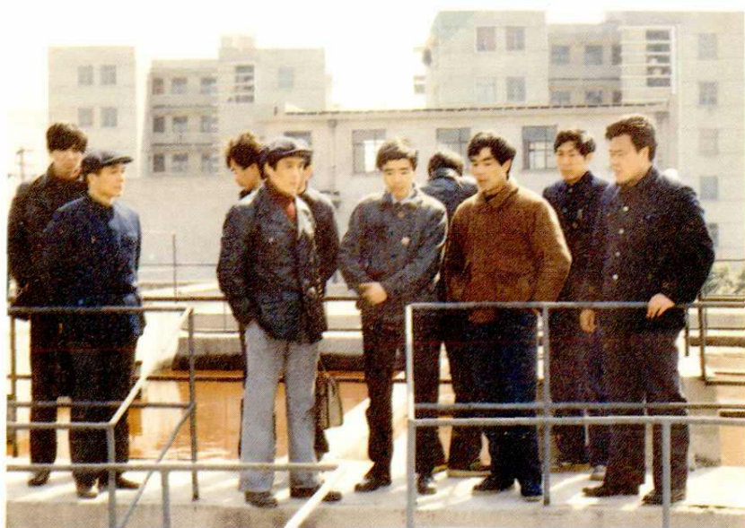
江苏省染料行业厂长会议代表来厂参观三废治理