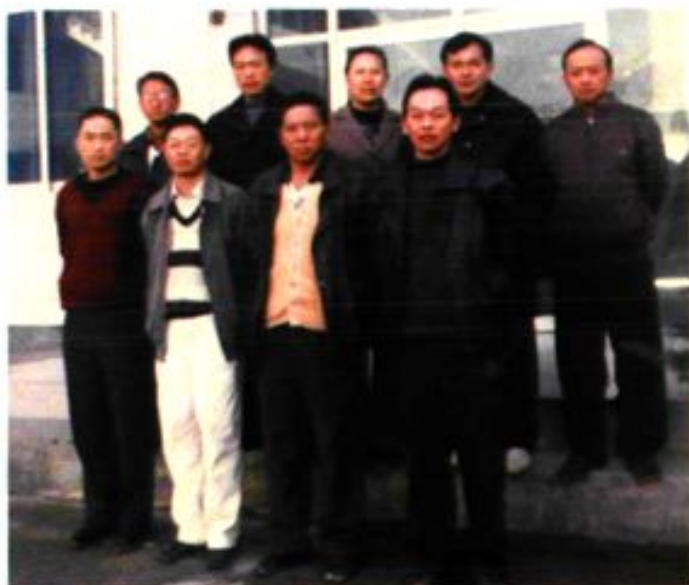
乡党政四班子领导