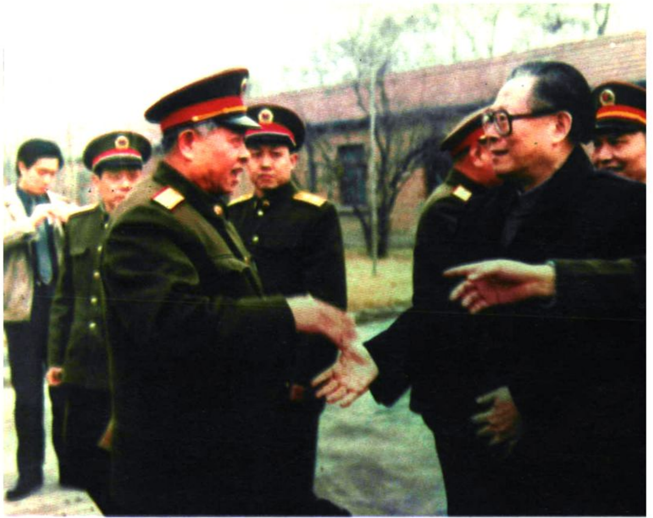
江泽民主席接见梁国栋少将