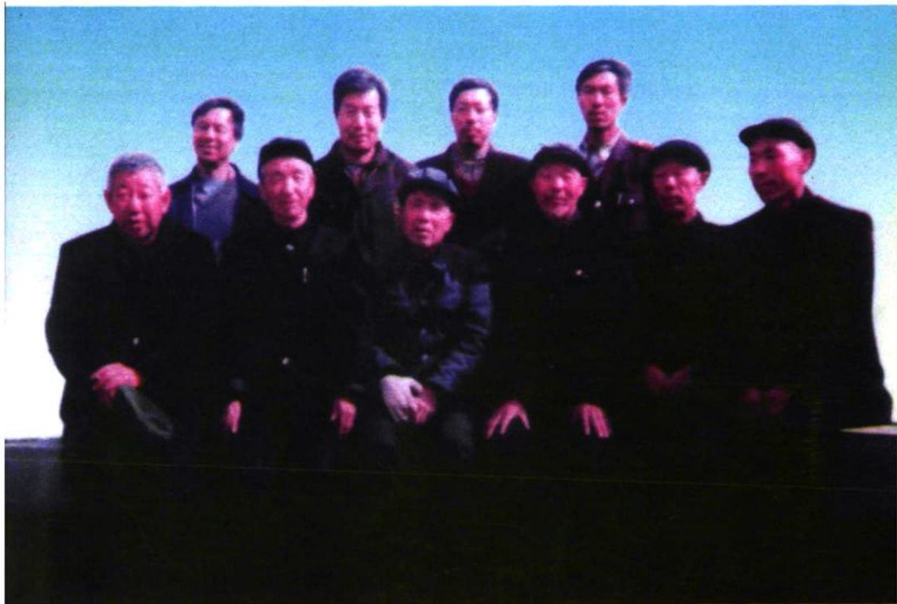
蔡家坡村志编写组全体人员合影 二〇〇一年二月