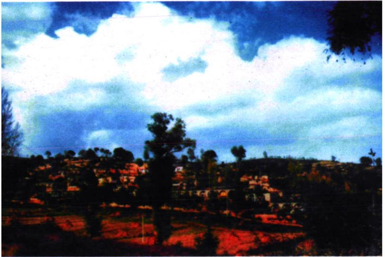
蔡家坡村全景（旧村）