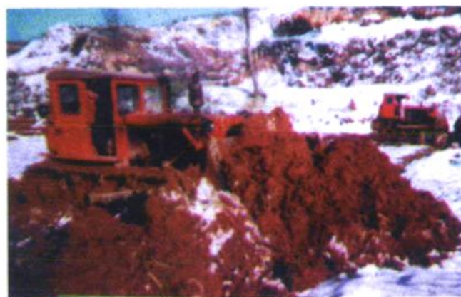
农田基建工地一角