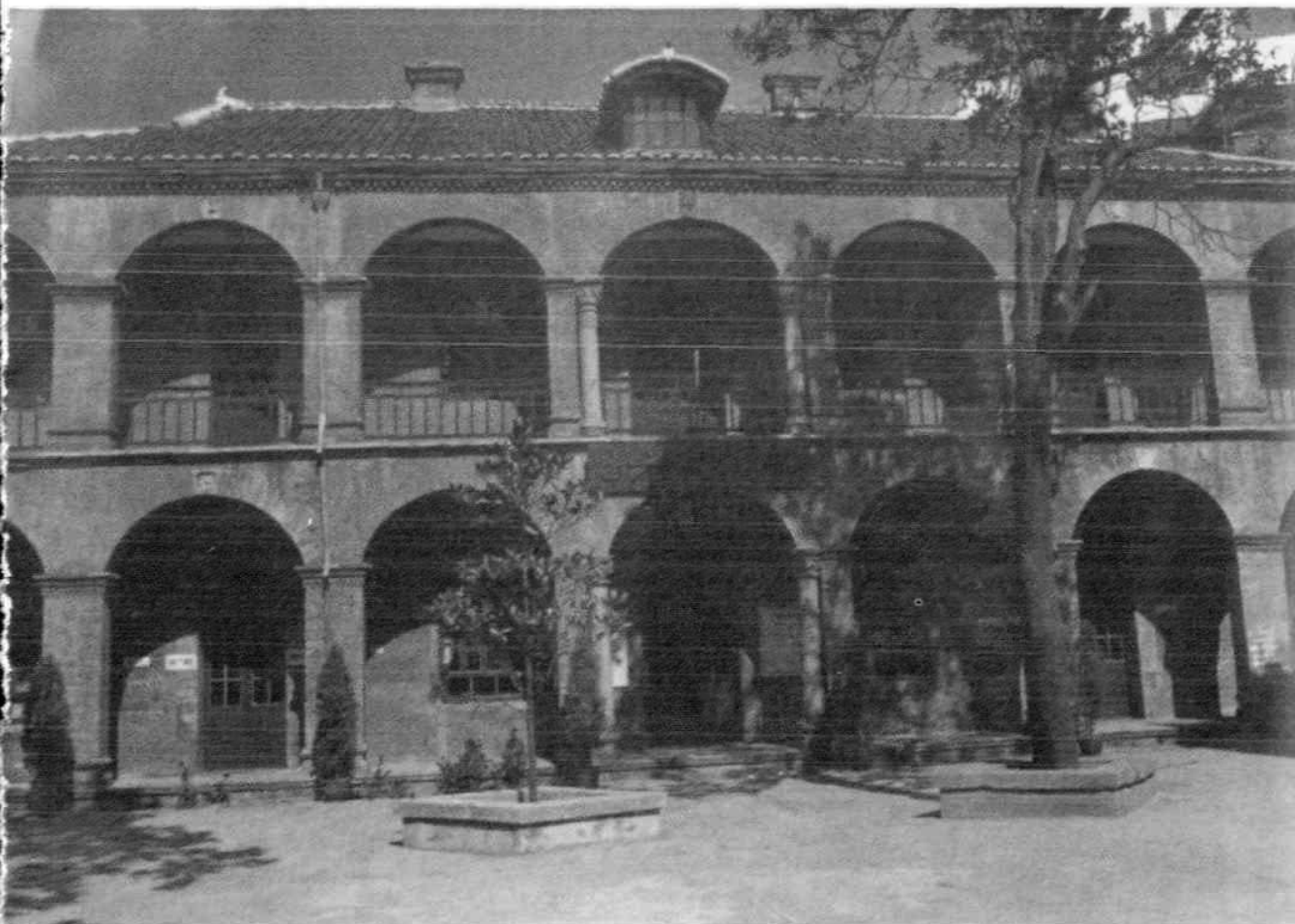
江西省南昌市的新四军军部旧址。