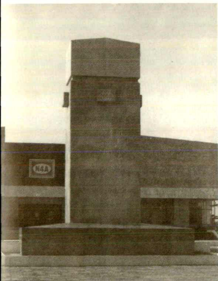
江苏省盐城市新四军纪念馆。