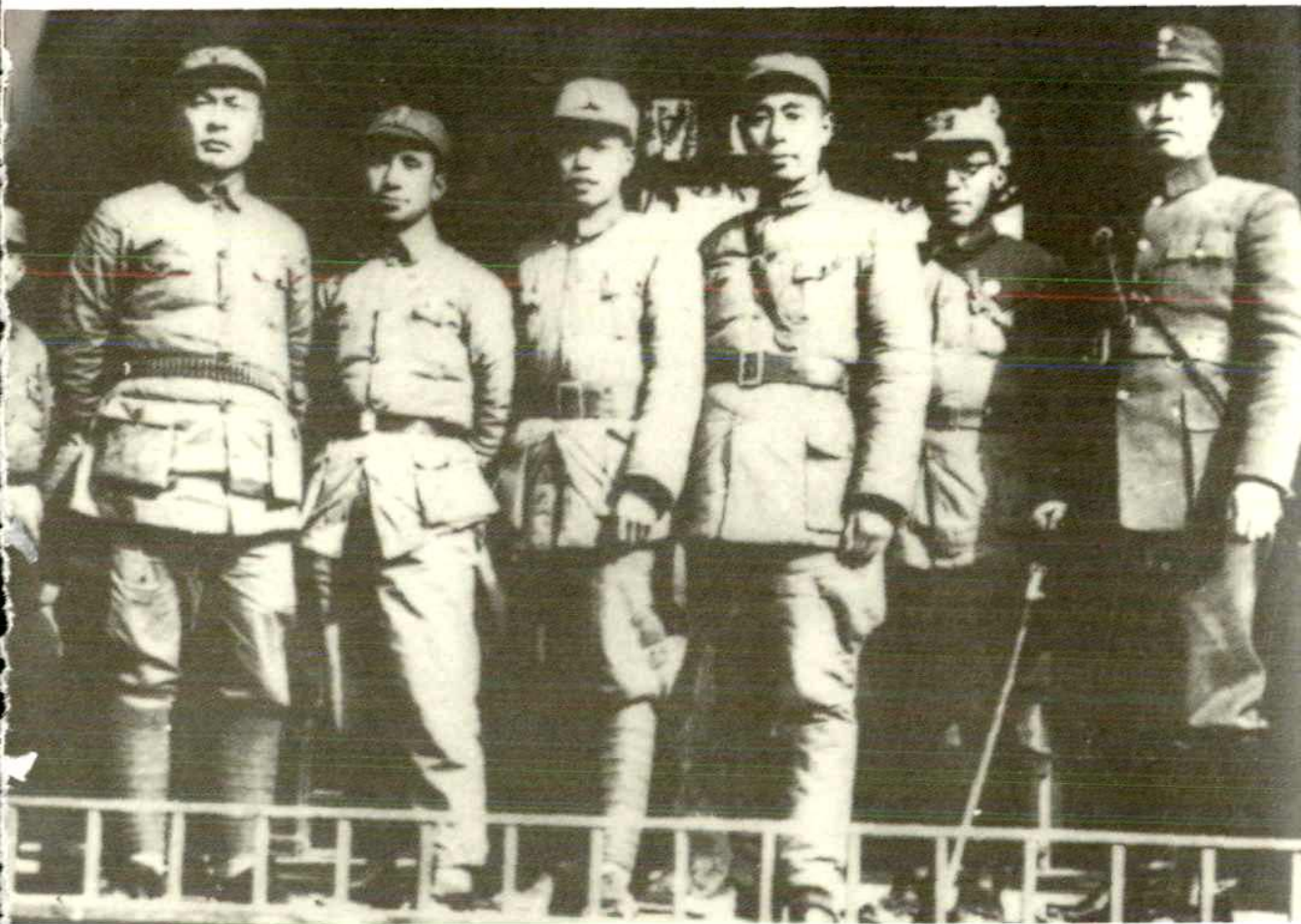
周恩来与新四军领导人在云岭(1939年)。左起:陈毅、粟裕、傅秋涛、周恩来、朱克靖、叶挺。