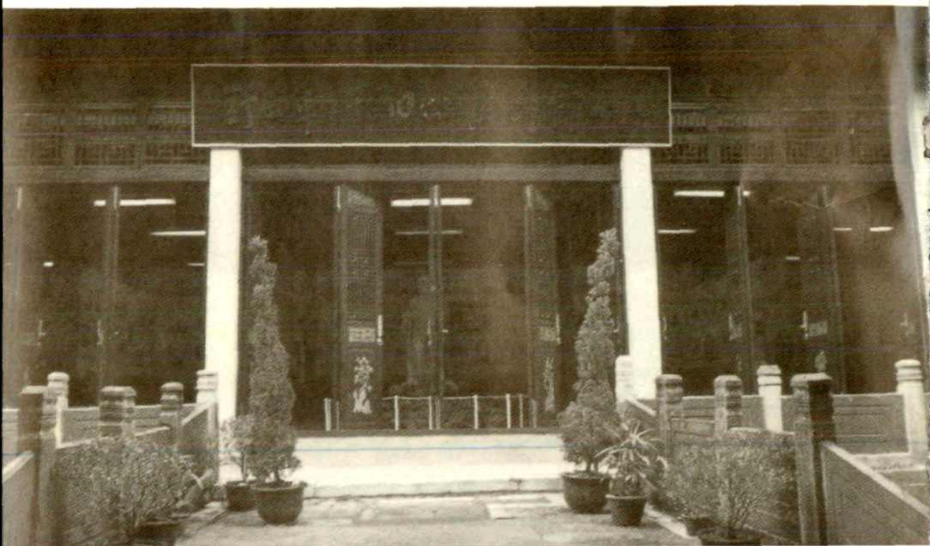
安徽云岭的新四军军部旧址。