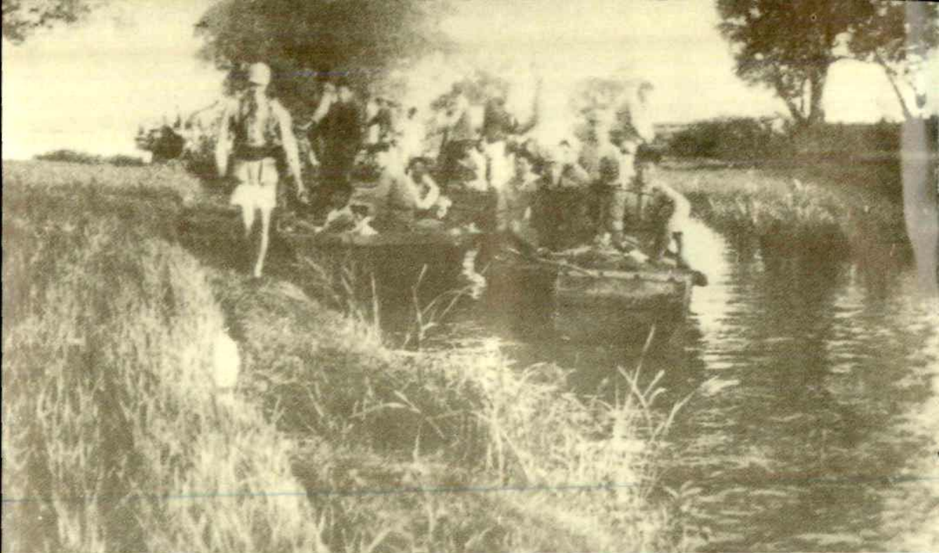
新四军在平原水网地区作战。