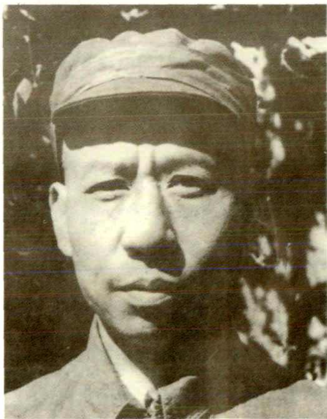
新四军政治委员刘少奇(1941年)。