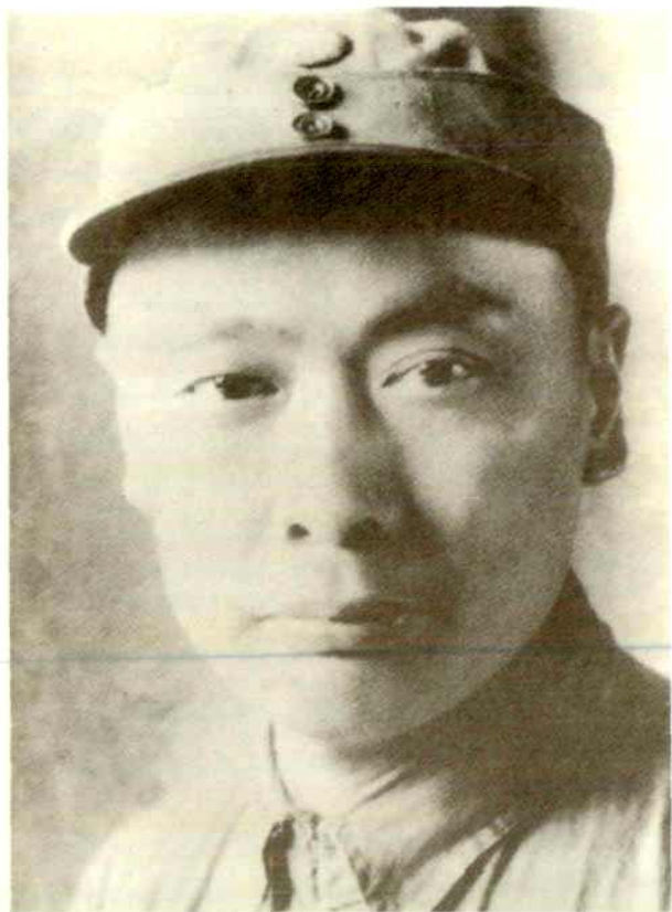
新四军代军长陈毅(1941年)。