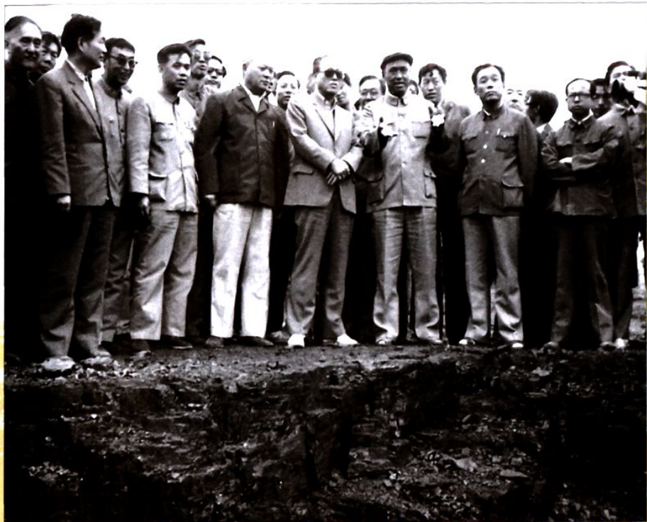
1986年5月，时任国务院总理赵紫阳视察神府煤田。 （前排左起第四位）介绍有关情况