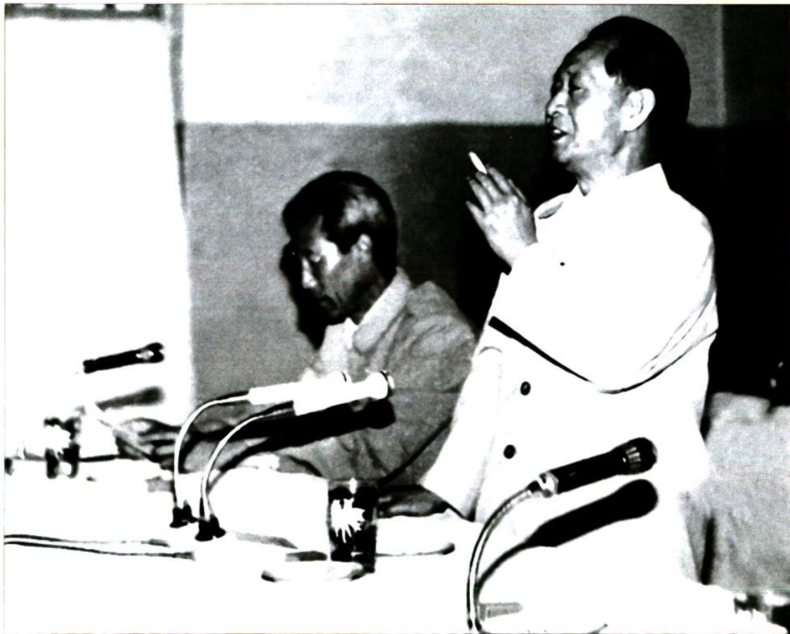
1985年6月，时任中共中央总书记胡耀邦来神木视察神府煤田开发。 图为胡总书记在神木县政府会议室作重要讲话