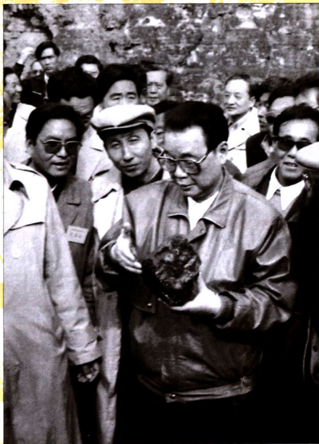
1988年10月，时任国务院总理李鹏视察神府煤田时， 手拿神木精煤与陪同人员亲切交谈