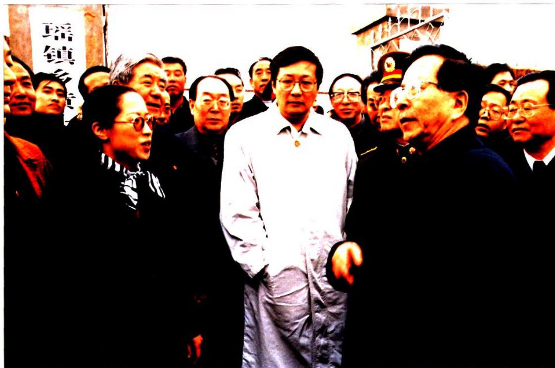
2002年3月，中共中央政治局常委、国家副主席曾庆红在神木县瑶镇乡黄土庙村与当地群众亲切交谈