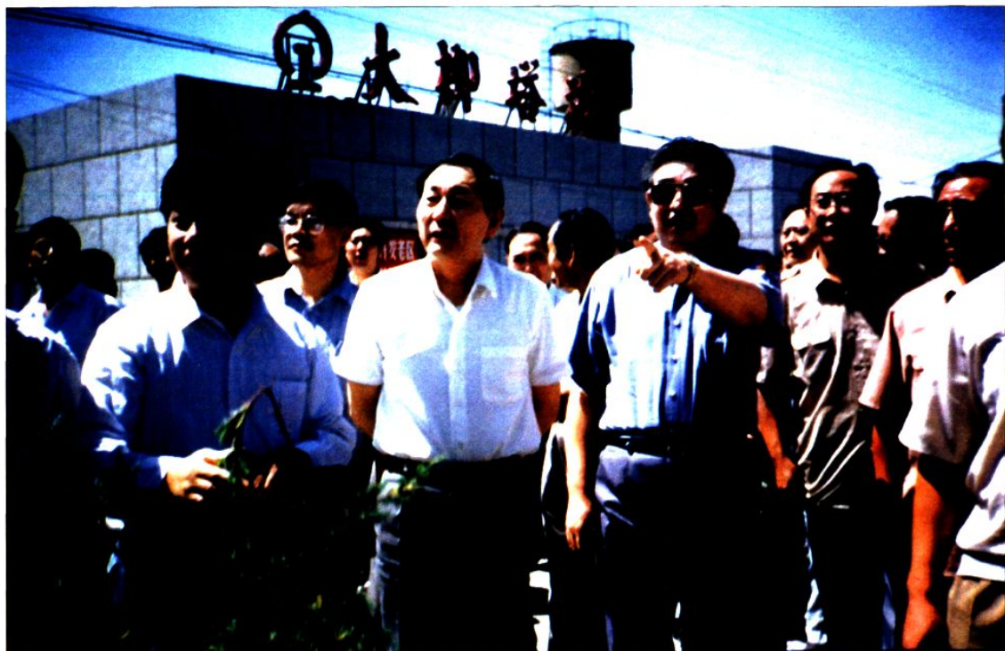
1992年8月17日，国务院副总理朱镕基来神木视察大柳塔煤矿