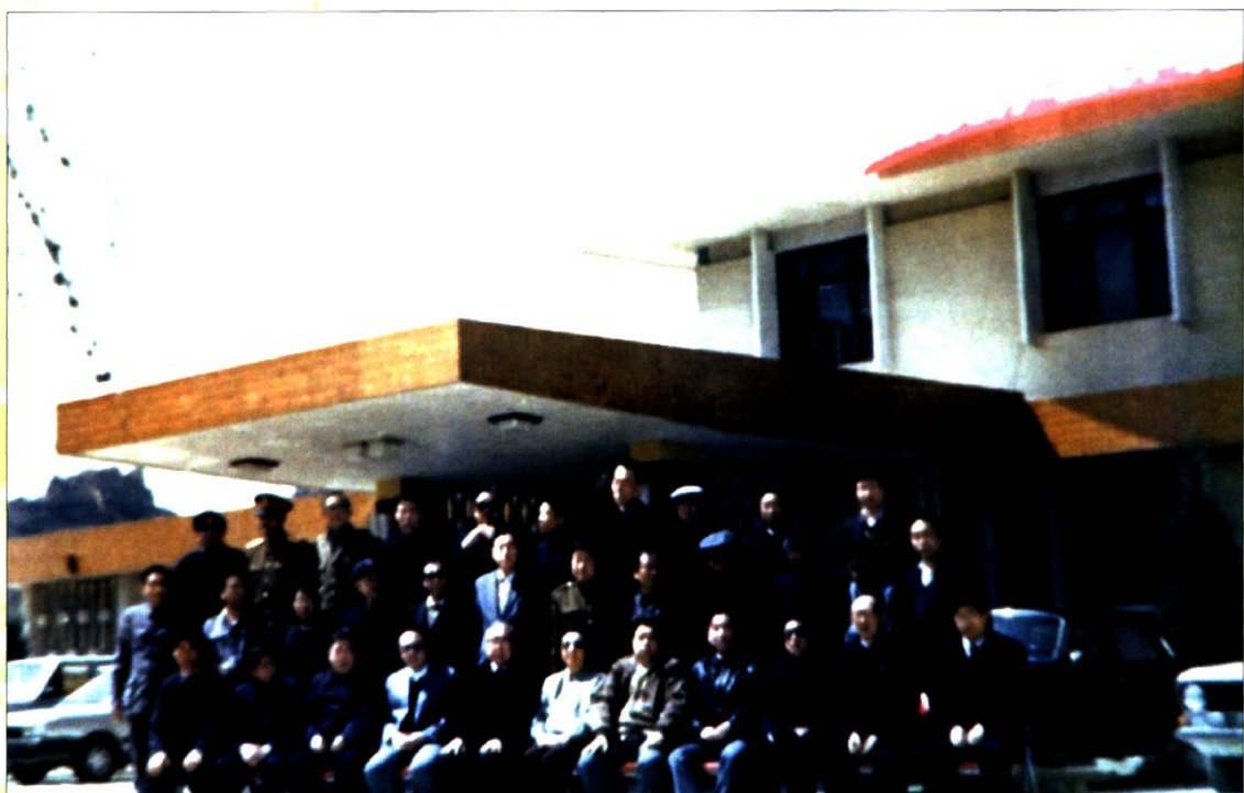
1991年4月3日，全国政协副主席钱正瑛在县宾馆门前同省、地、县有关领导合影