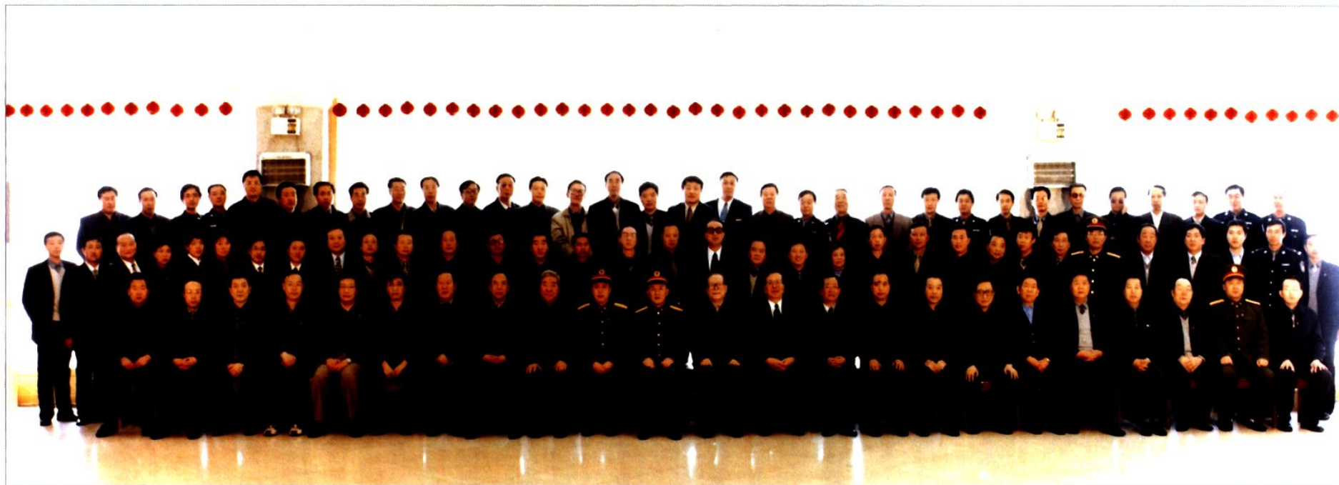
2002年3月，中共中央总书记、国家主席、中央军委主席江泽民一行在神木亚华宾馆与全体县级领导合影