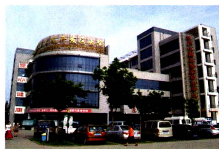
德州市人民医院开发区分院