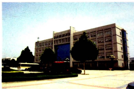
德州石油机械有限公司