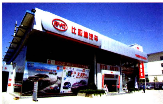
比亚迪汽车销售店