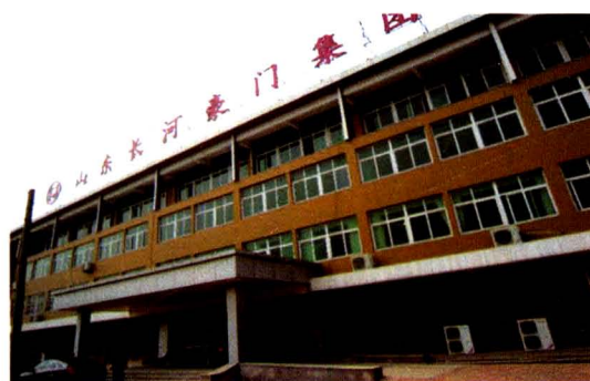
山东长河豪门集团