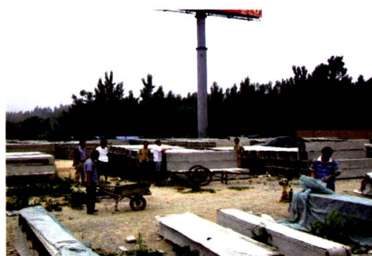
德州经济开发区同捷水泥制品厂