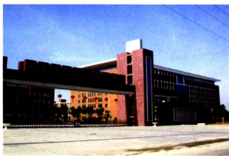
德州市第一中学新校区