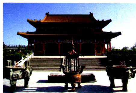
具有 1200 余年历史的“永庆寺”