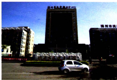
德州市民政事业园