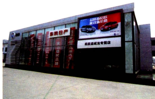
启辰盛威龙汽车专营店