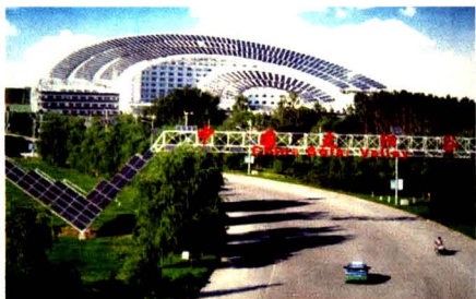
享誉全球的中国太阳谷