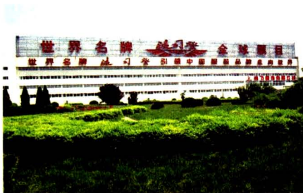
世界著名品牌：波司登服装有限公司