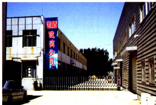
德州金盾玻璃有限公司