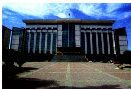
德州市经济开发区管委会办公大楼