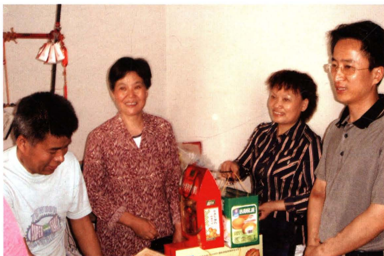
2008年，街道领导慰问困难户