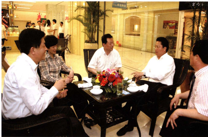
2009年5月9日，江苏省常委、无锡市委书记杨卫泽 在广益街道调研建材家居市场