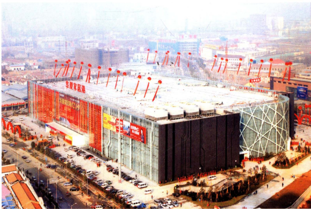
2008年12月19日，无锡市最大建材单体市场——华夏家居港