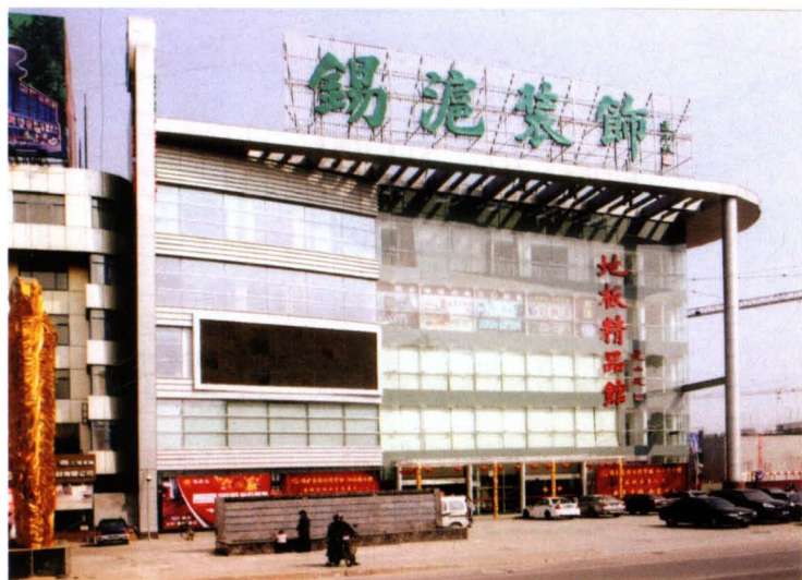
2008年8月，锡沪装饰材料市场