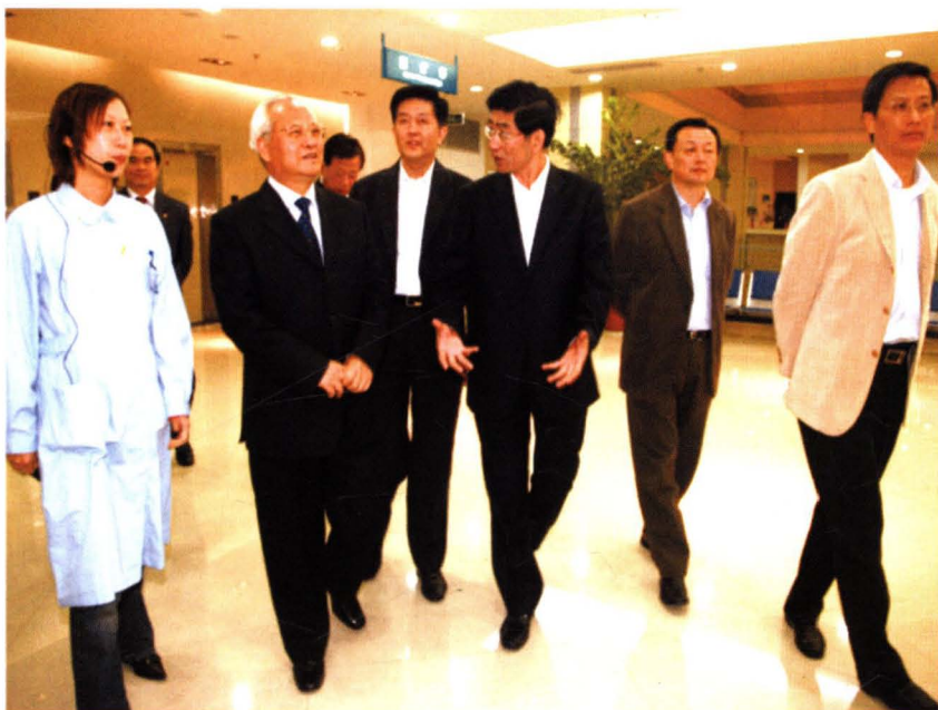
2007年11月20日，国家民政部长李学举在无锡市长毛小平陪同下视察广益睦邻中心