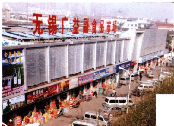
1992年12月，广益商城副食品批发市场