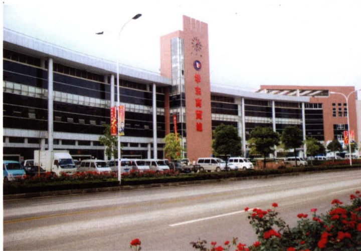
2004年12月28日，华东商贸城