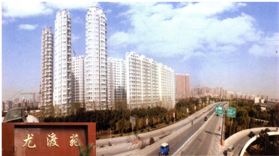
① 2005年，农民新型安置房尤渡苑住宅群