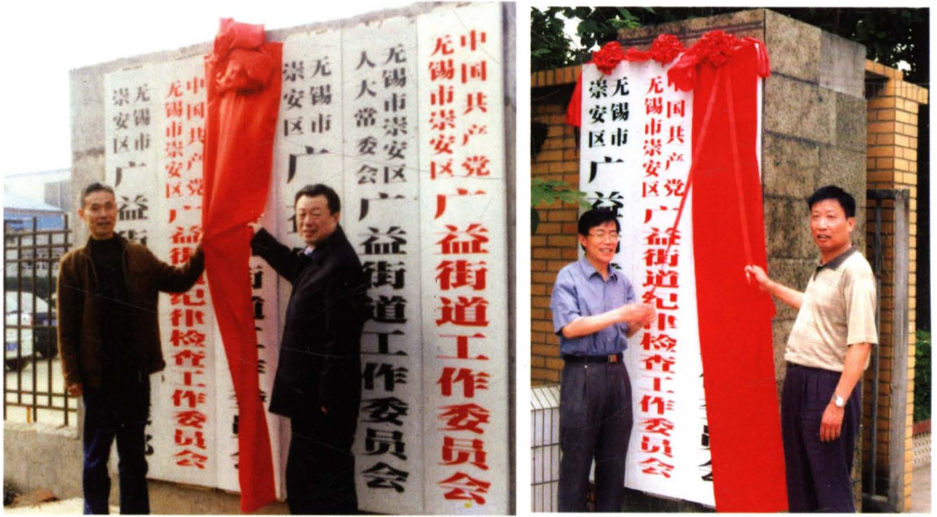
2004年5月28日，撤镇建街道揭牌仪式