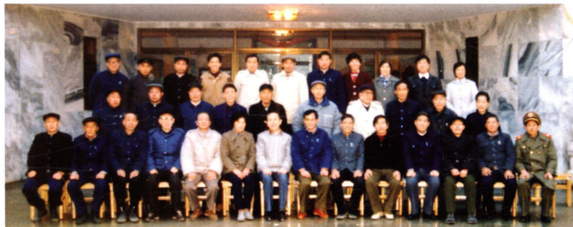
1958~1989年间，曾任广益乡（公社）党政领导的老干部合影