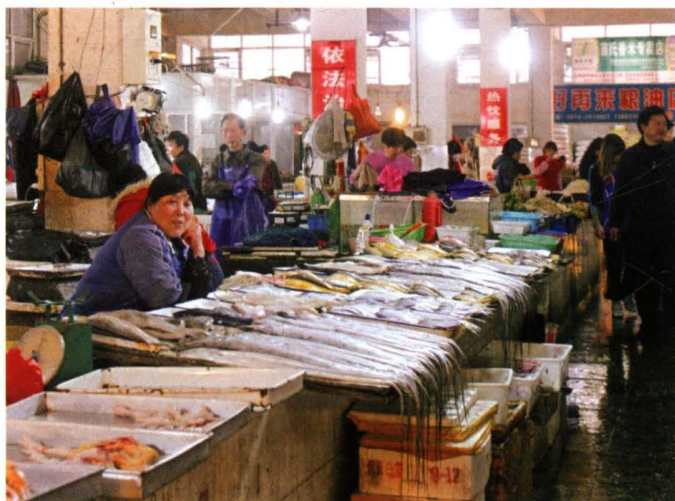
1985年4月，丁村农贸市场