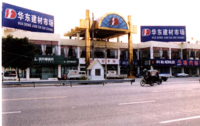
1995年9月，华东建材市场