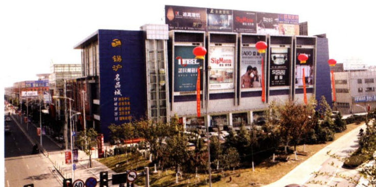
2006年，锡沪装饰名品城