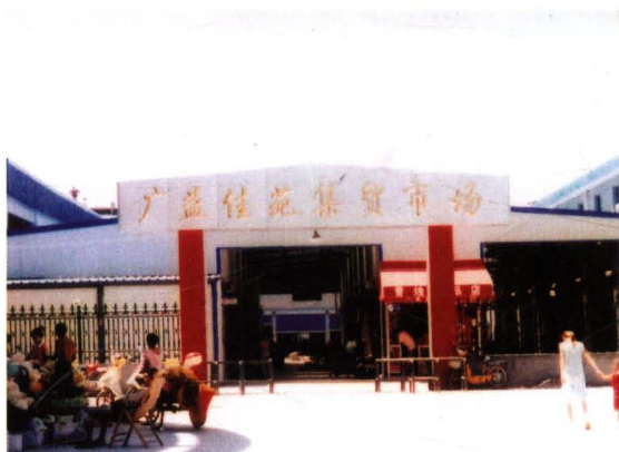
2004年，广益佳苑集贸市场