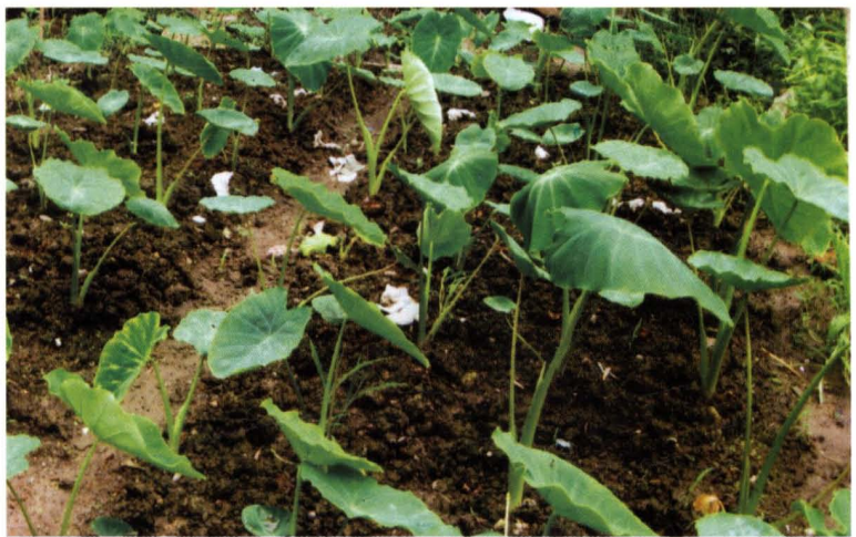
1978年，毛岸大队特色 蔬菜——芋头