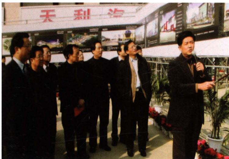
2005年12月8日，无锡市委、市人大、市政府、市政协领导 班子成员视察广益街道、崇安新城（广益片区）规划建设