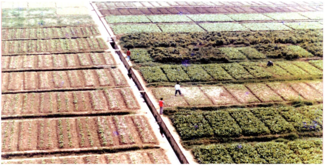
20世纪80年代，蔬菜格田成方