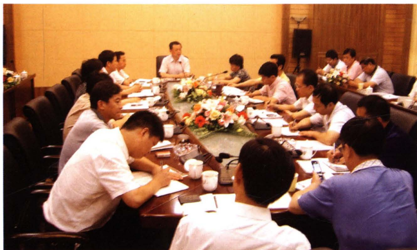
2008年7月，街道党工委扩大会议