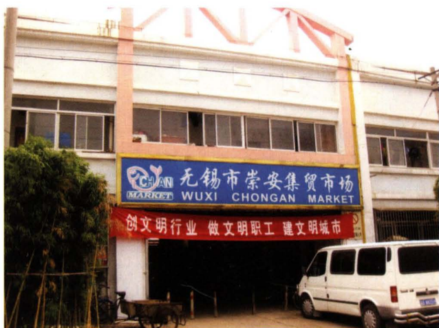
2003年7月，崇安集贸市场