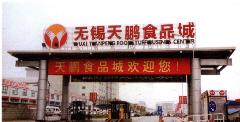
2007年3月6日，无锡天鹏食品城