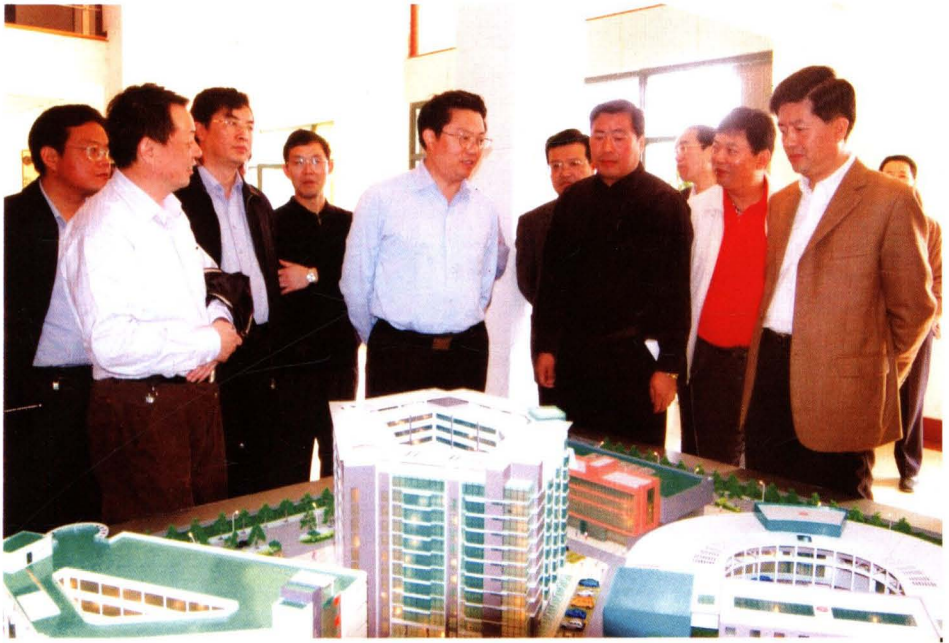
2005年，市委书记杨卫泽和崇安区委书记蒋伟坚在调研广益汽配城建设