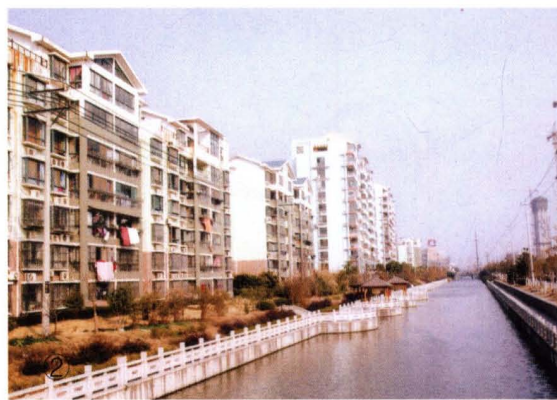
③ 2004年，农民新型安置房广益星苑住宅群