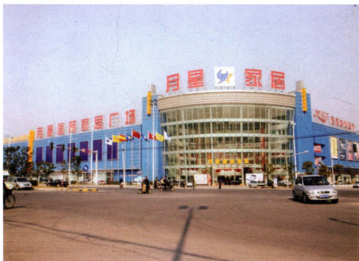
2006年5月，月星国际家居广场