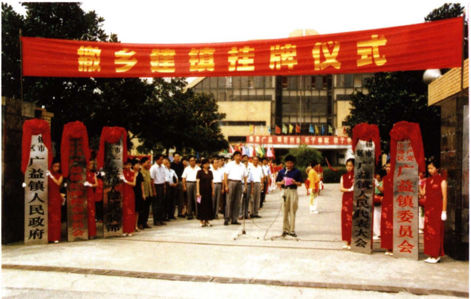
1999年8月18日，撤乡建镇挂牌仪式