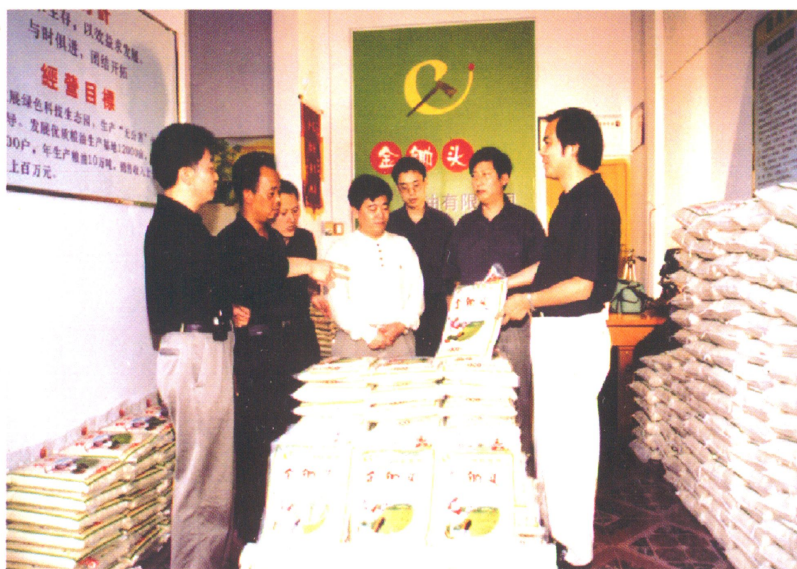
县委书记曹建国一行 视察金锄头粮油有限公司