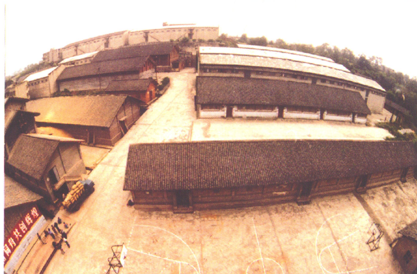
四川乐至国家粮食储备库部分仓容