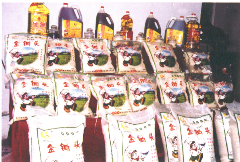
金锄头粮油有限公司 部分产品