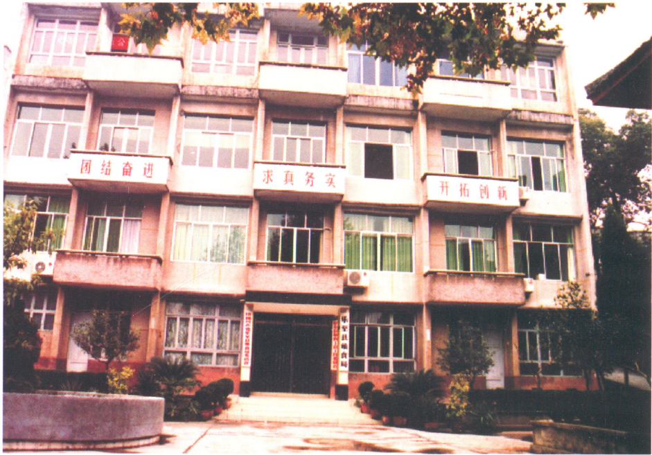
粮食局办公楼全景