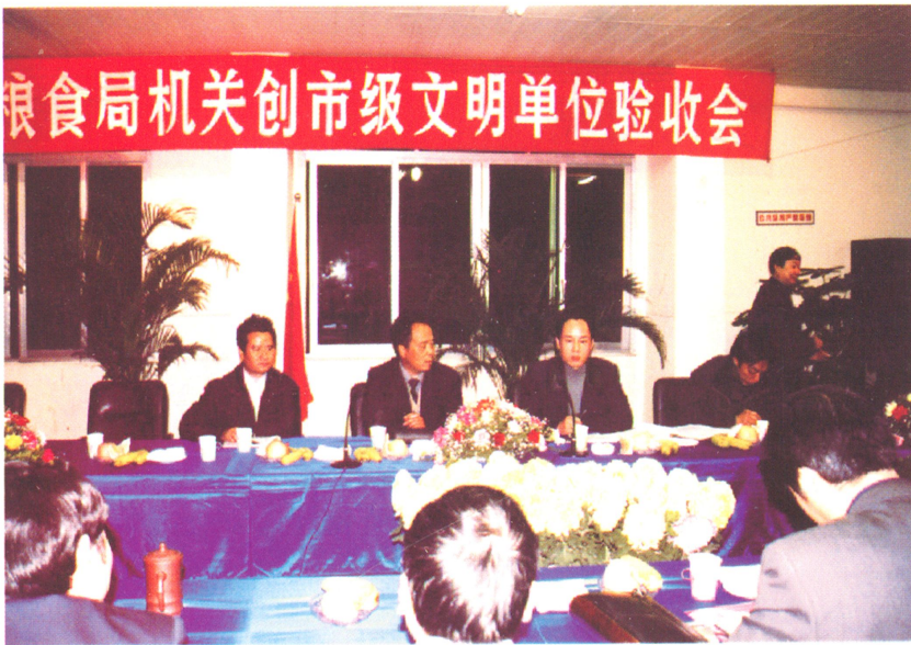
2002年市文明办验收粮食局机关新创市级文明单位合格