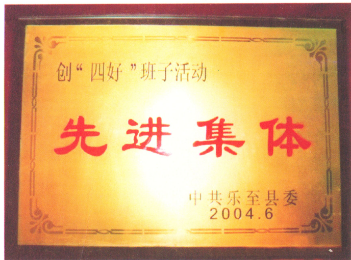
2004年6月，粮食局党委被县委评为创“四好”班子活动先进集体