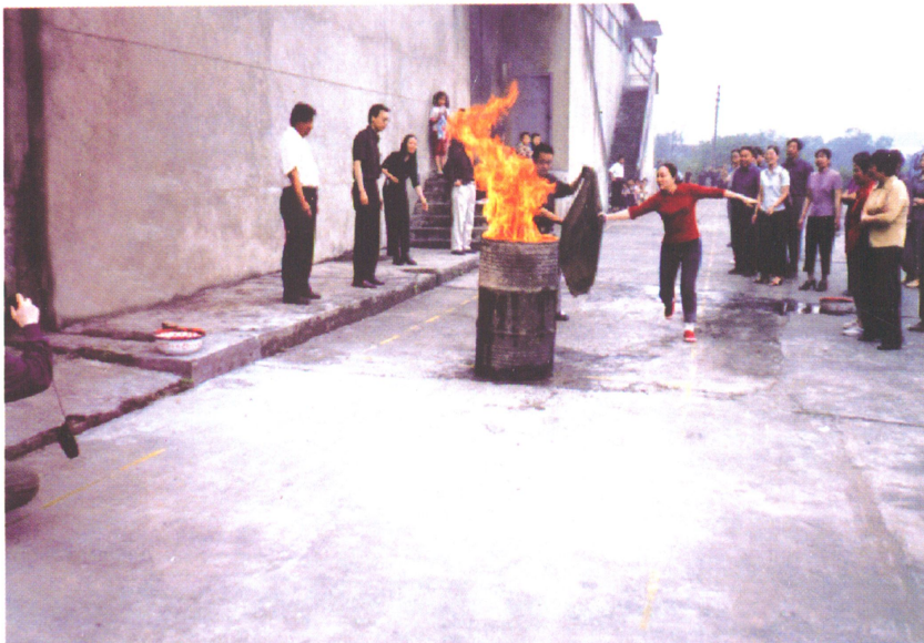
2002年粮食局组织粮食系统进行消防演练