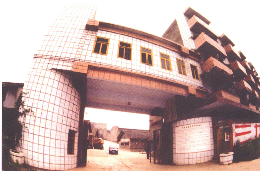
四川乐至国家粮食储备库