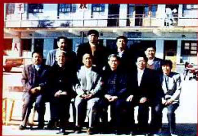
1996年审定村志时在外工作的部分领导 同本村两委主干在一起