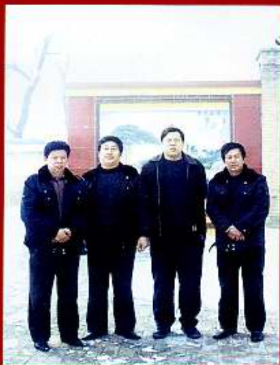
2006年支委成员在一起