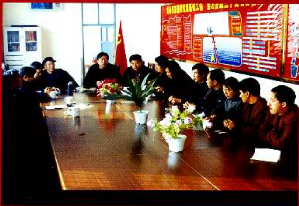
编纂人员与两委干部在座谈会上