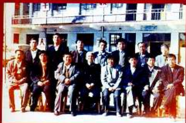
1996年审定村志时两委干部合影