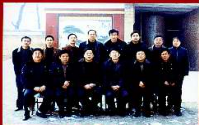
2006年两委成员在一起